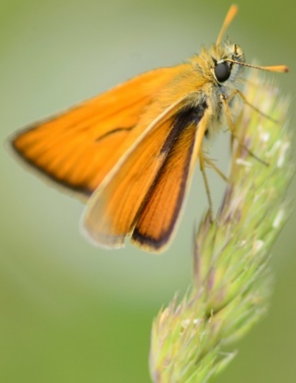
kratkočrti debeloglaviček ( Thymelicus lineola )