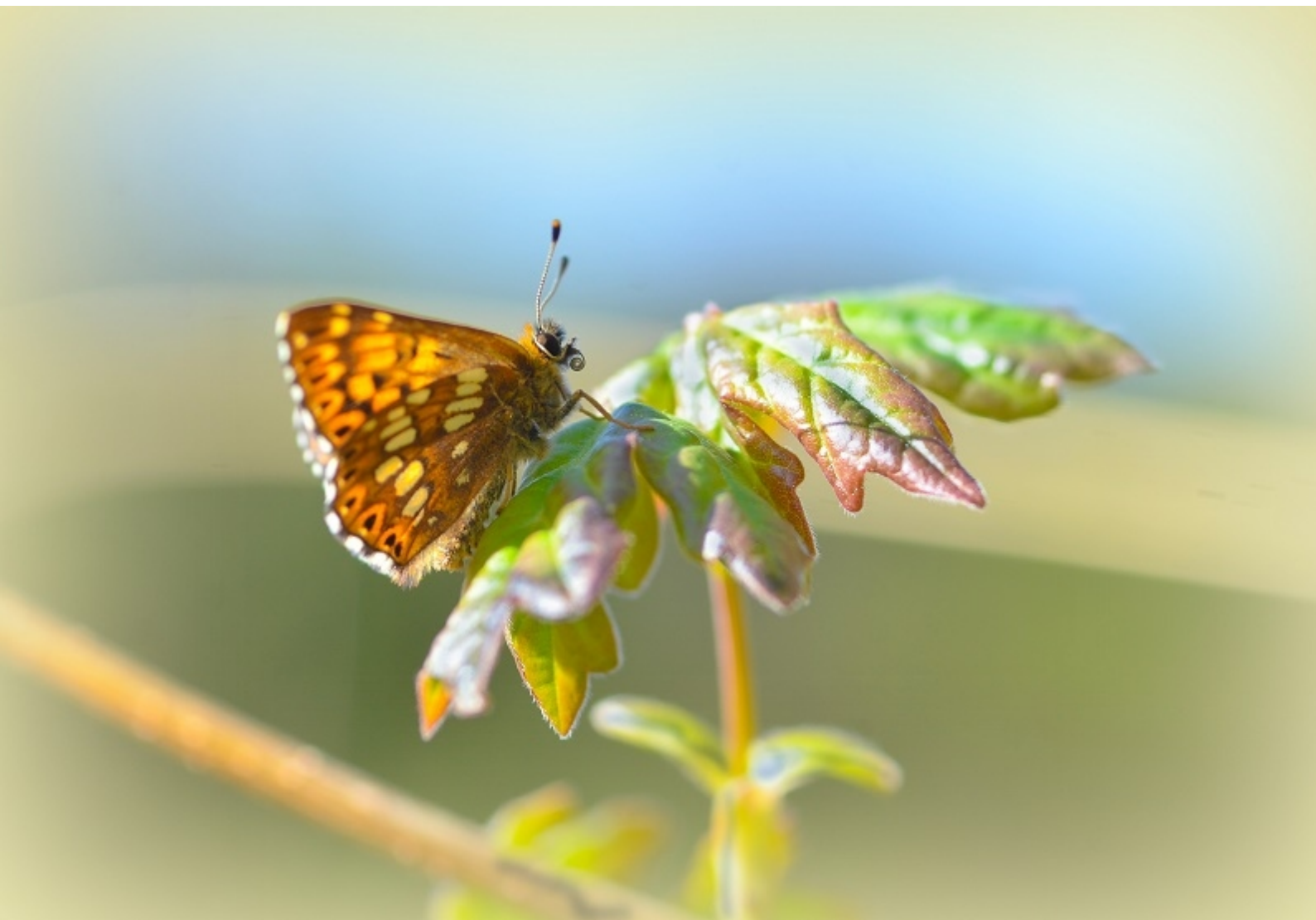
rjavi šekavček ( Hamearis lucina )