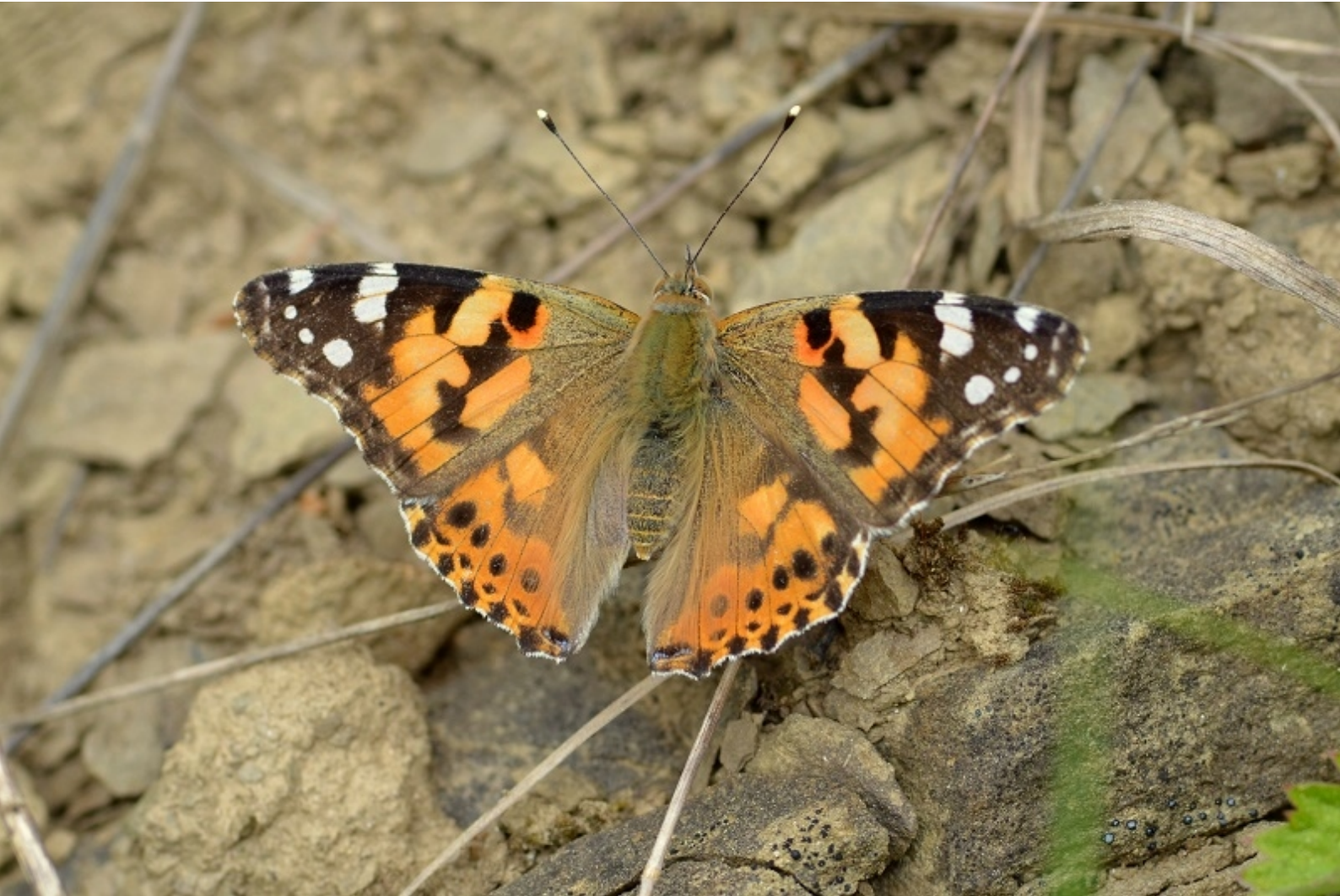
osatnik ( Vanessa cardui )