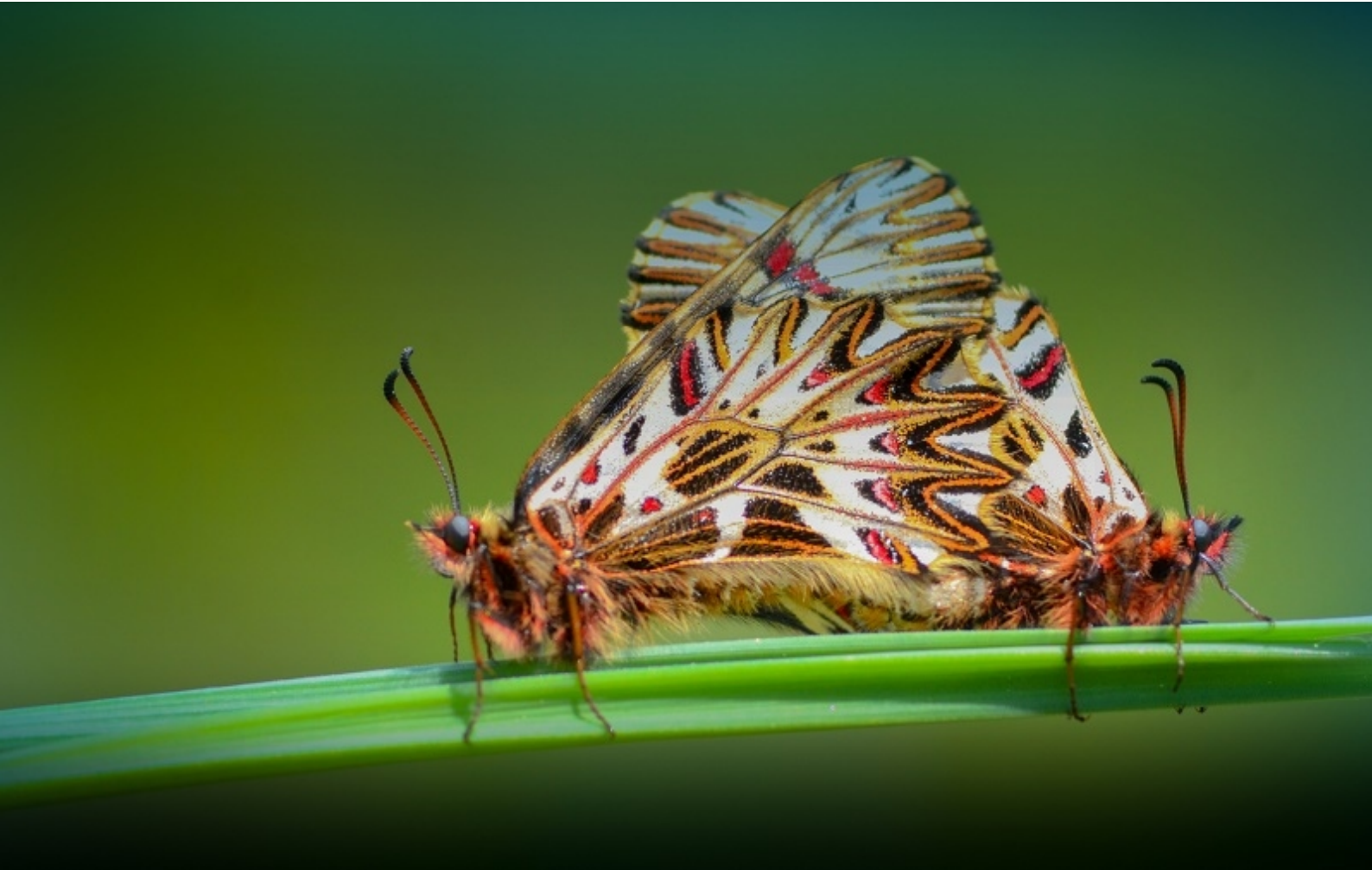
petelinček ( Zerynthia polyxena )