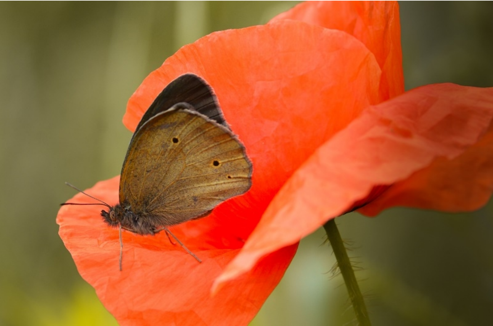
navadni lešnikar ( Maniola jurtina )