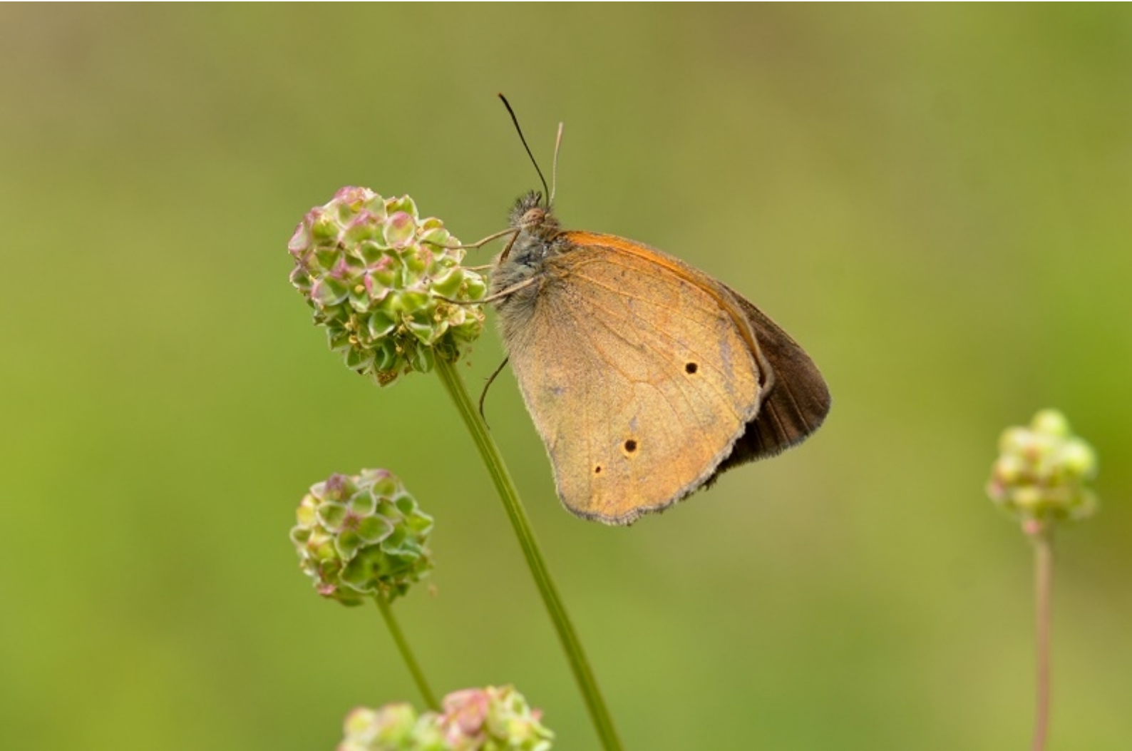
navadni lešnikar ( Maniola jurtina )