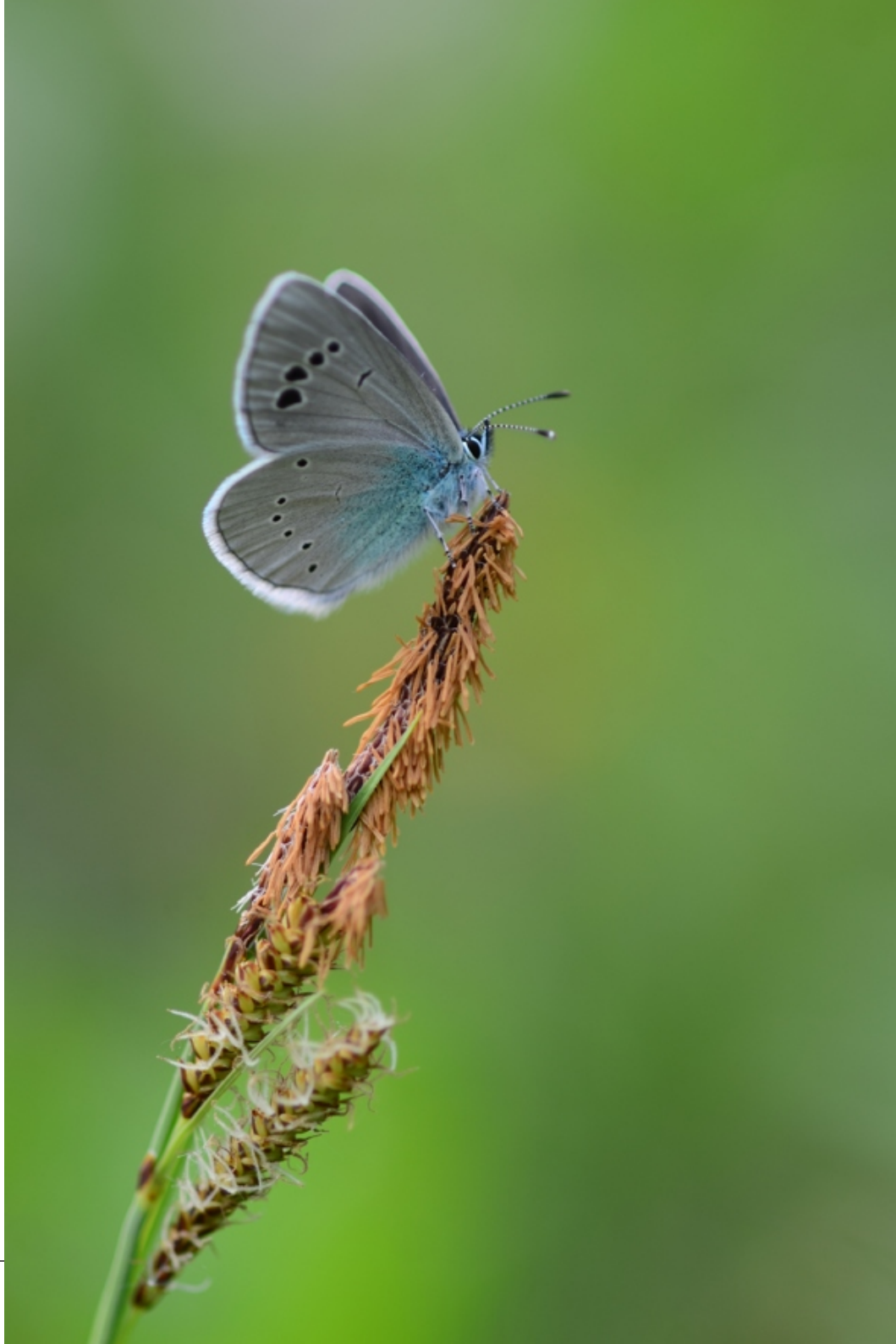
grabovčev iskrivček ( Glaucopsyche alexis )