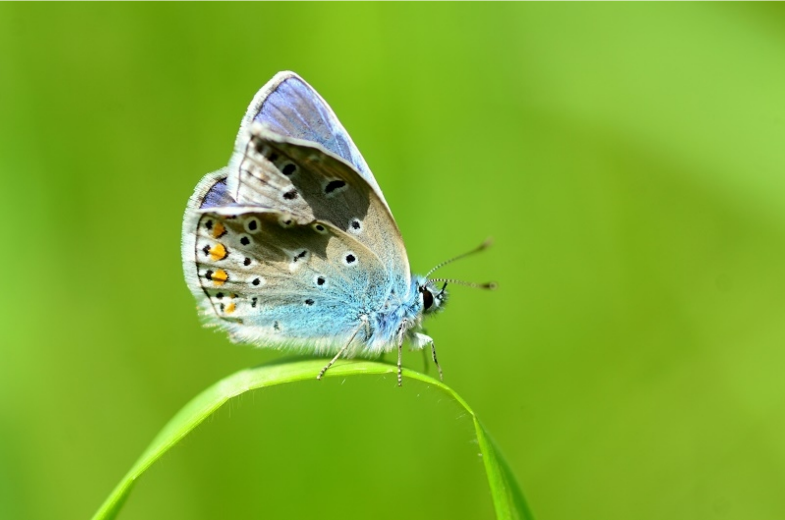
navadni modrin ( Polyommatus icarus )