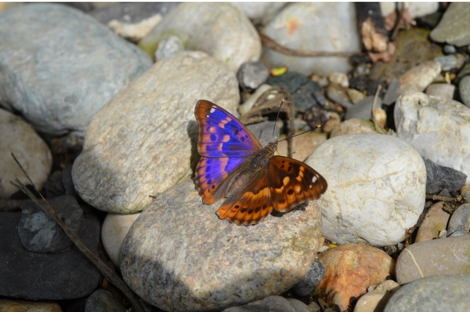
mali spreminjavček ( Apatura ilia )