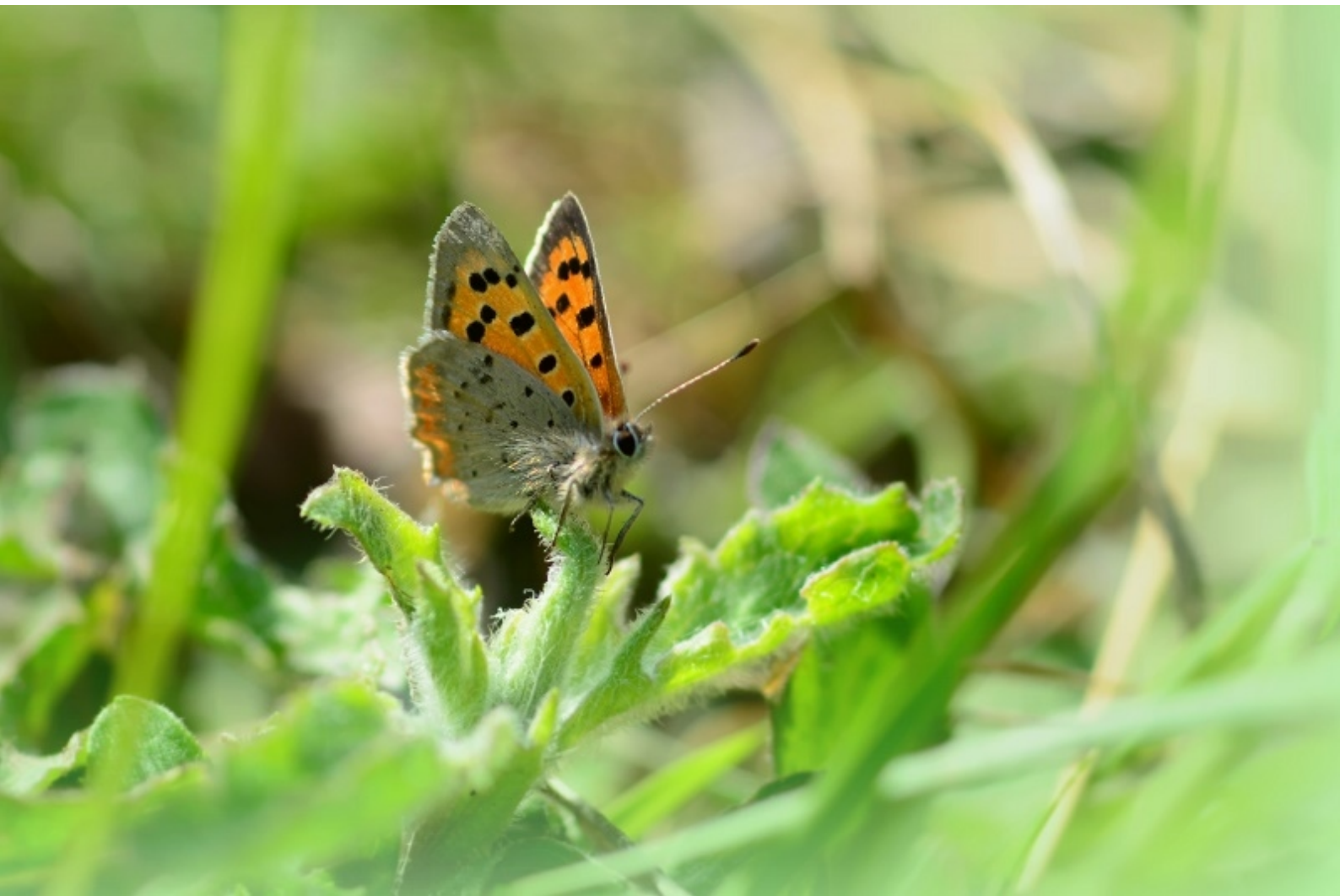
mali cekinček ( Lycaena phlaeas )