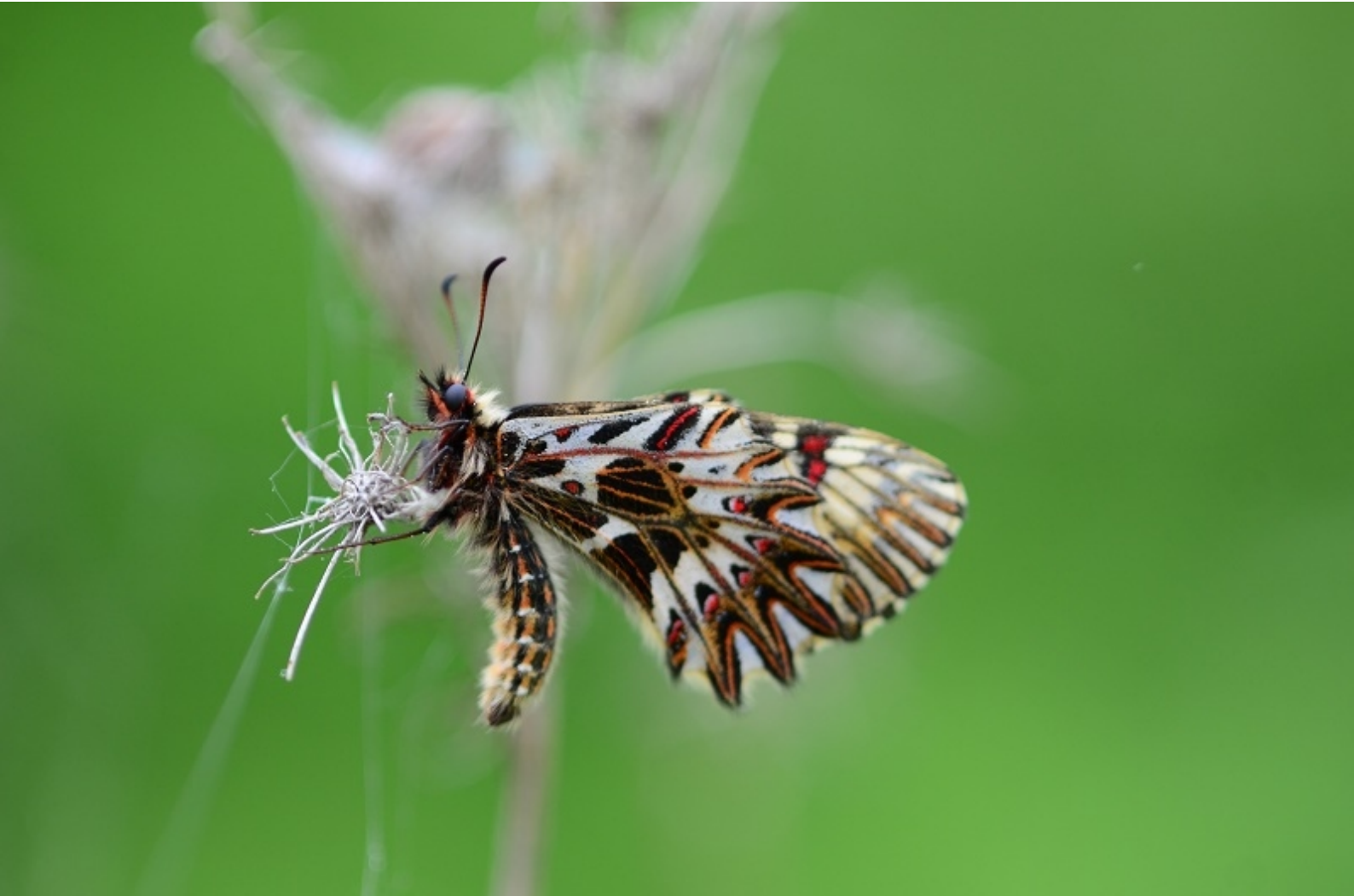
petelinček ( Zerynthia polyxena )