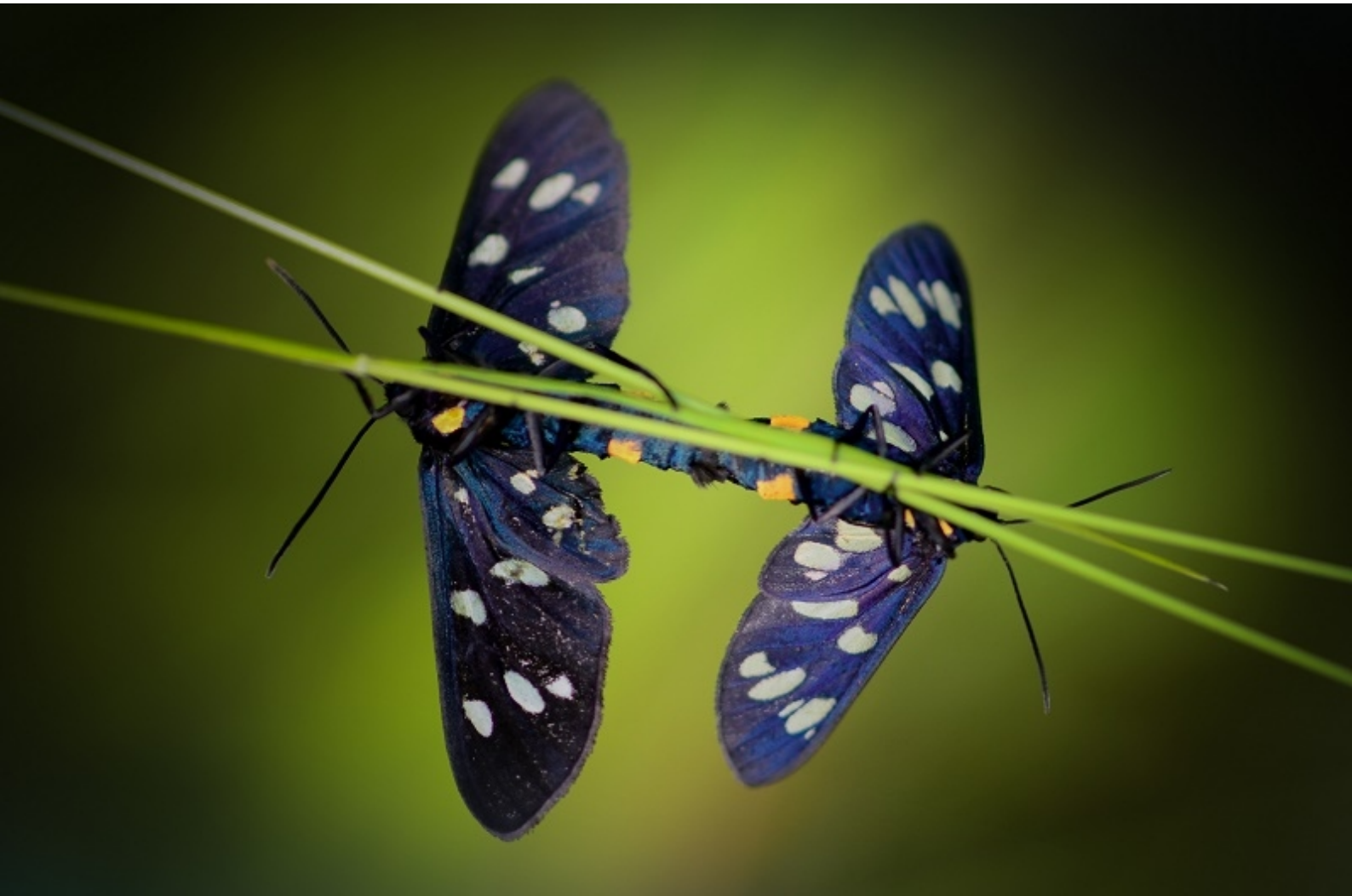
navadna ivanjska ptičica ( Amata pbegea )