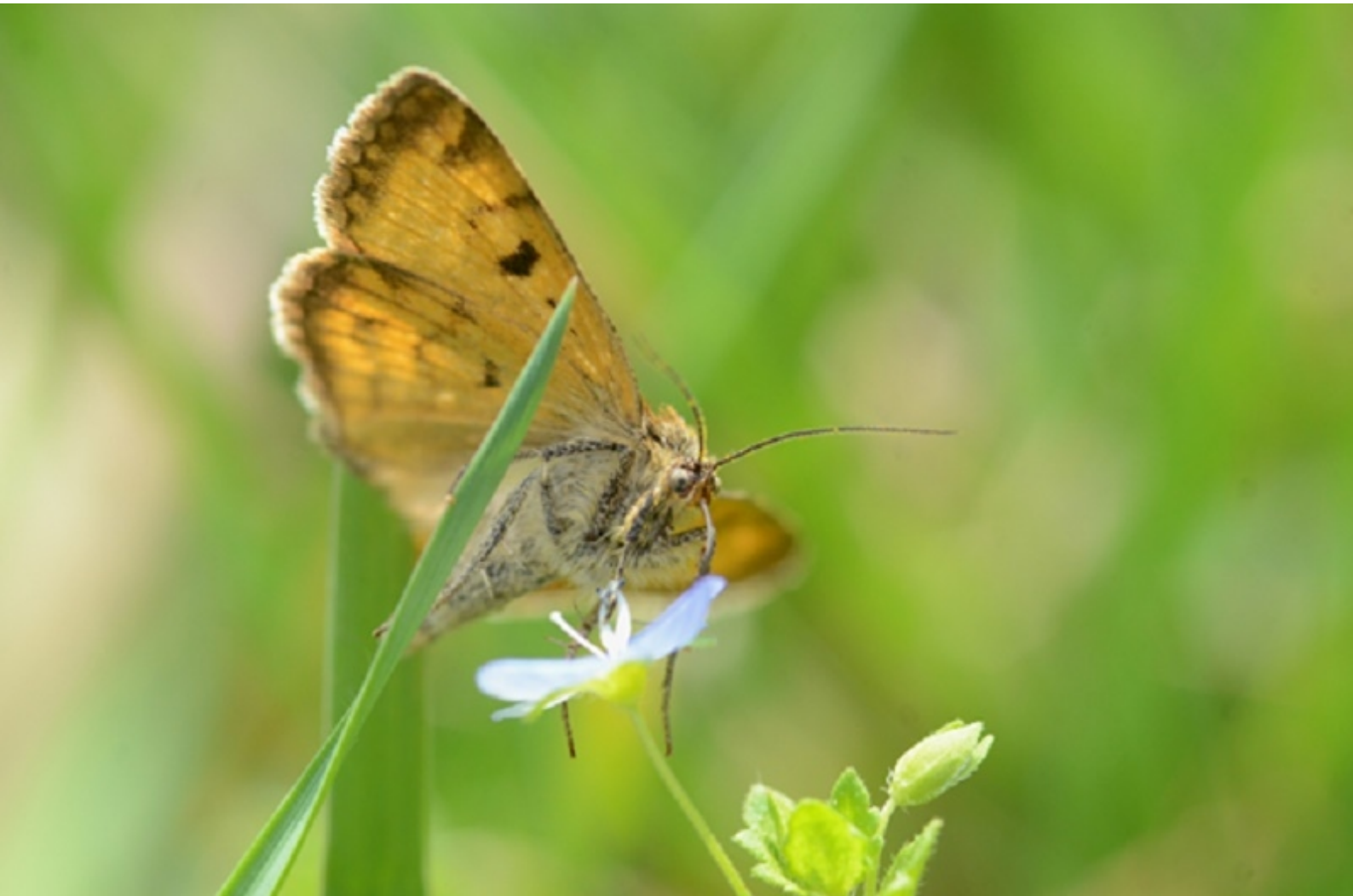
deteljna sovka ( Euclidia glyphica )