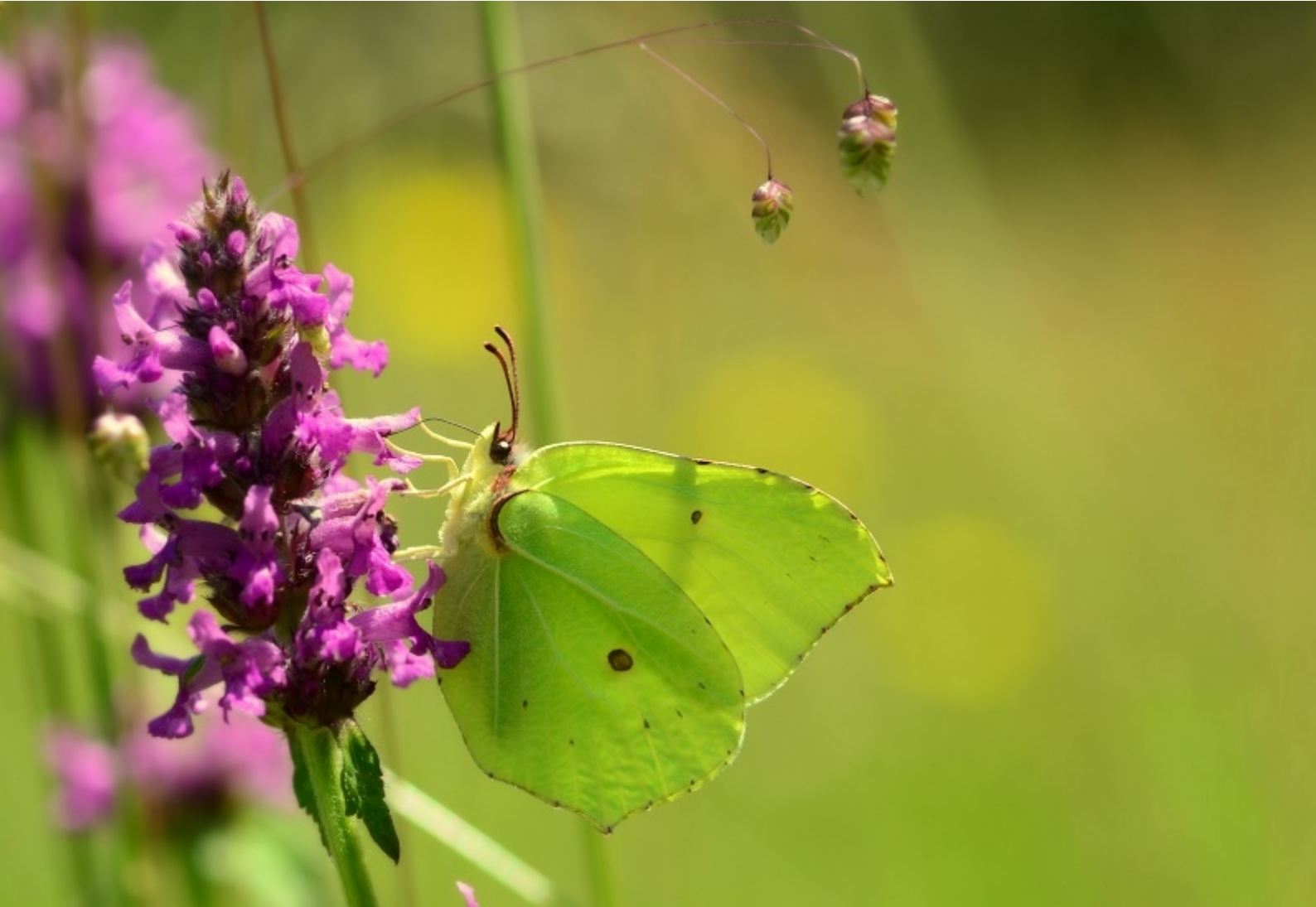
citronček ( Gonepteryx rhamni )