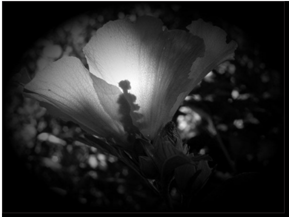
Cvetlica in ženska. Avtoportet.