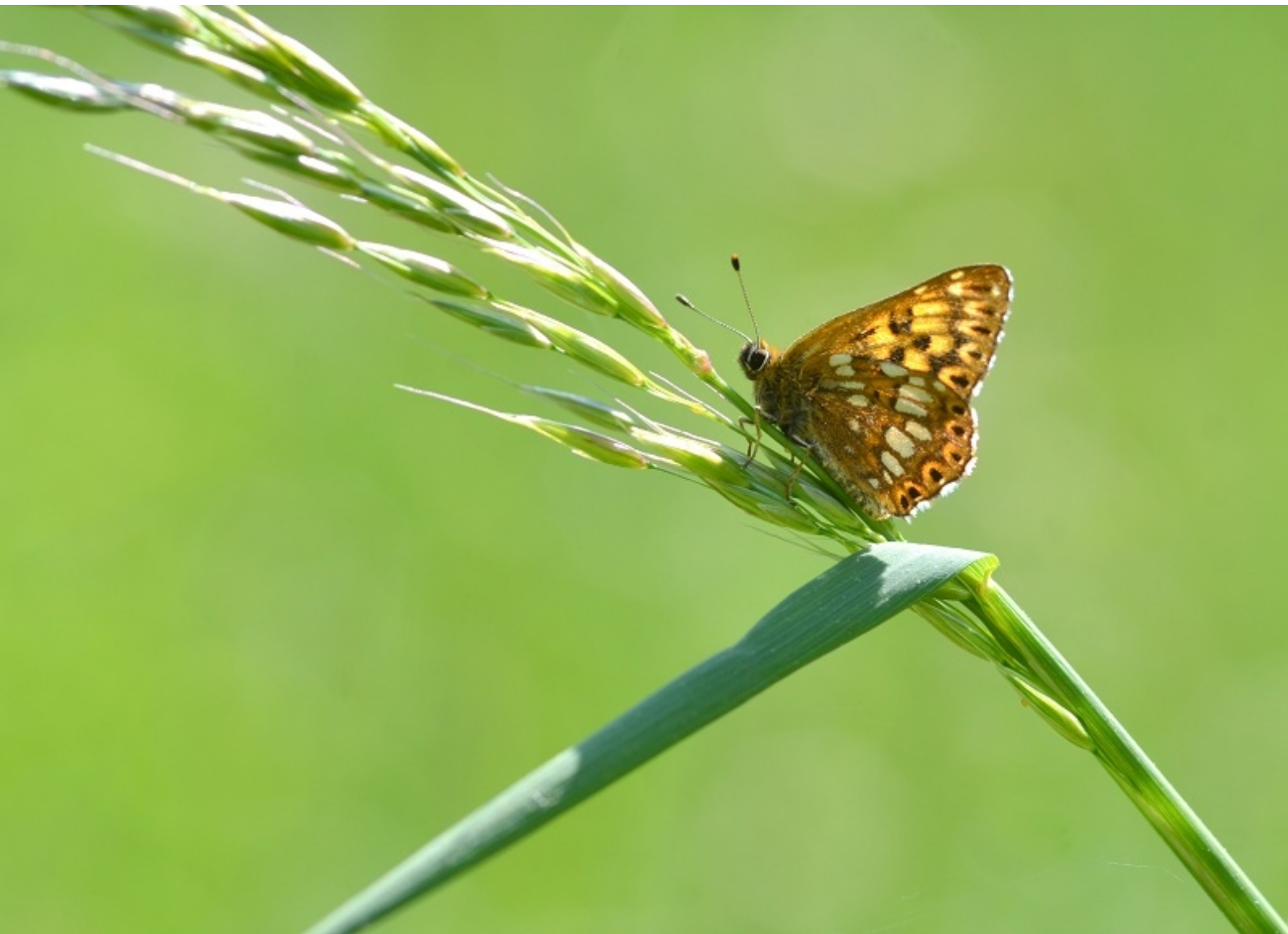
rjavi šekavček ( Flamearis lucina )