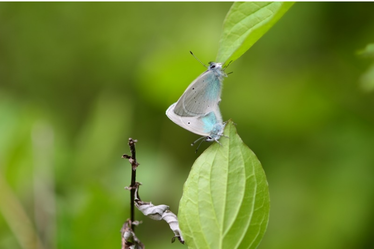
grabovčev iskrivček ( Glaucopsyche alexis )