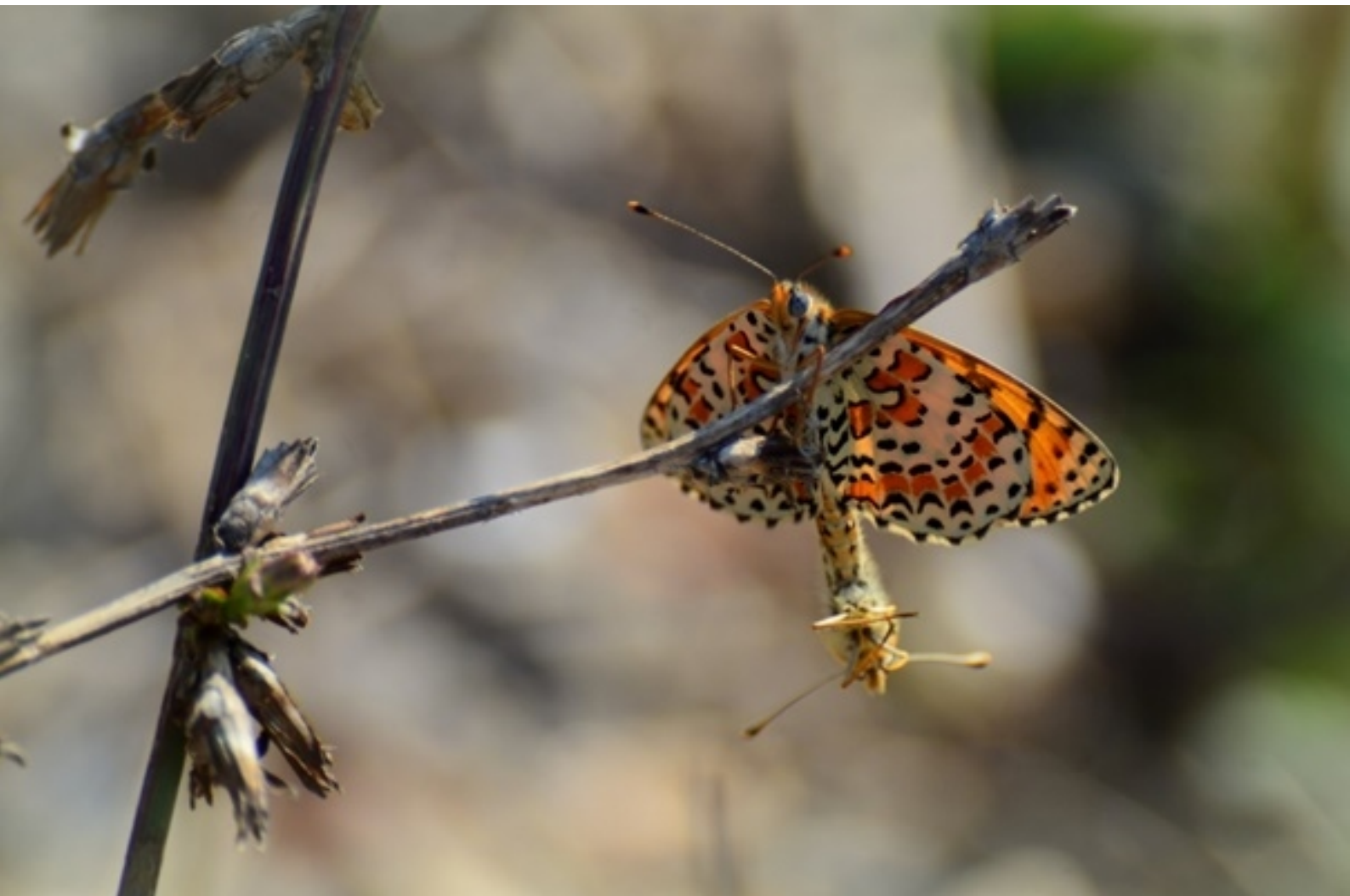
rdeči písanček ( Melitaea didyma )