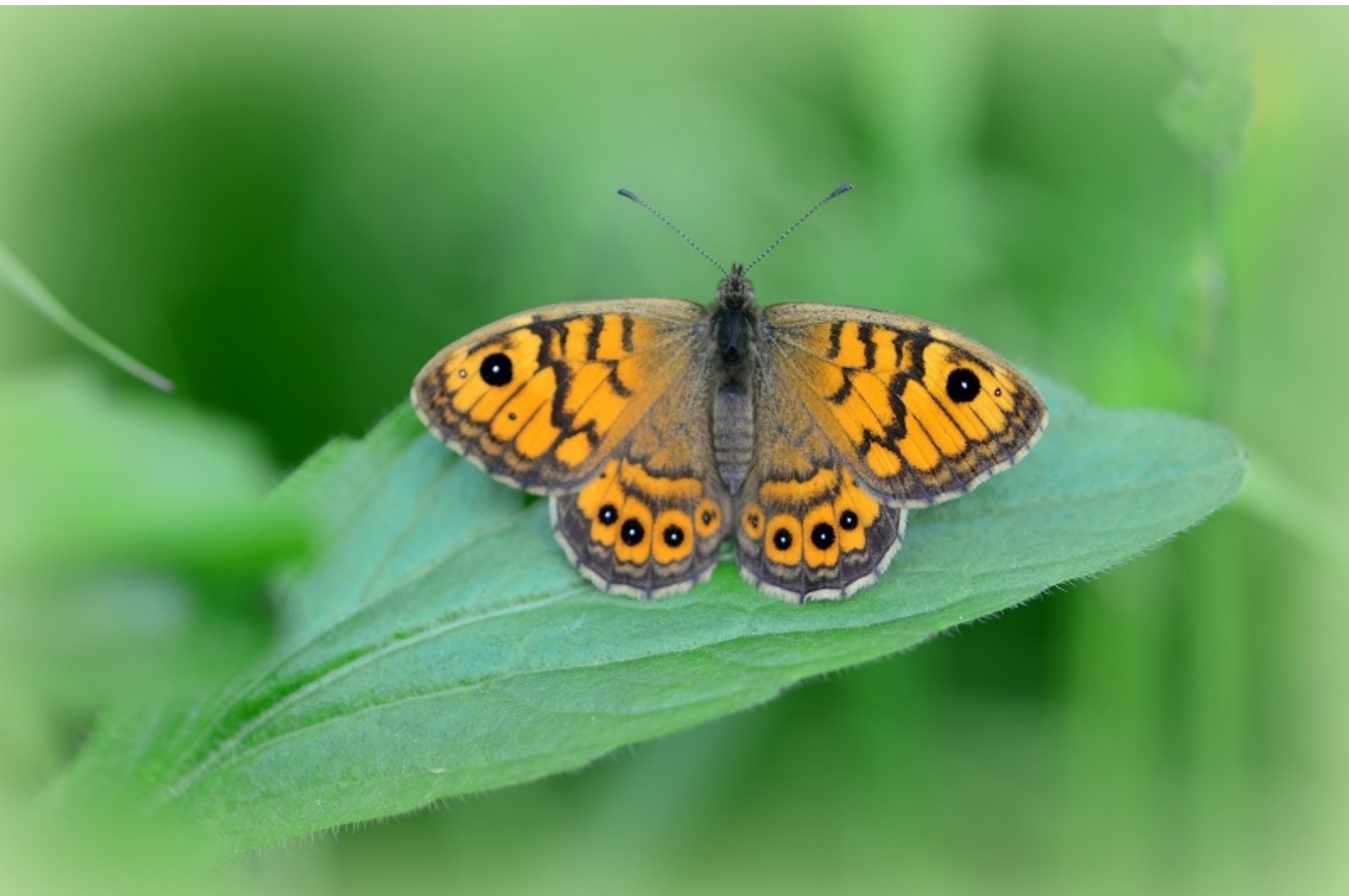
okrasti skalnik ( Lasiommata megera )