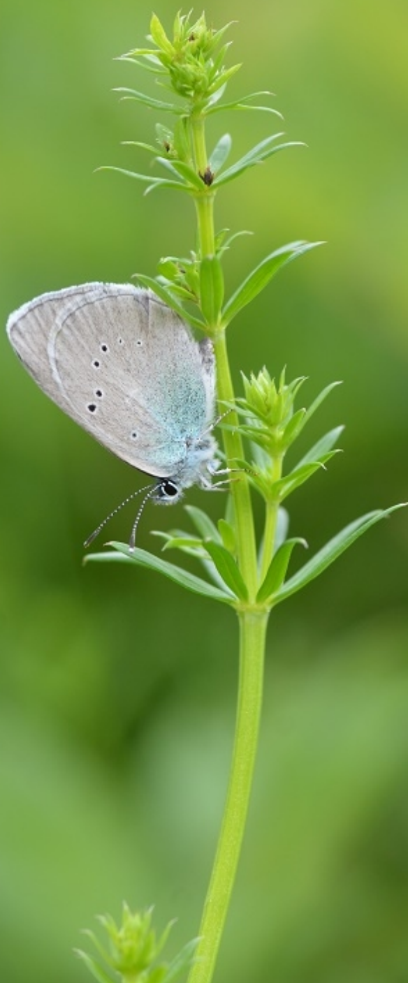
grabovčev iskrivček ( Glaucopsyche alexis )