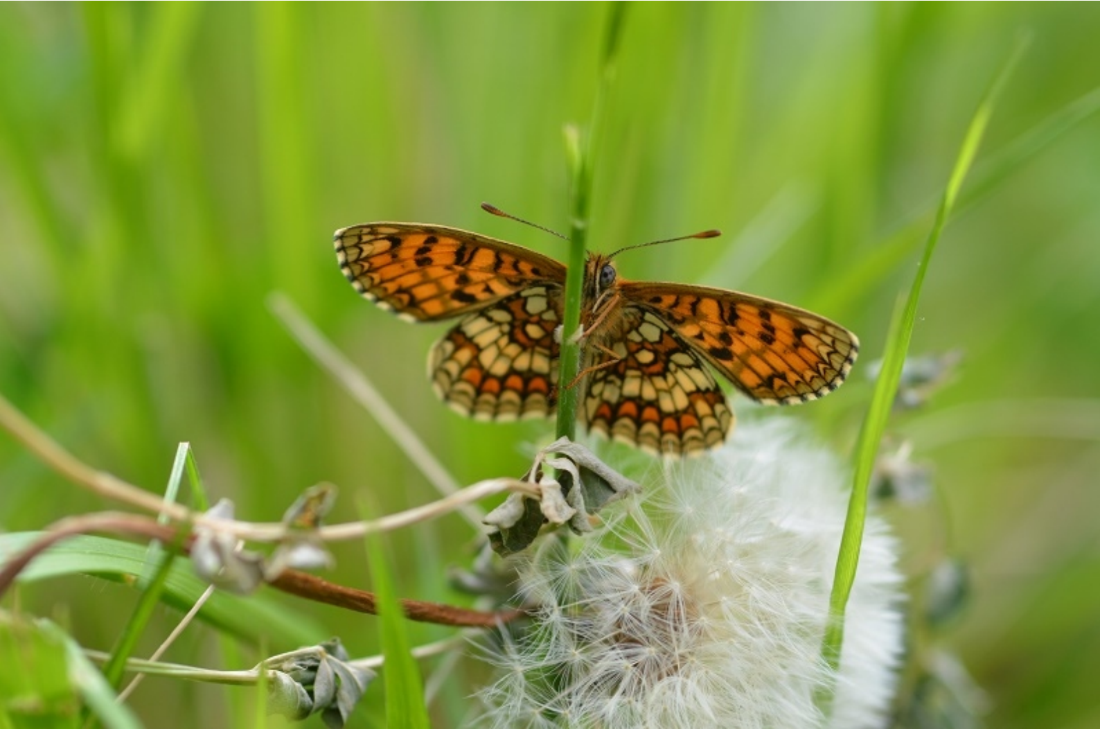
navadni pisanček ( Melitaea athalia )