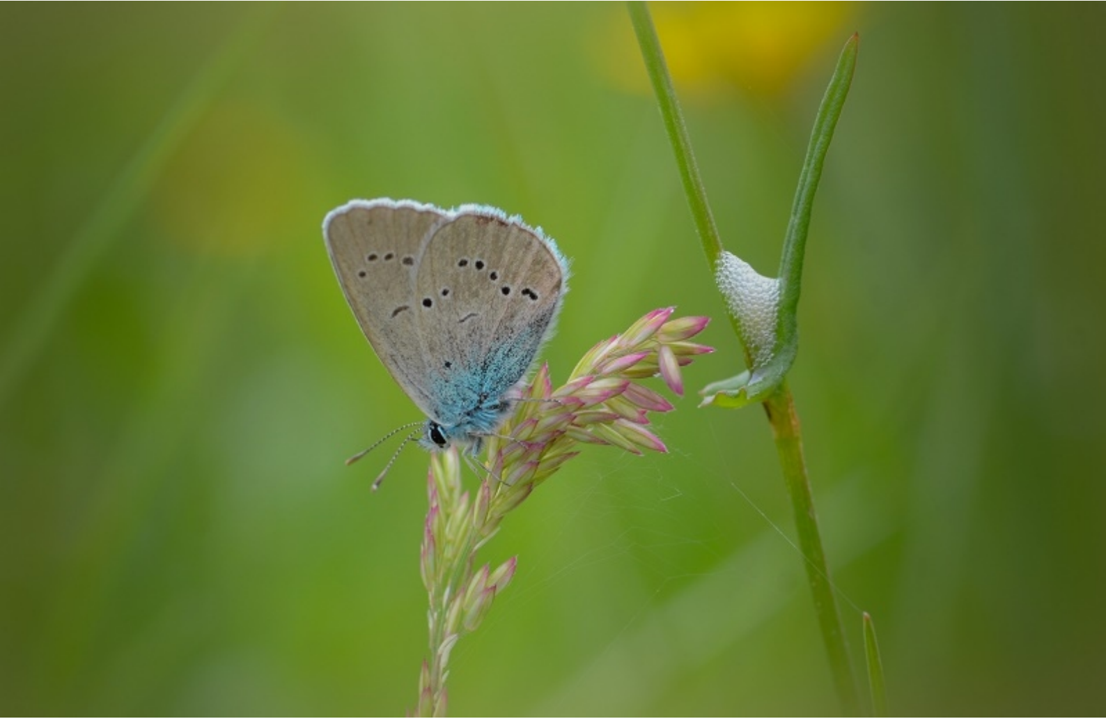
modri grašičar ( Cyaniris semiargus )