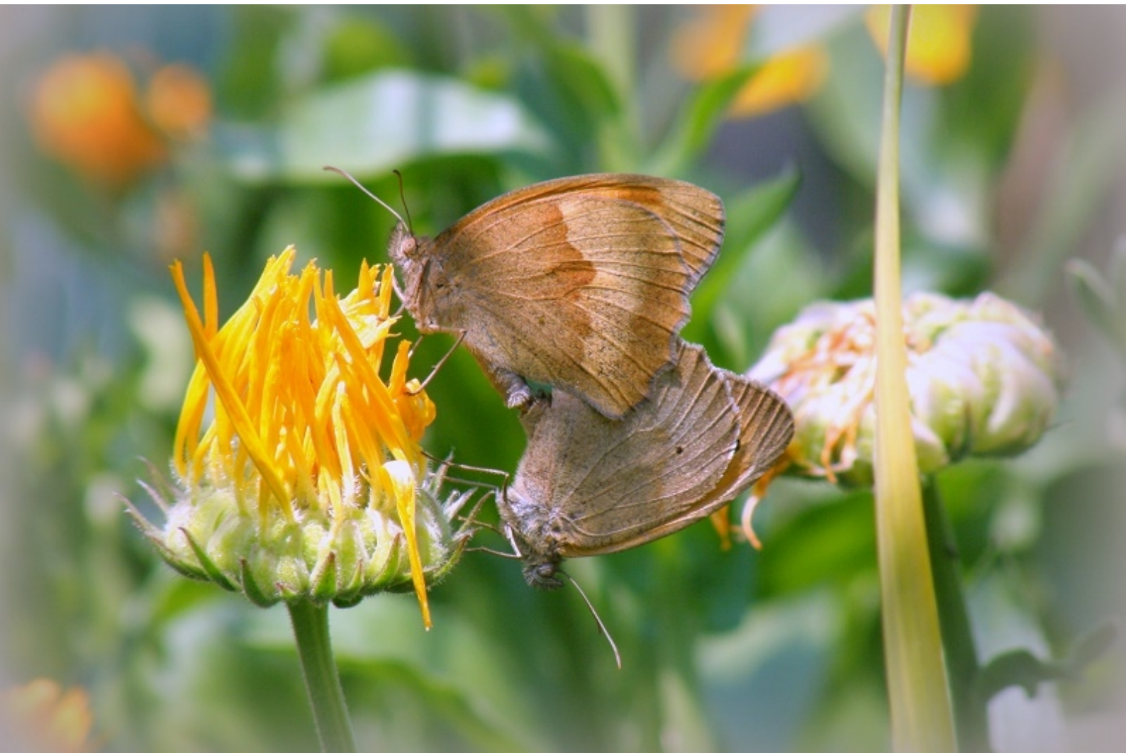
navadni lešnikar ( Maniola jurtina )