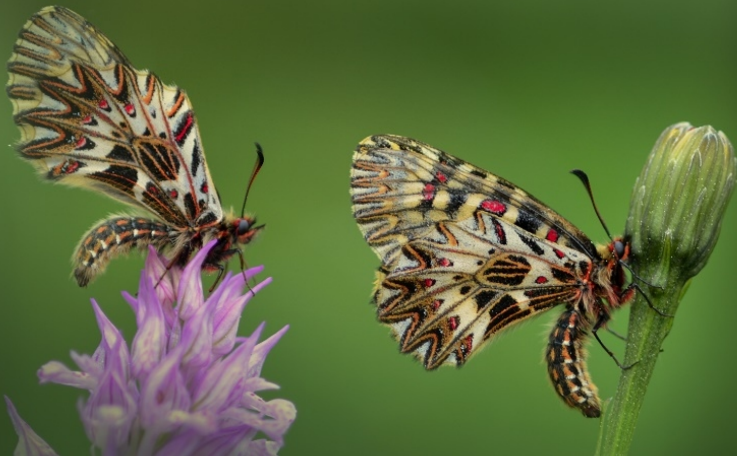
petelinček ( Zerynthia polyxena )