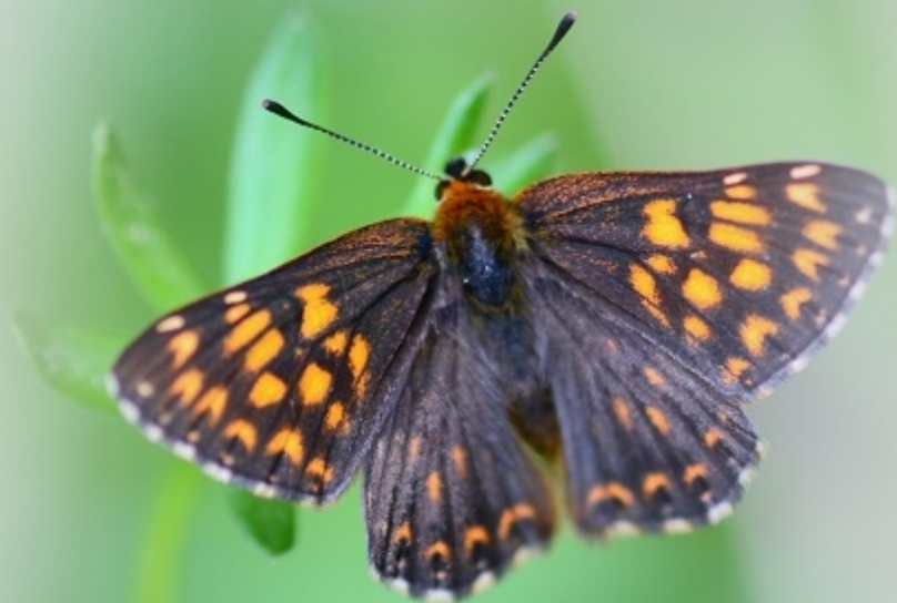
rjavi šekavček ( Hamearis lucina )