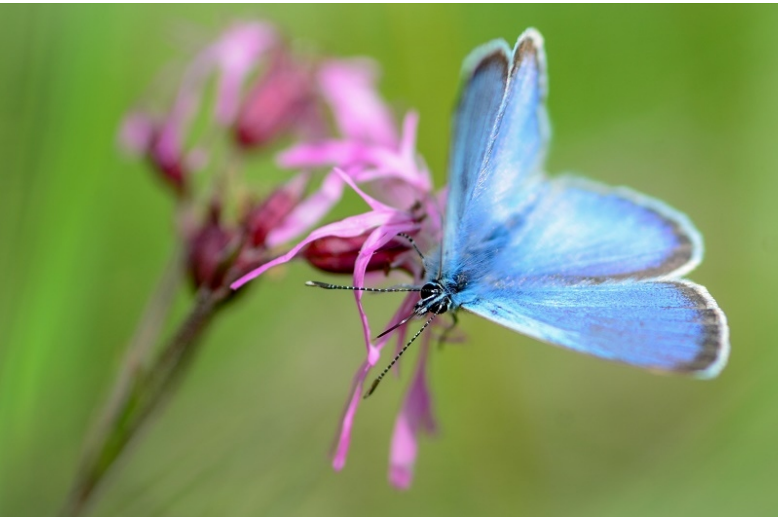
grabovčev iskrivček ( Glaucopsyche alexis )