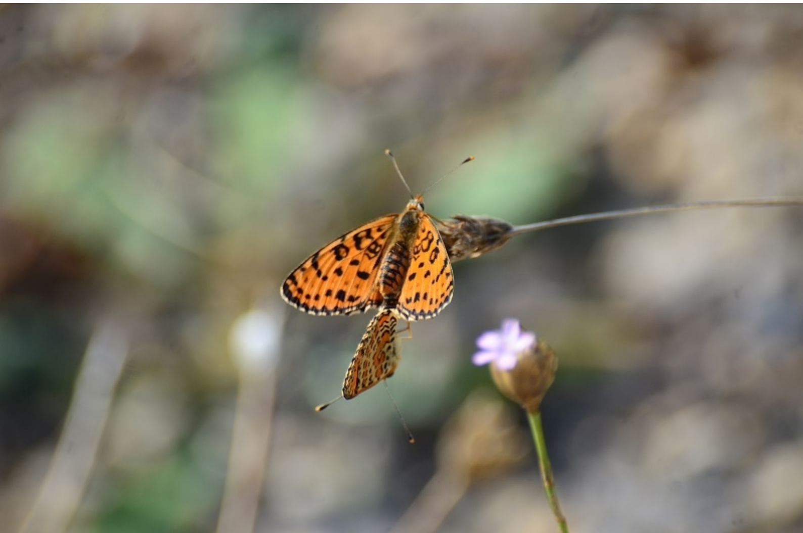
rdeči písanček ( Melitaea didyma )