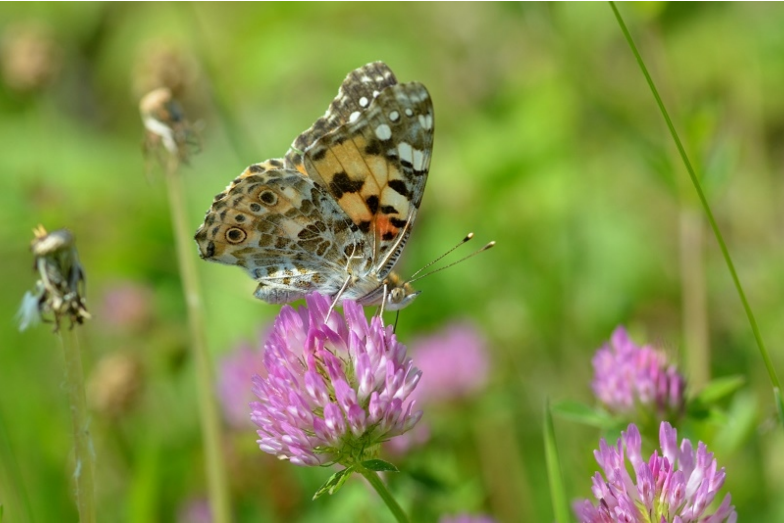
osatnik ( Vanessa cardui )