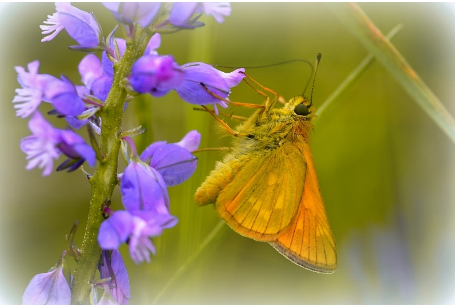
rjasti vibravček ( Ochlodes sylvanus )