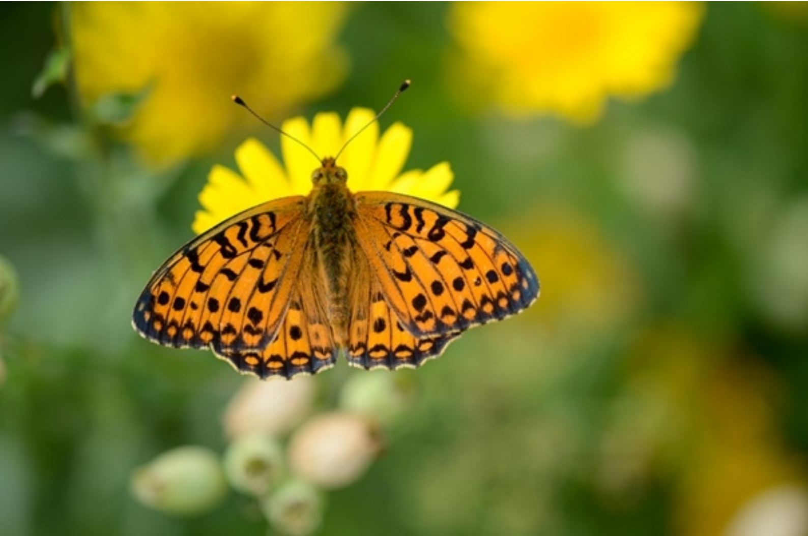
bleščeči bisernik ( Argynnis aglaja )