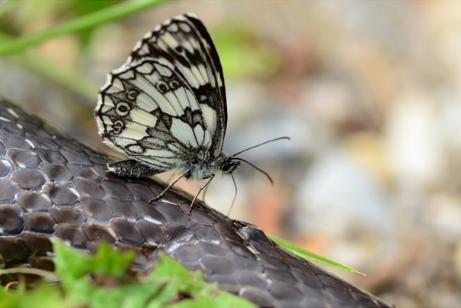
navadni lisar ( Melanargia galathea )