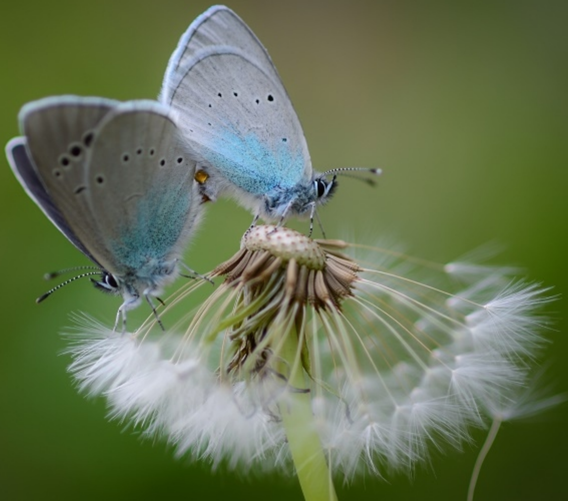
grabovčev iskrivček ( Glaucopsyche alexis )