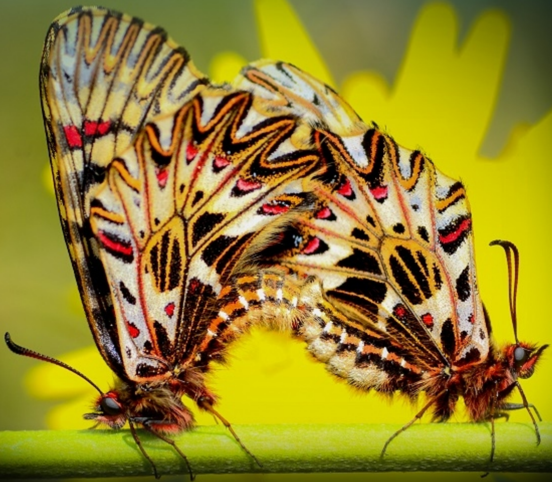
petelinček ( Zerynthia polyxena )