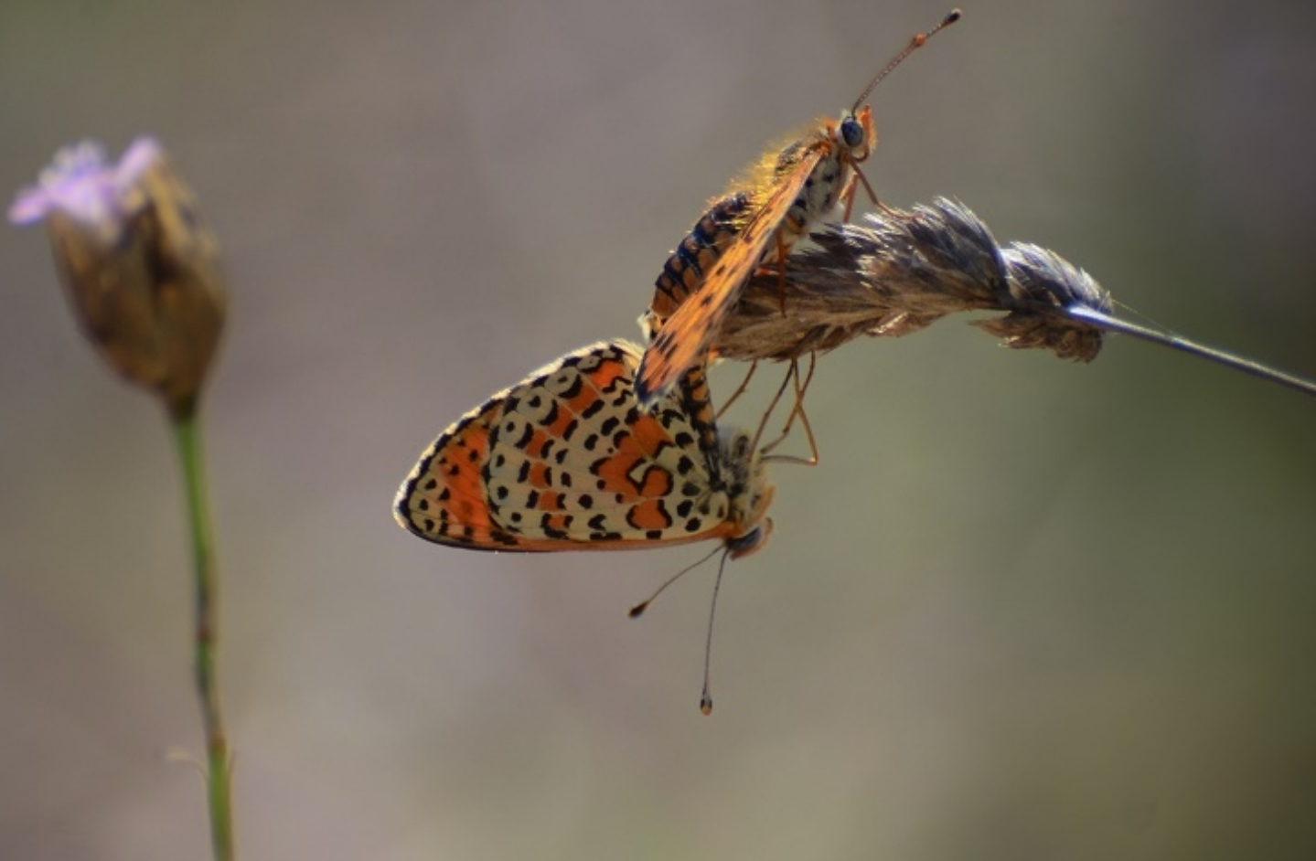
rdeči písanček ( Melitaea didyma )