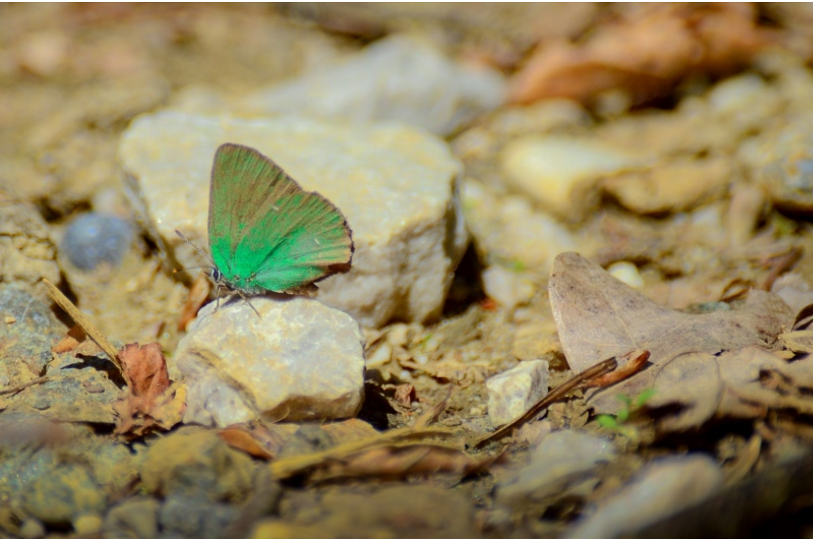
zeleni robidar ( Callophrys rubi )