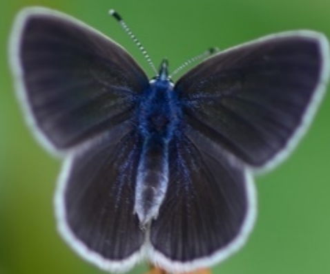
modri grašičar ( Cyaniris semiargus )