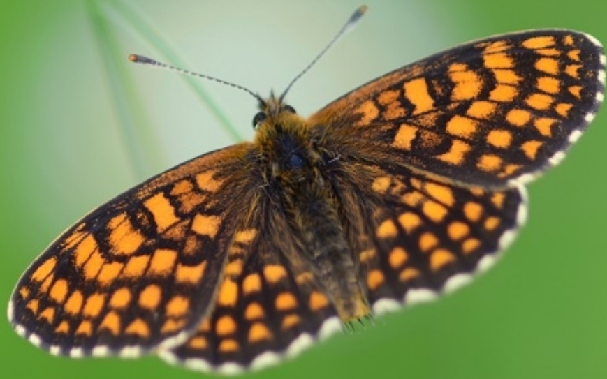
navadni pisanček ( Melitaea athalia )