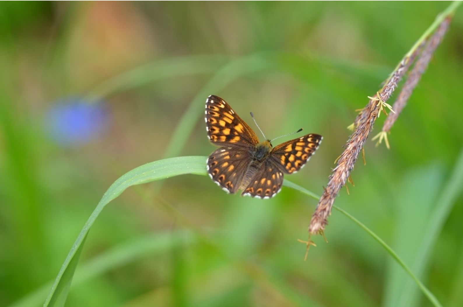
rjavi šekavček ( Hamearis lucina )