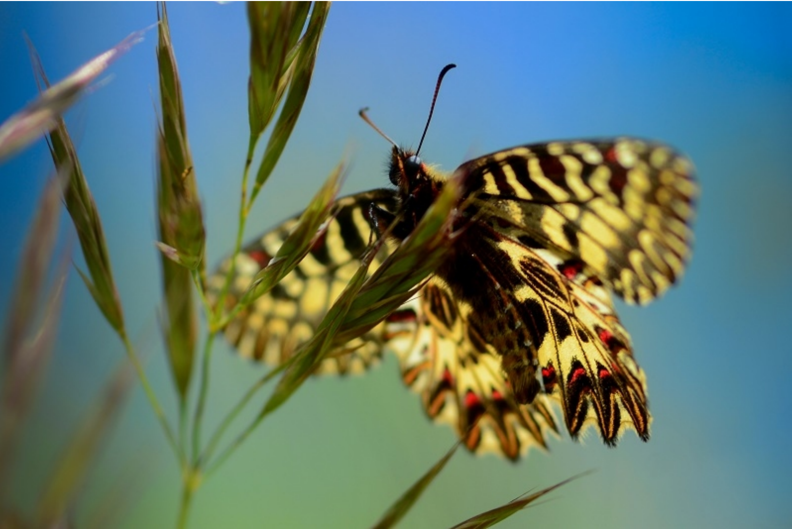
petelinček ( Zerynthia polyxena )