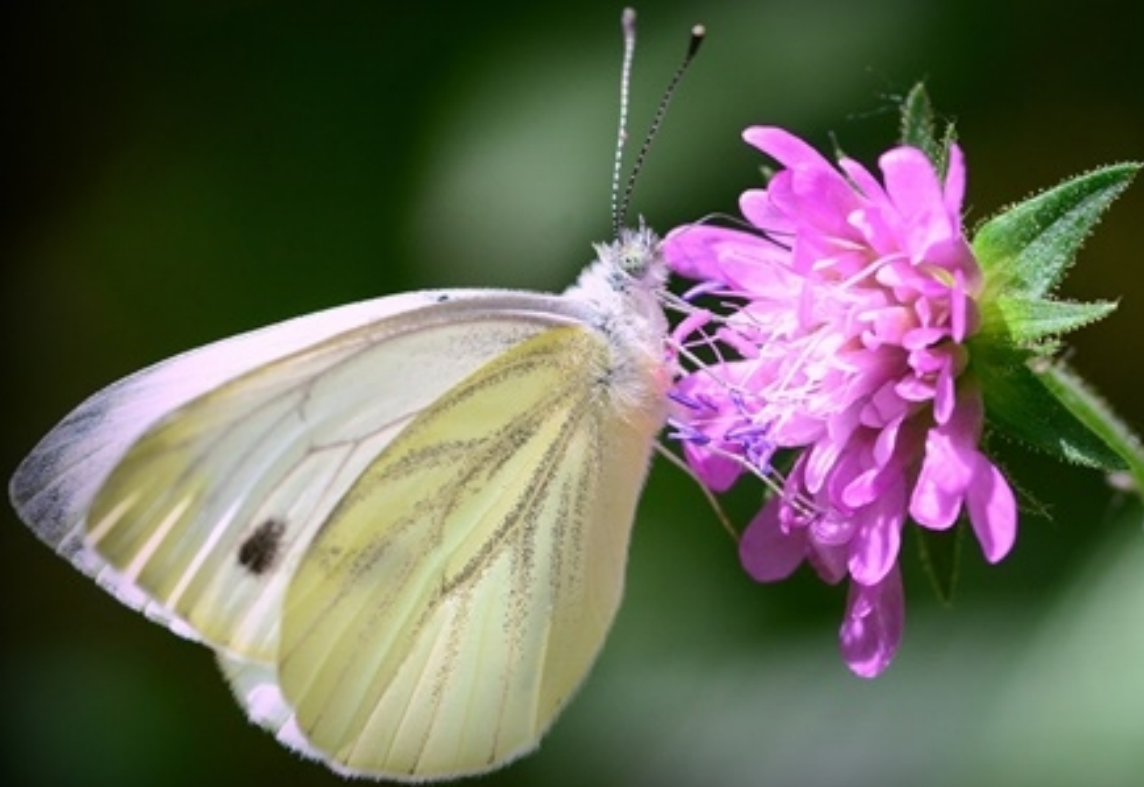
repičin belin ( Pieris napi )