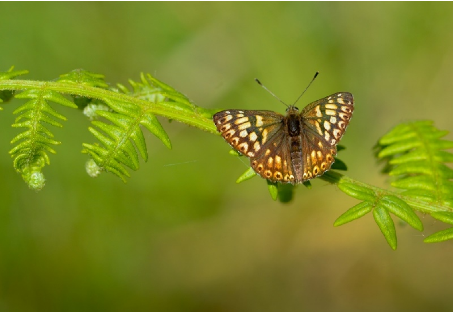
rjavi šekavček ( Hamearis lucina )