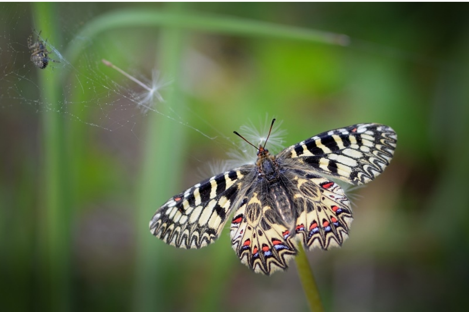
petelinček ( Zerynthia polyxena )