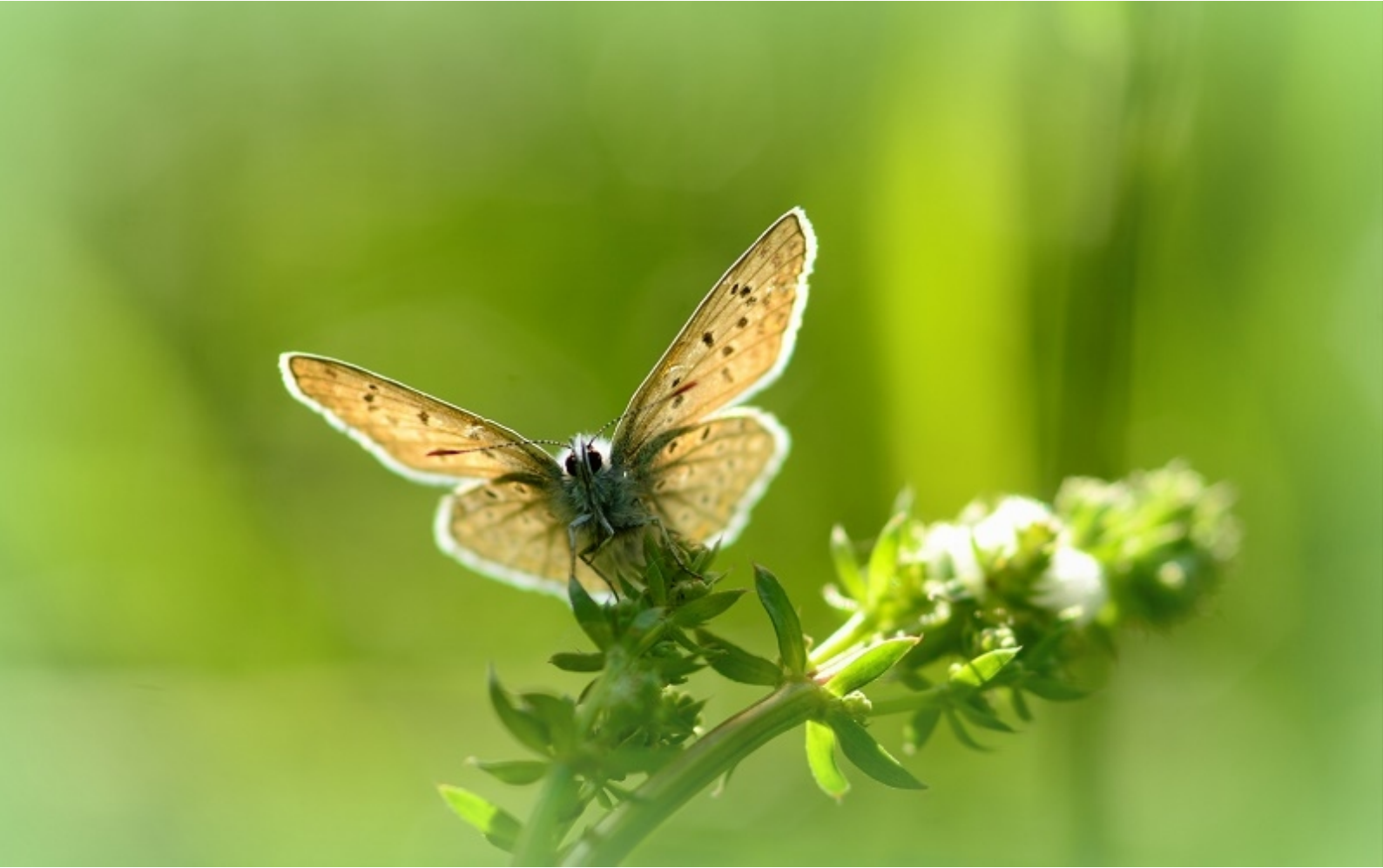
navadni modrin ( Polyommatus icarus )