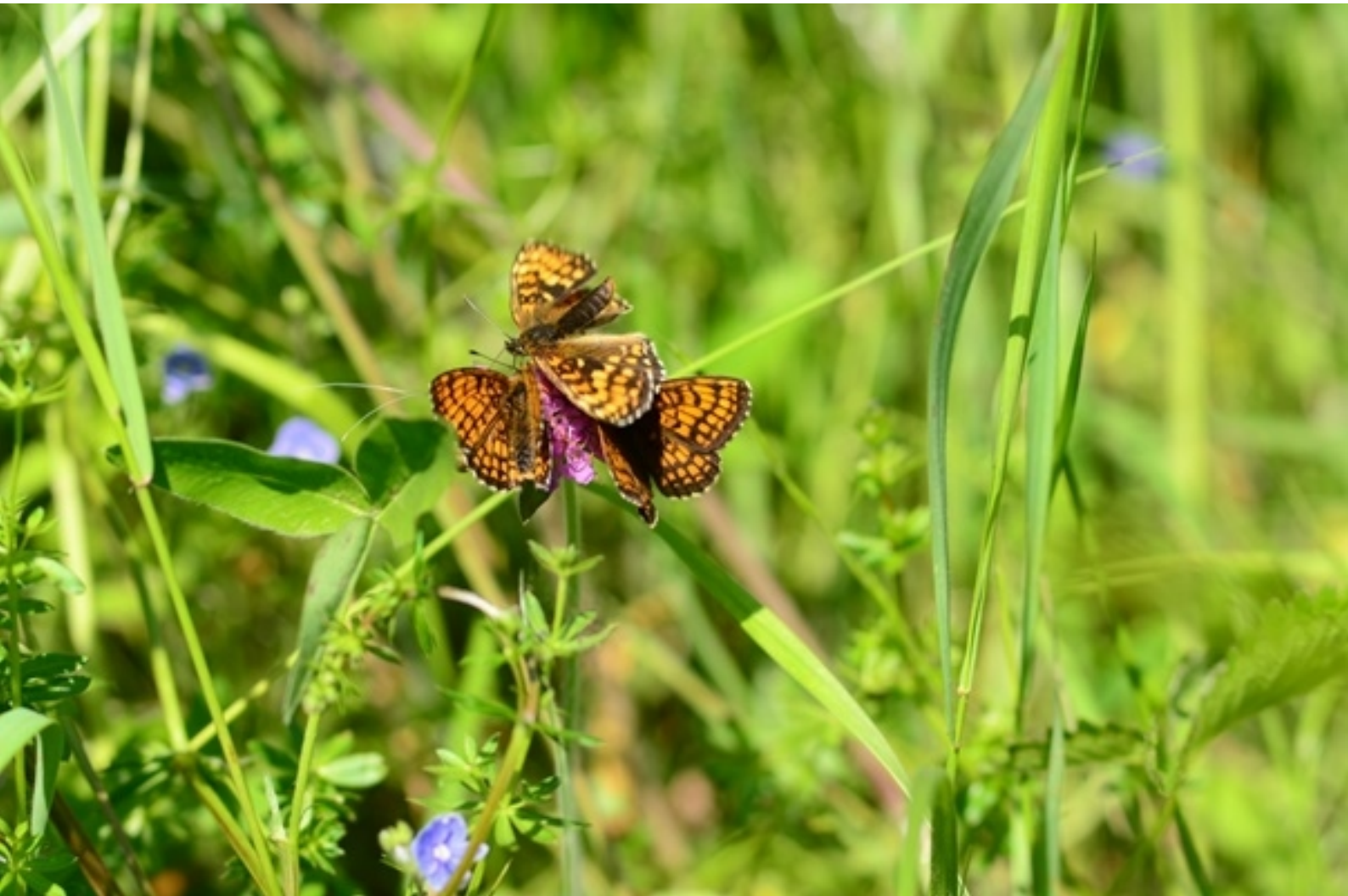
navadni pisanček ( Melitaea athalia )