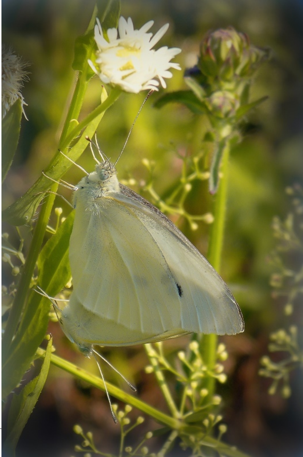
repin belin ( Pieris rapae )