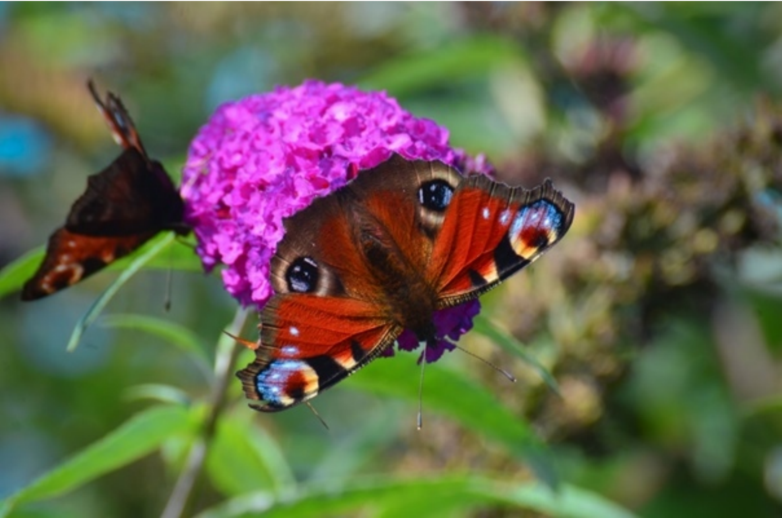
dnevni pavlinček ( Aglais io )