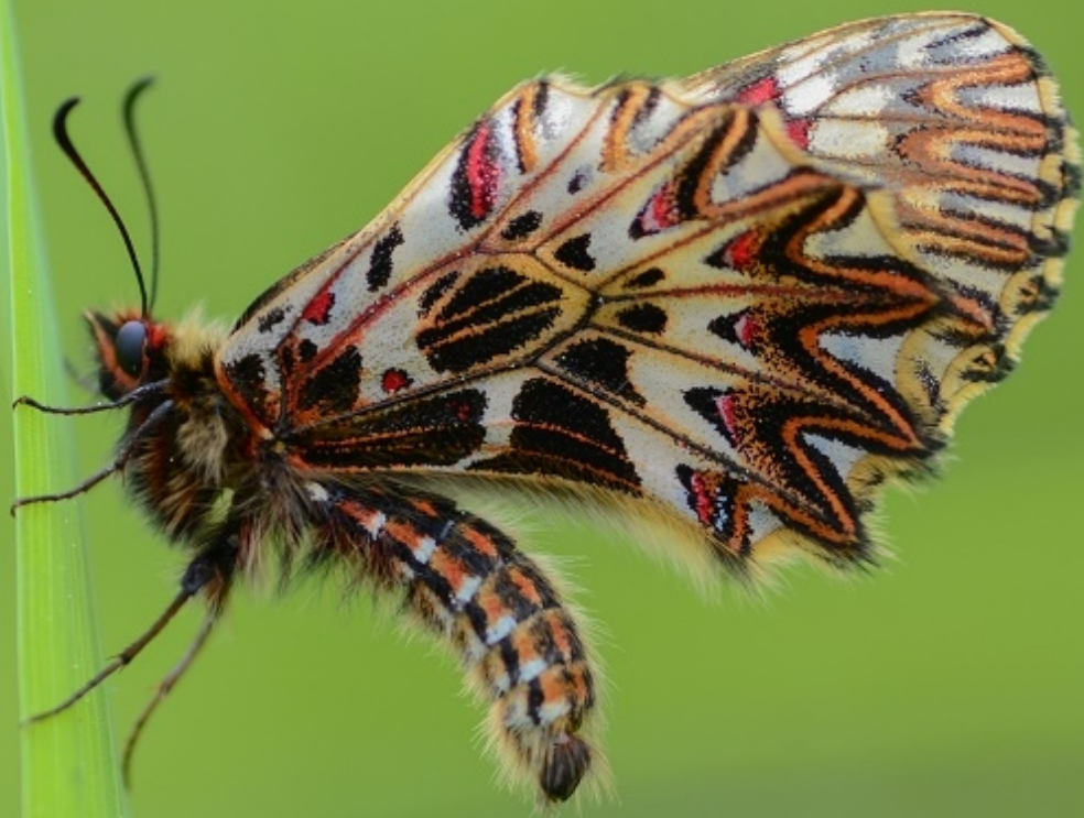
petelinček ( Zerynthia polyxena )