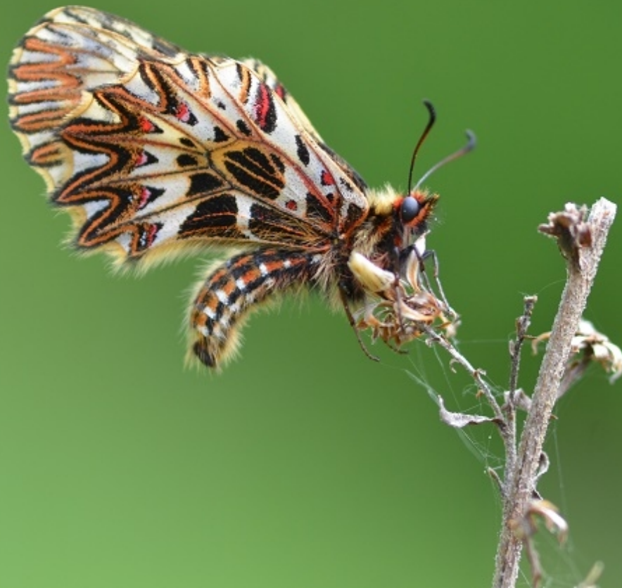
petelinček ( Zerynthia polyxena )