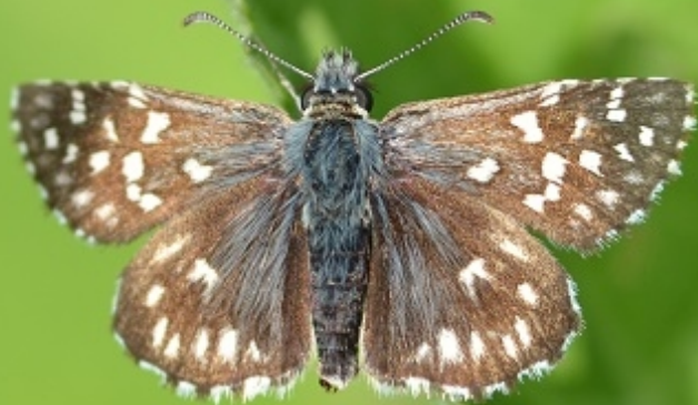
navadni slezovček ( Pyrgus malvae )