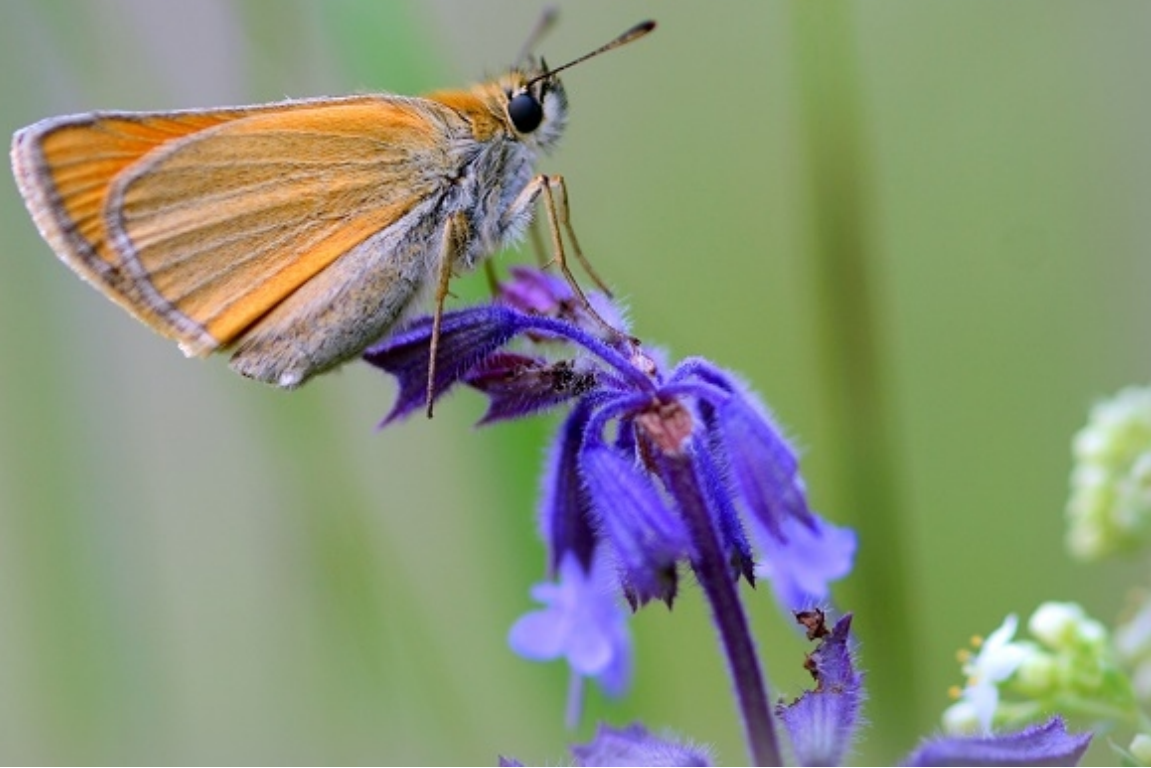
kratkočrti debeloglavec ( Thymelicus lineola )