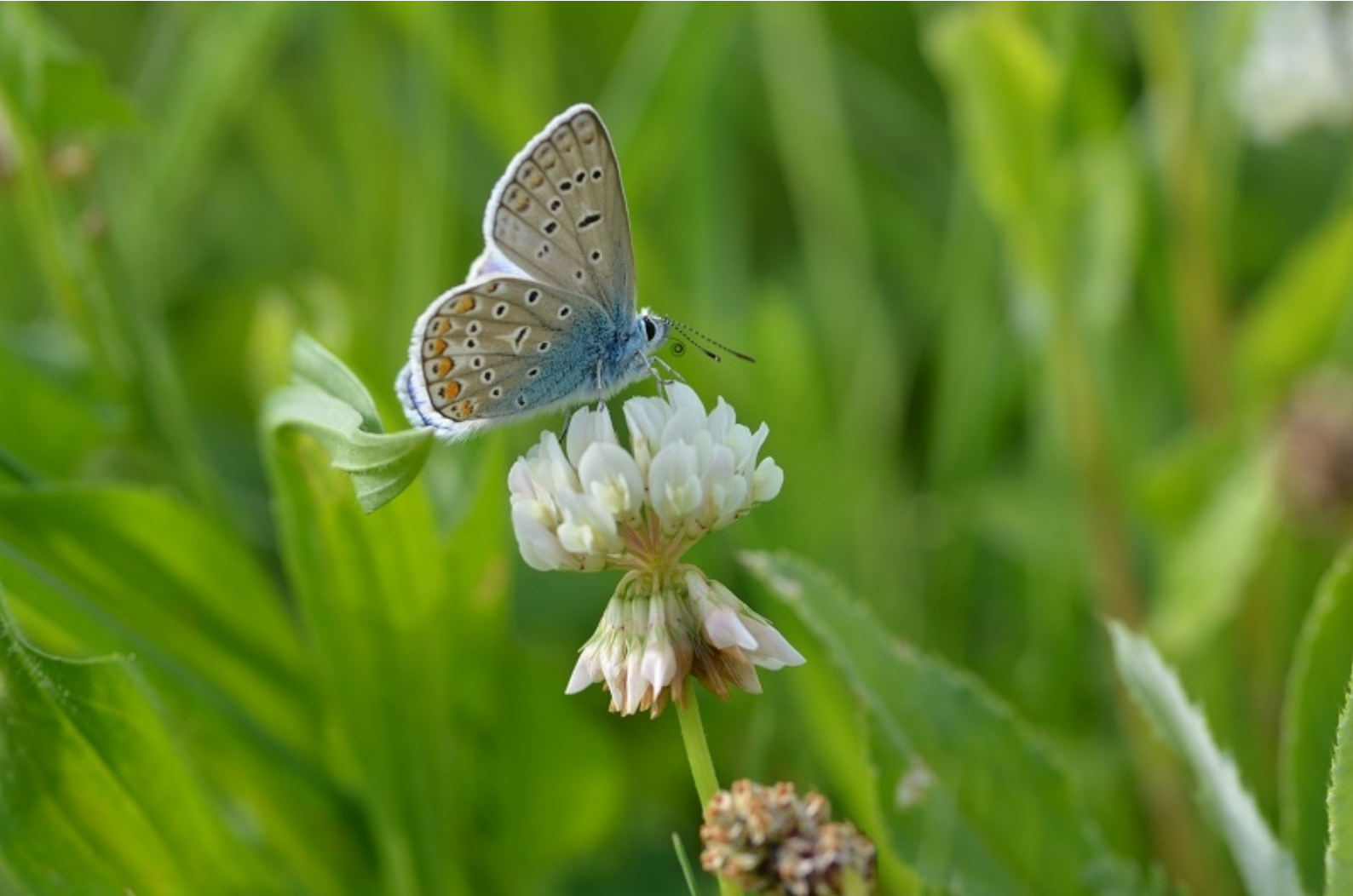
navadni modrin ( Polyommatus icarus )