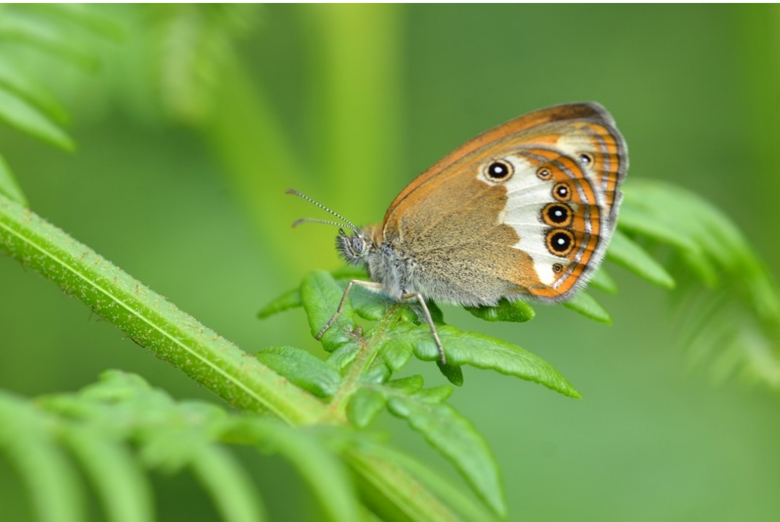
grmišni okarček ( Coenonympha arcania )