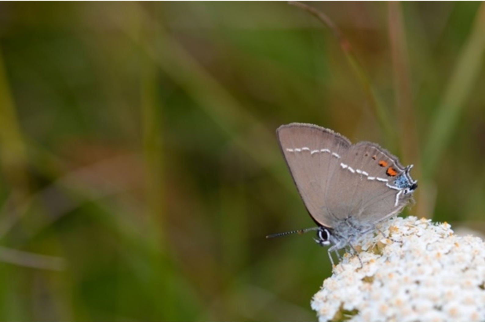
trnov repkar ( Satyrium spini )