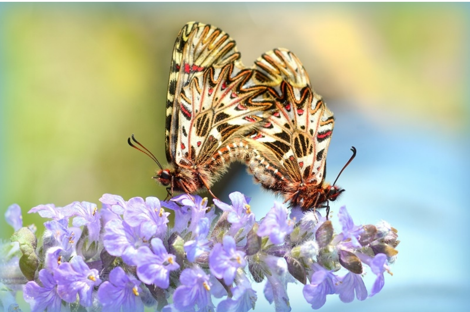
petelinček ( Zerynthia polyxena )