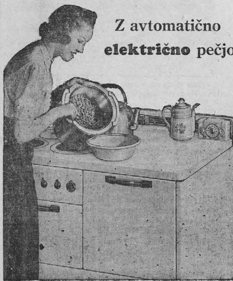
Z avtomatično električno pečjo

✱ Kuhajte na moderni način — z elektriko. Videli boste, kakor je na stotine drugih gospodinj širom Chicage, da je električno kuhanje lahko ... je hitro ... in je v resnici poceni.