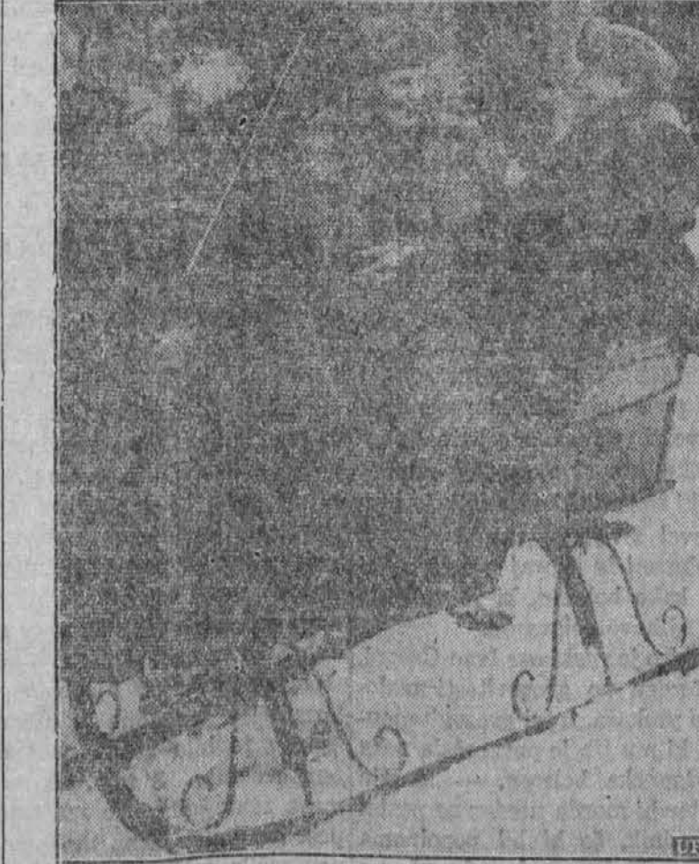
V ozadju na levi se vidi nemški minister Goering, ko se vozi na sanah s poljskim državnim predsednikom Mościckim ob svojem nedavnem obisku na Poljskem.