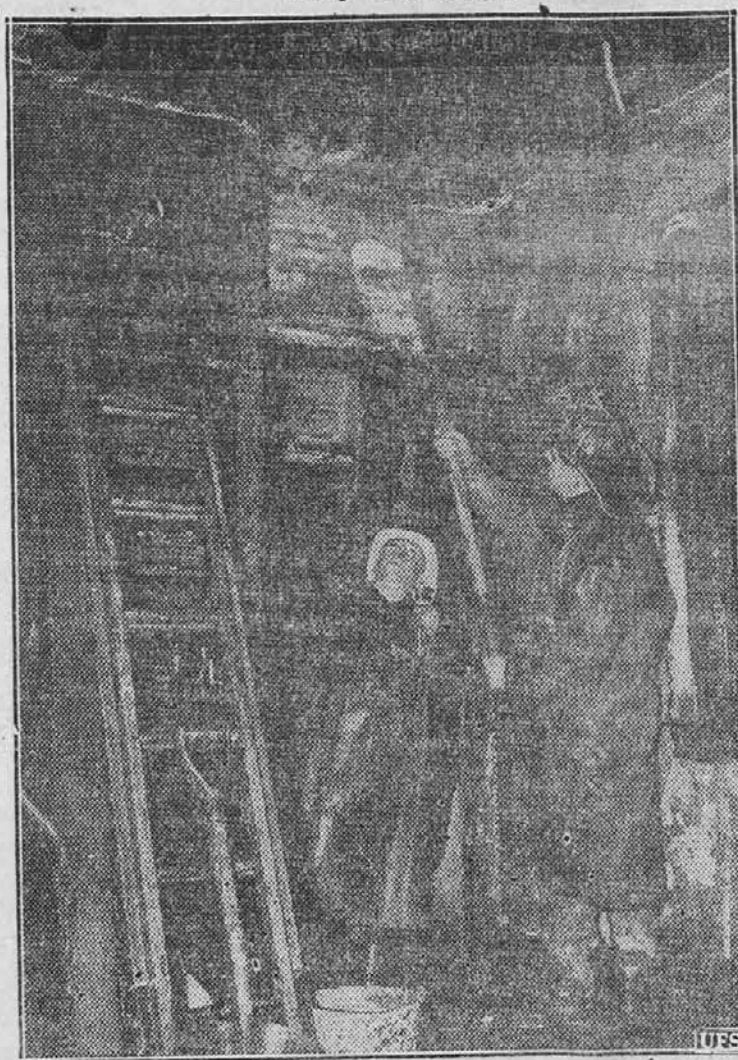
Slika kaže neko stanovanje v Detroitu, ki ga je nedavno razdejal ogenj, pri čemer ste našli smrt dve deklici, 12 letna Geraldine Kraft in njena 5 letna sestra Lillian.

žalosti nad strašnim početjem svojega izuma umrl. Ime "žilotina" pa je ostalo.