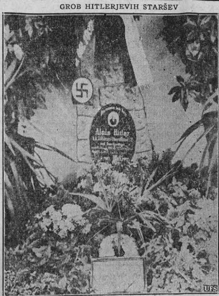
Med prvimi kraji, ki jih je obiskal Hitler, ko je prišel v Avstrijo, je bilo pokopališče v mestu Leonding, 10 milj daleč od Linza, kjer sta pokopana njegov oče in mati. Oče, Alois Hitler, je bil avstrijski carinski uradnik. Grob, ki ga kaže slika, je postal za nazije nekaj romarski kraj.

Združenje urarjev, zlatarjev, optikov, graverjev in pararjev v Ljubljani slavi letos 50 letnico obstoja njihovega Združenja.