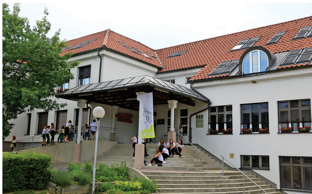
Tiste občine, kjer je malo otrok, imajo dodatne stroške s financiranjem ločenega poučevanja v šolah.

V naslednjem šolskem letu bodo v Leskovcu kombinirani oddelki 2.