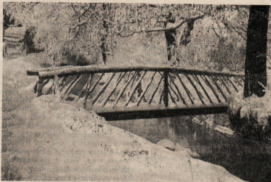
Vesele praznike želita vredništvo in uprava „Slovenskega vestnika“

Kdor je prespal dejstvo, da smo Slovenci na Koroškem težkih tisoč in več let ali pa še še ni prebudil iz „tisočletnega sna“ naj govori o „infiltratih“, pa naj se odeva v katerikoli plašč, spoznamo ga po poreklu ali po nagetju do nenasitnega zatiranja. Smatramo pa za nasilno potujčevanje naše zemlje odpiranje nemških zadrug v naših slovenskih vaseh, gledamo rop prav tako koroške zemlje v nasilni odtujitvi našega zadrušnega premoženja prav po istih ljudeh, ki še danes sedijo na zelo merodajnih mestih v raznih koroških kmečkih zbornicah in ustanovah ter zadrugah in nas