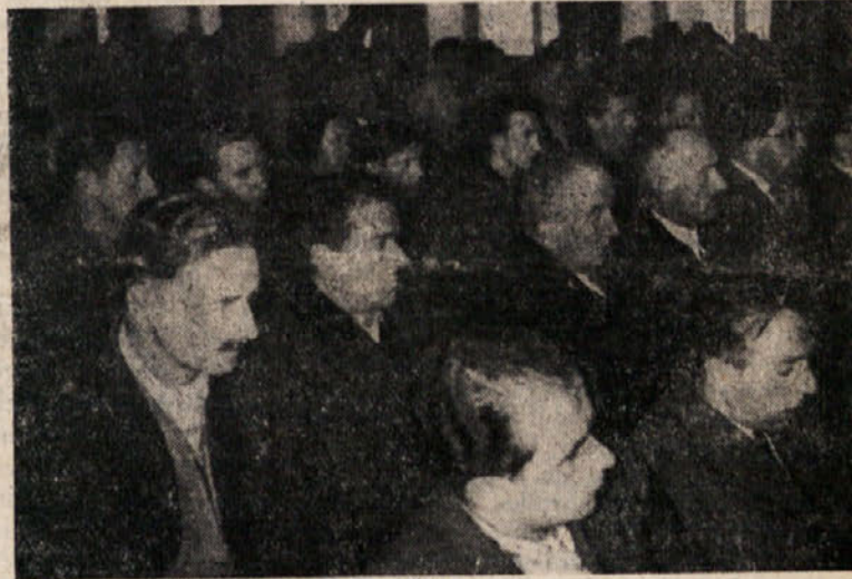
Z občnega zbora Zveze slovenskih zadrug

Ali pa naj bi nam Koroškimi Slovincem bilo mar zabranjeno to, kar kot obliko sodob-