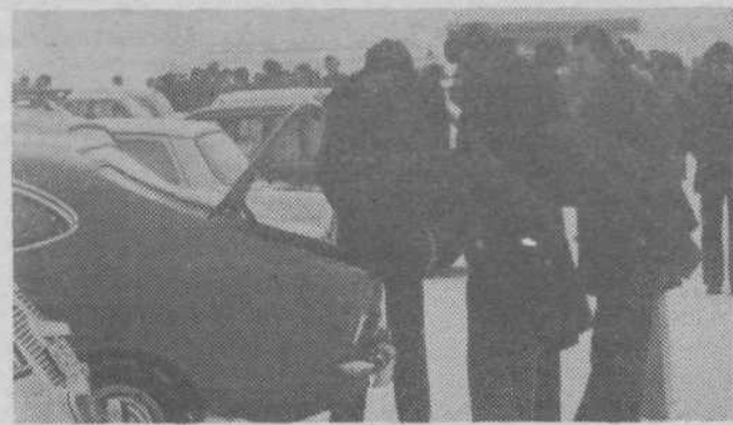
Avtomobilski sejem tudi v jutranjem mrazu: Foto: DUŠAN JEŽ

Vse družbenopolitične organizacije v Polju se redno sestajajo in rešujejo probleme s svojega področja. Aktivno se vključujejo v akcijo za obnovo doma Partizan. Zbiralna akcija še vedno teče. Odziv krajanov in delovnih organizacij je bil izreden. Vsak prispeva, kolikor pač zmore, obenem pa s tem pokaže pripravljenost in zanimanje za mnoge dejavnosti, ki bodo lahko potekale v obnovljenem domu. V januarju sta se sestala koordinacijski in gradbeni odbor, da bi naredila načrt notranje obnove. Potrebno bo prostovoljno delo. Prepričani smo, da se bodo krajanji, mladina, športniki, taborniki in kulturniki z vsemi močmi lotili dela. Celoten dom ima 466 kv.m površine, dvorana pa je velika 188 kv.m. Za vzdrževanje in varovanje stavbe bo potrebno pravočasno poiskati primernega hišnika.