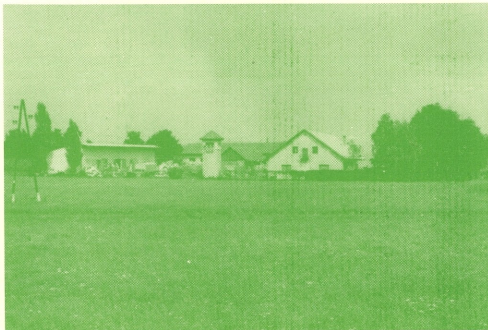
TO DINOS TOZD RET BOHOVA

10 %, druge jugoslovanske OZD za pripravo sekundarnih tekstilnih surovin,