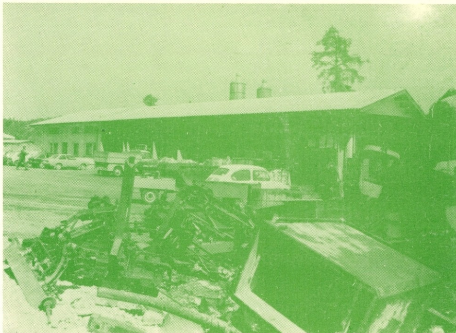
PE DINOS KRANJ

Zavedati se je potrebno, da nobena oblika socialnih korektivov ne more, pa tudi