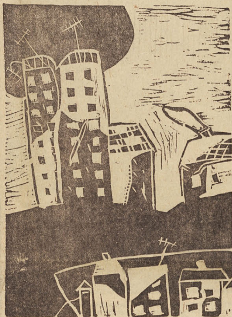
Lesorez Šebenika Mića na temo »Porušeno Skopje« — z razstave likovnega oddelka Pionirskega doma v Ljubljani. (Več o razstavi poročamo na 10. strani)

Ob delavskem prazniku 1. maju čestitamo k delovnim uspehom