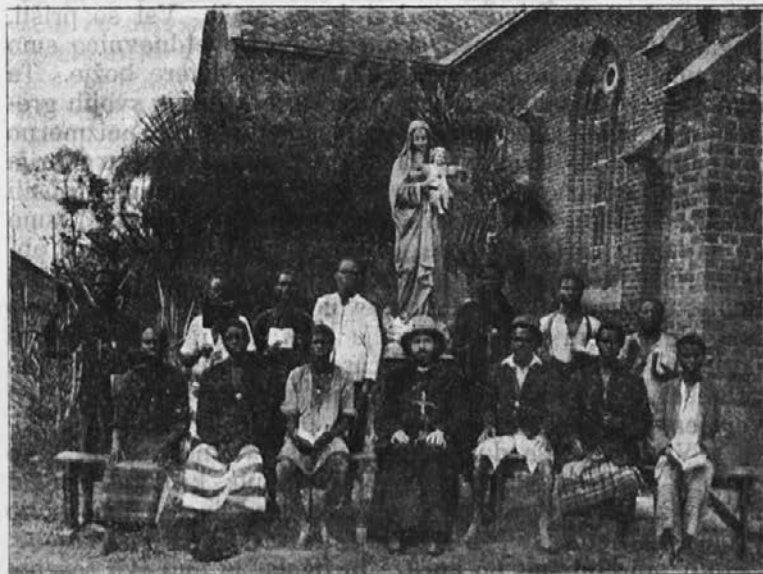
Naši katehisti po končanih letnih duh. vajah.