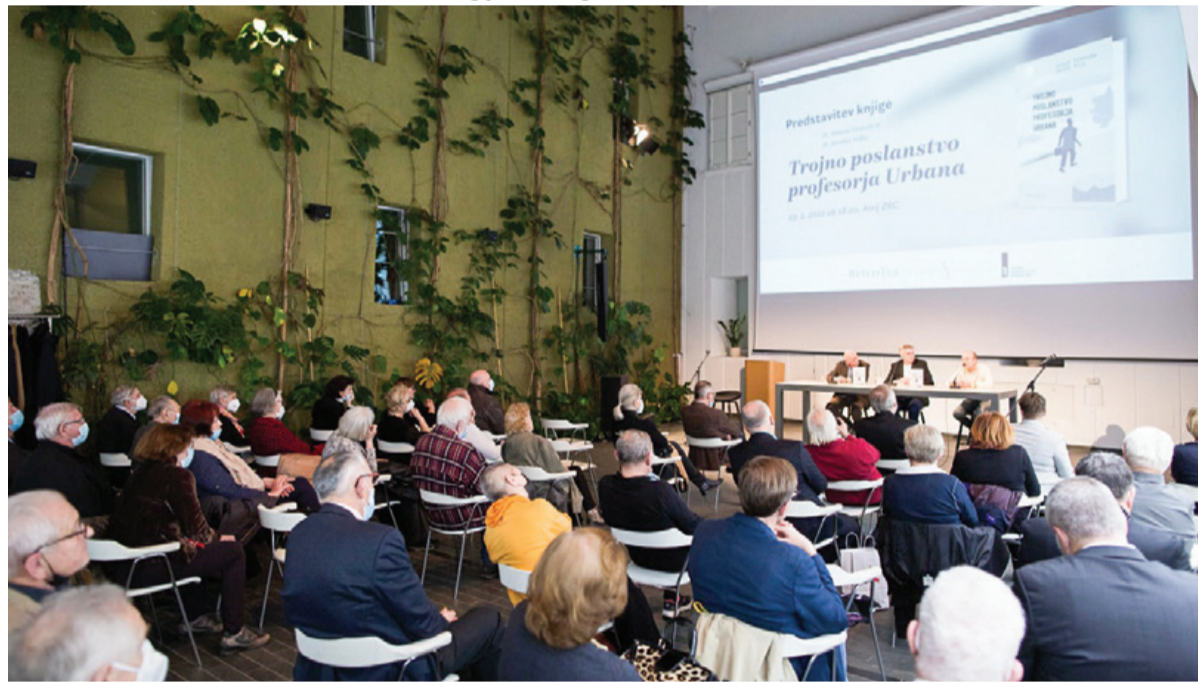
Ljubljanska predstavitev knjige je bila v Atriju ZRC SAZU.