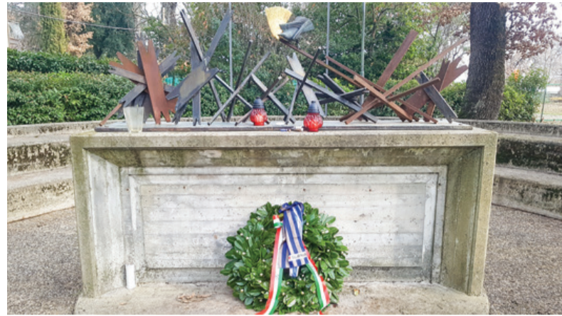
Spomenik taboriščnikom v nekdanjem taborišču, kjer je venec položila občina Anghiari. Na vencu je tudi šal ZZZB NOB Slovenije, ki spominja na slovenske taboriščnike.