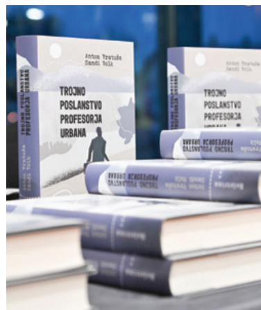
Knjiga Trojno poslanstvo