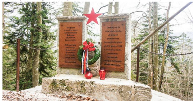
Spomenik v Jelenuvem žlebu, večkrat tudi tarča vandalskih uničevanj

26. marca 1943 je v Jelenuvem žlebu partizanska vojska italijanski vojski zadala enega najhujših udarcev. Cankarjeva in Šerčerjeva brigada sta porazili