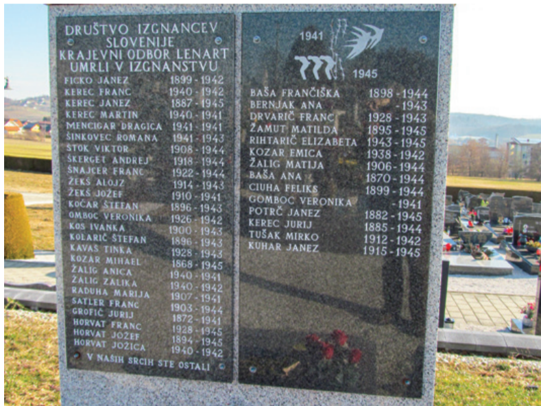
Spomenik izgnancev na lenarškem pokopališču

Takoj po okupaciji aprila 1941 so začeli Nemci v okupirani Štajerski izvajati najtršo raznarodovalno po-