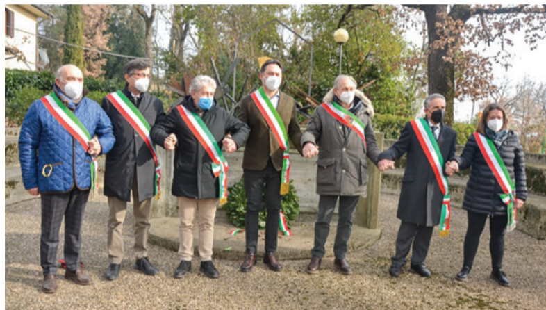
Na letošnji dan spomina na holokavst so si predstavniki vseh sedmih občin Valtiberine (Anghiari, Caprese, Monterchi, Sansepolcro, Sestino, Badia Tedalda, Pieve Santo Stefano) na komemoraciji v Renicciju podali roke pred spomenikom taboriščnikom.