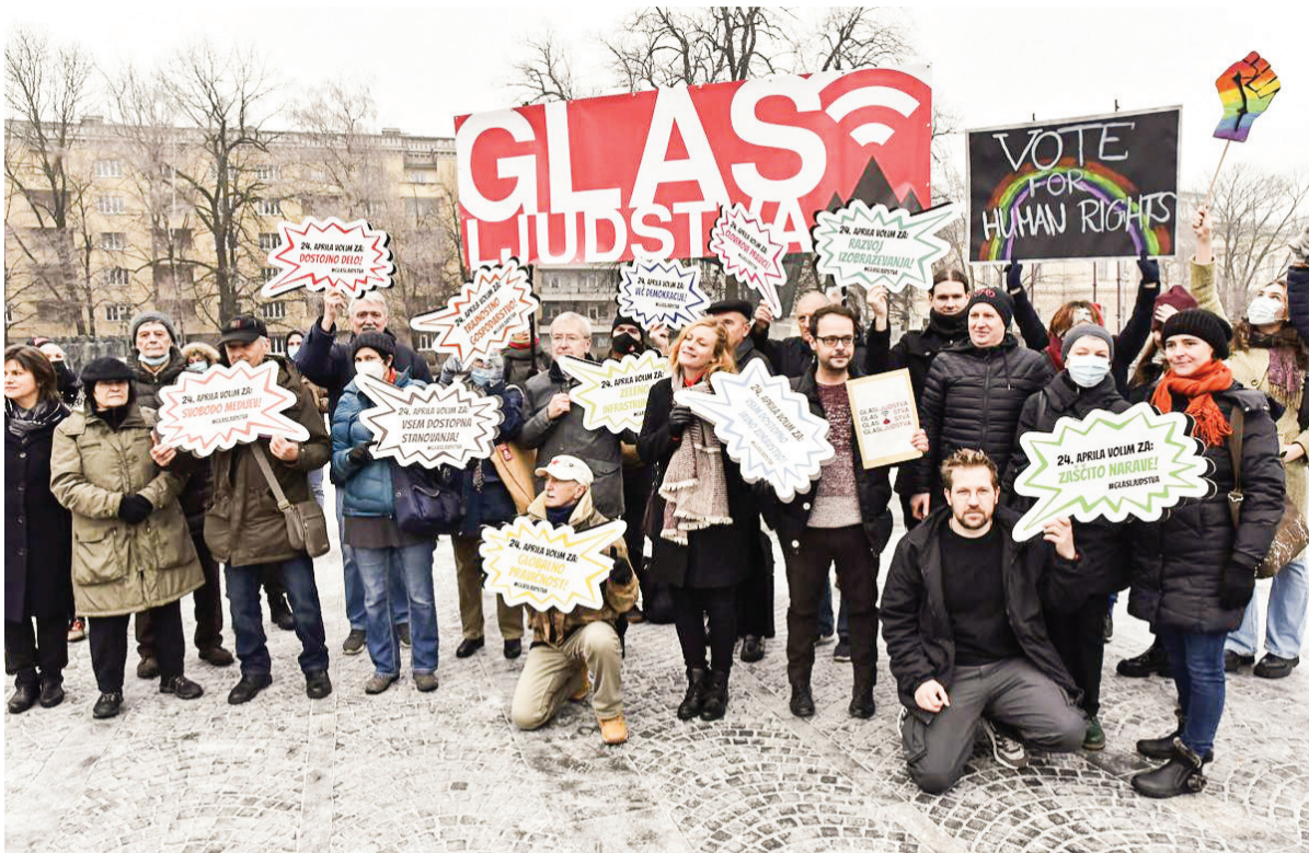
Inicijativa Glas ljudstva.

Inicijativa Glas ljudstva je svoje zahteve že pred časom predala političnim strankam, ki bodo kandidirale na prihajajočih državnozborskih volitvah. Odzivi strank so dostopni na spletni strani naše iniciative ( www.glas-ljudstva.si ). V prejšnji številki smo predstavili del naših področij, ki smo jih naslovili na politične stranke, tokrat pa predstavljamo še preostala področja.