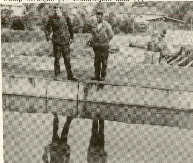
Protipožarni bazen v novi tovarni je očiščen (po zaslugi desnega na sliki) ...