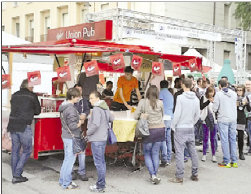
Štandreška stojnica s pivom pred šotorom ZSKP (levo); gneča v Raštelu (desno)