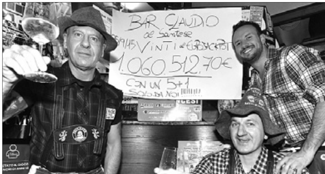
V baru Claudio pri Sv. Jakobu je neznanec zmagal milijon evrov

Z naložbo samih dveh evrov je v evropski igri na srečo Eurojackpot na petkovem žrebanju edini v Evropi zadel 6 števil na 7