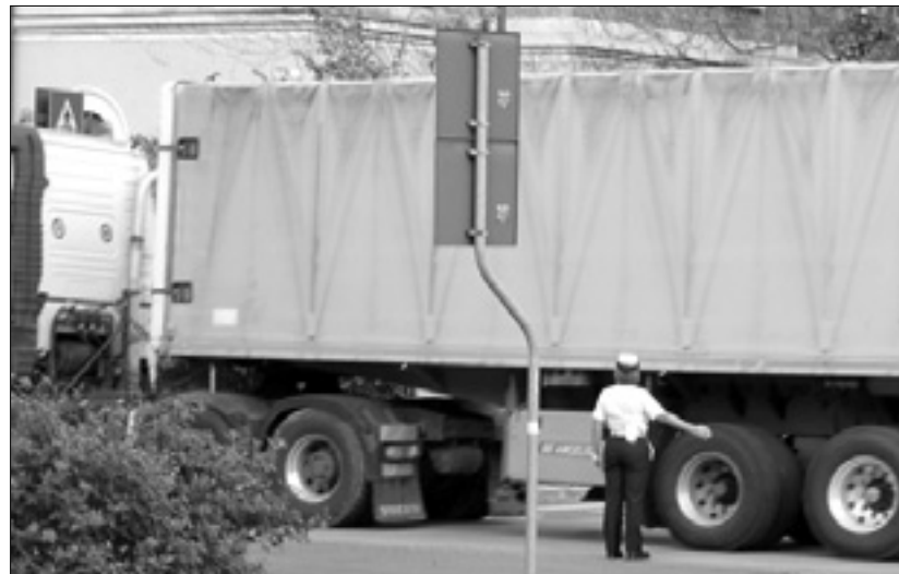
Tovornjak v Ulici Leoni

»Dovolj nam je praznih besed. Krajevni upravitelji naj preidejo k dejanjem. Potrkati bi morali na vrata dežele FJK in dati možnost goriškemu tovornemu postajališču, da izkoristi železniški tir, ki pelje do trenutno neizkoriščenega terminala; ta služi za natančnejše in raztovarjanje kamionov, ki prevažajo tovrstne tovore. To bi bilo pozitivno za tovorno postajališče, goriško mestno četrt pa bi rešilo izpušnih plinov in prometnih težav,« pravijo predstavniki odbora. Le-ti po ulicah severne mestne četrti zahtevajo tudi uvedbo hitrostnih omejitev in poostren nadzor prometa.