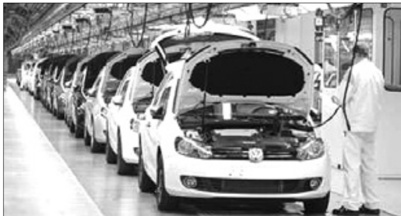
Tovarna avtomobilov Volkswagen