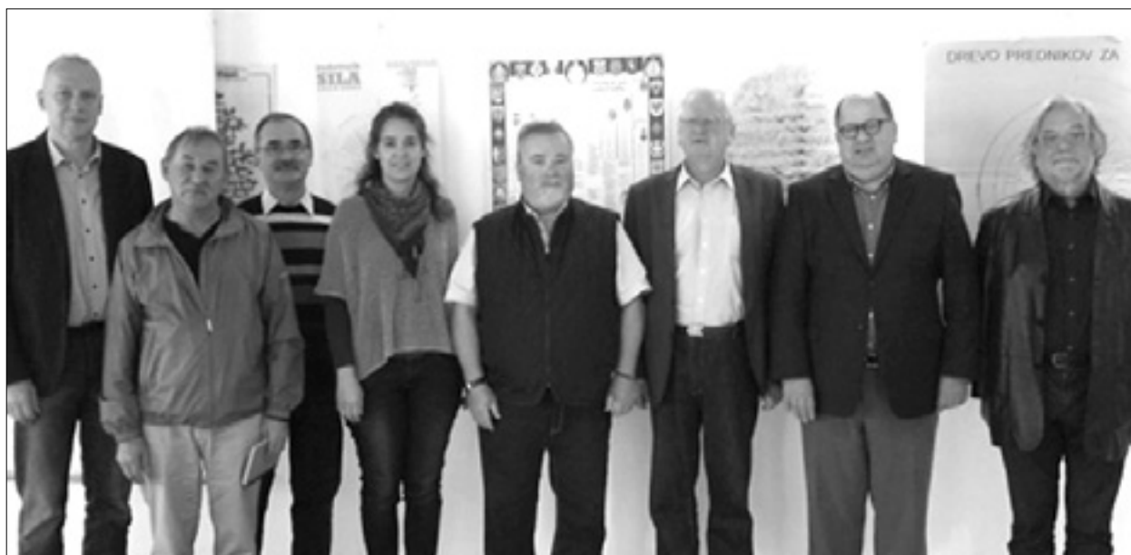
Zastopniki manjšinskih organizacij na zasedanju Slomaka v Ljubljani

V naslednjih mesecih, tako so se zmenili v Ljubljani, bodo dali pobudo za vrsto srečanj z vsemi institucionalnimi predstavniki v Sloveniji in s parlamentarnimi strankami ter bodo organizirali serijo javnih dogodkov, da bi javnost seznanili z nekaterimi tematikami, ki neposredno zanimajo manjšino in samo osrednjo Slovenijo. Tudi na evropski ravni načrtujejo določene aktivnosti, ki naj bi se sklenile z obiskom evropskih institucij v Bruslju in v Strasbourgu.