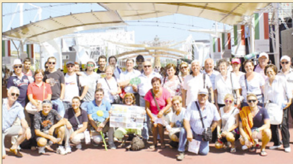
Izletniki na razstavi Expo v Milanu