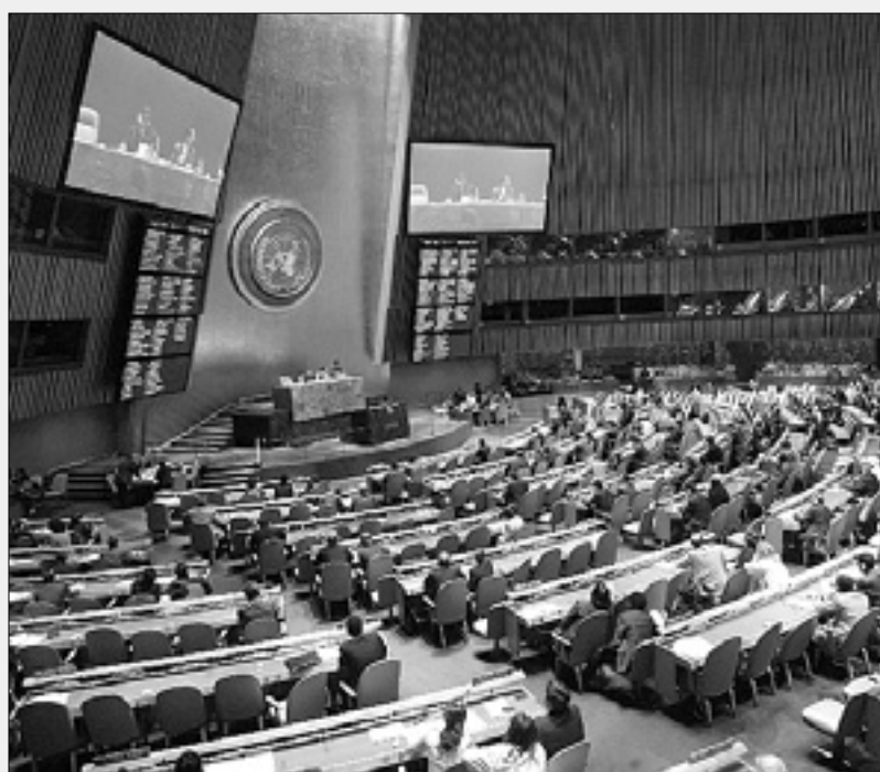
Generalna skupščina ZN med enim od zasedanj

Oči sveta bodo uprte v predsednika Obama in njegovega ruskega kolega Vladimirja Putina, saj sta državi zaradi ukrajinske krize in različnih pogledov na krizo v Siriji spet na robu hladne vojne. Voditelja se bosta sestala ob robu zasedanja v ponedeljek, v ospredju bo Sirija.