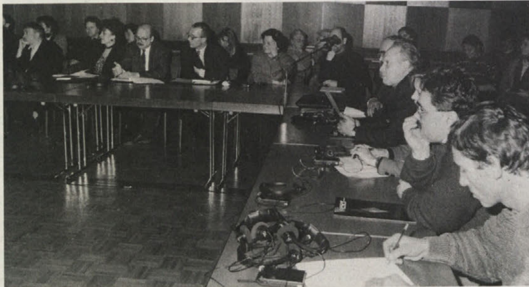
Udeleženci občnega zbora so prišli iz Slovenije, Furlanije-Juljske Krajine in Koroške.