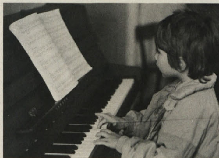
Prstki še ne ubogajo, a mali je trdno odločen, da jih bo ukrotil – eden od nekaj sto učencev Glasbene šole