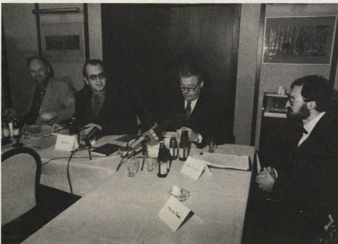
S tiskovne konference, kateri je prisostvoval tudi zvezni kancler Vranitzky

Kar se je pričelo lani poleti v kulturnem domu pri Cingelcu na Trati, kjer je na 1. mednarodnem srečanju založnikov in na pobudo založbe Wieser bila porojena zamisel o ustanovitvi „Bosanske knjižnice“ (Slovenski vestnik je o tem obširno poročal), se je medtem razvilo v vseevropsko iniciativo založb in založnikov, ki jo podpirajo tudi predsedniki in vidni politiki srednjeevropskih držav, med drugim predsednika Slovenije in Češke, Milan Kučan, Vaclav Havel in avstrijski zvezni kancler Franz Vranitzky.