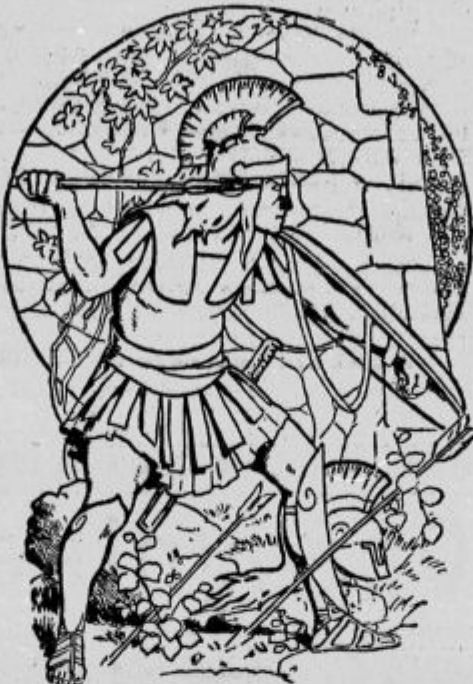
Kje je drugi vojščak?