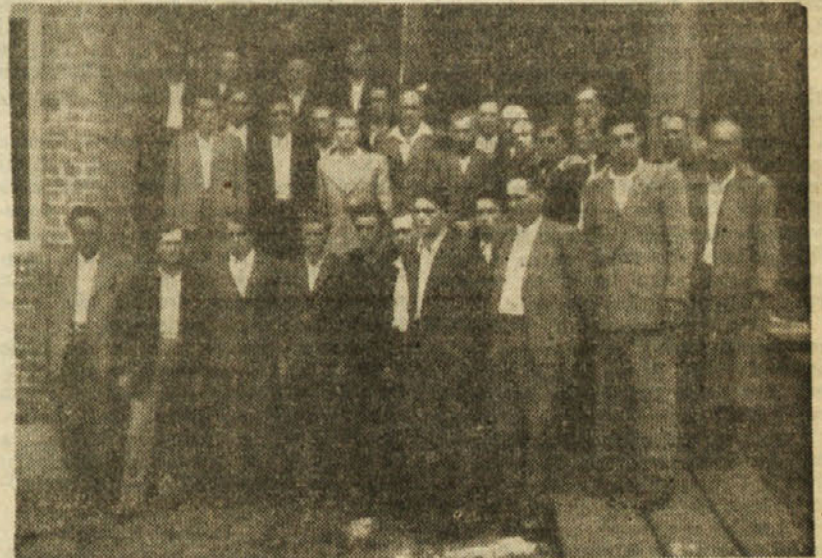
Novi udarniki gradbenega podjetja »Zidar«

Z velikim odobravanjem in vzkliki našemu vrhovnemu vodstvu in SZ se je zaključila svečanost proglasitve novih udarnikov.