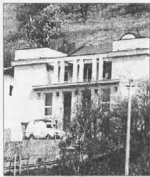
Il municipio di Drenchia