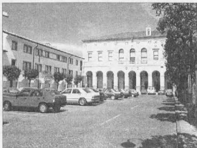
Piazza del Duomo con a sinistra la sede della banca