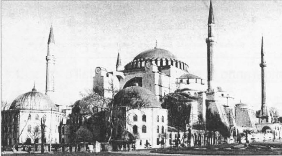
La chiesa di Santa Sofia a Costantinopoli, riedificata nelle forme attuali dall'imperatore Giustiniano nel VI secolo. Dal 1453, con la conquista ottomana, è trasformata in moschea mussulmana

Negli ultimi anni di vita Teodorico incappò nella rete delle diffidenze e dei contrasti con l'aristocrazia romana e con l'Impero. Particolarmente efferate apparvero le condanne a morte del filosofo Boezio e del senatore Simmaco, che erano suoi amici e collaboratori. In questa atmosfera di sospetti Teodorico giunse ad incarcerare lo stesso papa Giovanni I. Dopo la morte di Teodorico (526) l'imperatore d'Oriente, Giustiniano, predispose la riconquista del regno dei Vandali in Africa settentrionale da parte di Costantinopoli, affidando il comando militare a Belisario. La campagna militare ebbe successo mentre il regno ostrogoto in Italia passò sotto la reggenza di Amalasueta, che era propensa a relazioni amichevoli con l'Oriente, contrastate invece dai capi goti intransigenti nei confronti dell'Impero. L'imperatore Giustiniano d'Oriente vide la possibilità di riprendere anche l'Italia. L'assassinio di Amalasueta da parte del marito fu considerato da Giustiniano motivo sufficiente