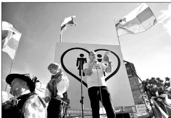
Slika 1: Shod koalicije Za otroke gre! marca 2015.

Najpogosteje je homoseksualnost uokvirjena kot grožnja otrokom. Uradni moto CIDPO je bil »hvaležen za mamo in očeta«, pri čemer sta bila mama in oče razumljena kot ekskluzivna biološka kategorija, moralno in drugače superiorna vsem drugim oblikam skrbi za otroke, še zlasti socialnemu starševstvu. Biološko starševstvo je bilo skozi njihovo interpretacijo razumljeno kot najboljša oblika starševstva, socialno starševstvo pa le kot njen približek, rešitev v sili, ki je v nekaterih primerih, kot so istospolne družine, za otroke celo nevaren. CIDPO je to pojasnjevala s posebnim, domnevno hedonističnim življenjskim slogom homoseksualcev, ki ni skladen