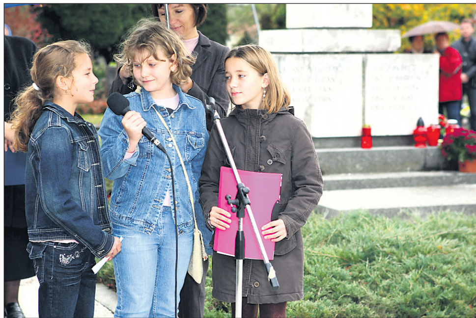
V kulturnem programu so nastopile učenke OŠ Ljudski vrt (na fotografiji), Pihalni orkester Ptuj in Komorni moški pevski zbor Ptuj.

liščin, postala najmočnejša narodnopovezovalna in narodnoreprezentativna prvina: od leta 1991 je državni jezik Republike Slovenije, od leta 2004 eden izmed uradnih jezikov EU in prav letos, ko slavimo Trubarjevo leto in mednarodno leto jezikov, je bila nekaj mesecev tudi delovni jezik Sveta EU.« Pozvala je k