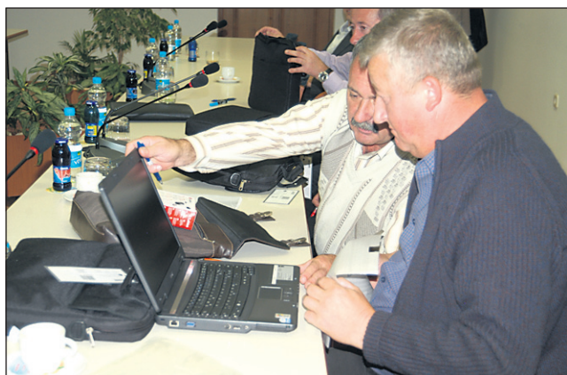
Markovski svetniki bodo lahko odslej vsa potrebna gradiva spremljali z novimi prenosnimi računalniki znamke Acer.