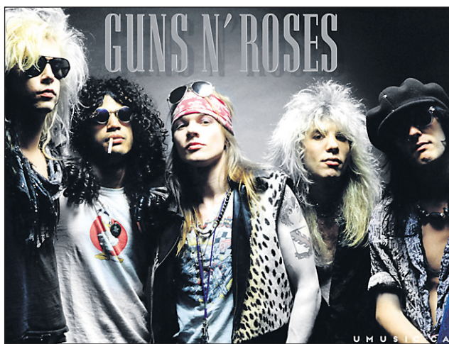
Guns N' Roses

Slavni latino pevec Enrique Iglesias pripravlja prvo kolekcijo svojih uspešnic v angleškem jeziku. Po svoji uspešni kolekciji hitov v španščini, ki jo je izdal marca letos, je pripravil še angleško verzijo, ki bi naj izšla 10. novembra. Kolekcija zajema zadnjih deset let njegovega ustvarjanja, ko je iz španščine prešel na angleščino in tako postal eden izmed naj-