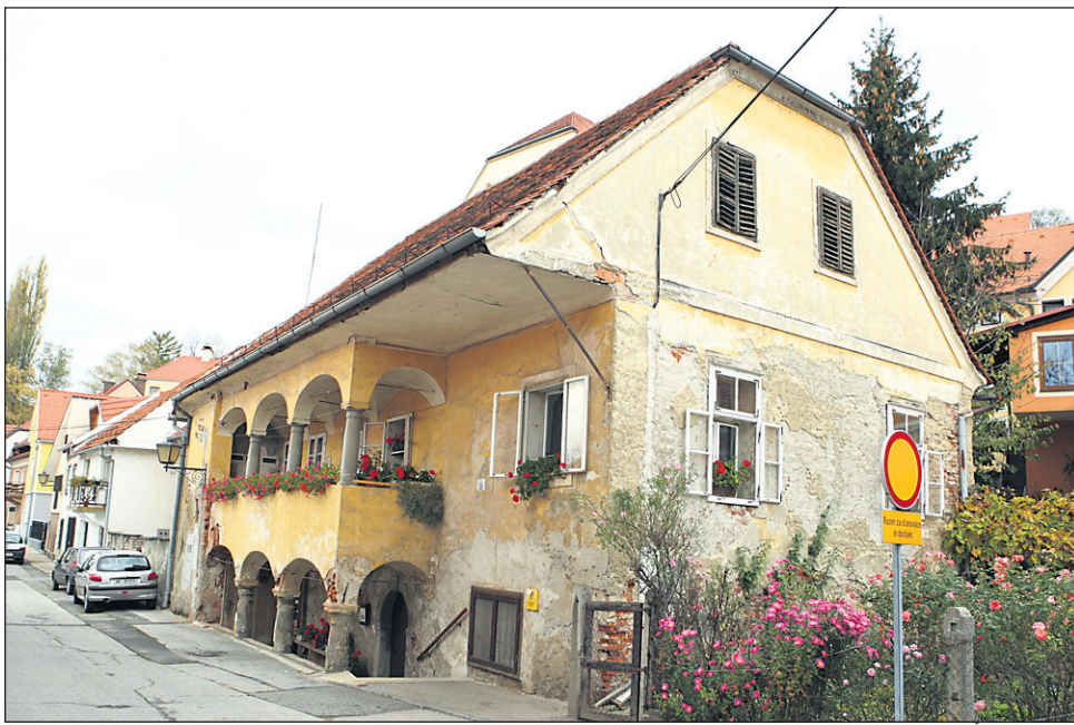
Enonadstropna hiša s stebriščnimi, v toskanskem slogu oblikovanimi arkadami v pritličju in nadstropju ulične fasade je bila zgrajena v prvi polovici 18. stoletja. Kot umetnostni in arhitekturni spomenik Ptujja pa mestu s častitljivo starostjo ni v ponos.

Enonadstropna hiša s stebriščnimi, v toskanskem slogu oblikovanimi arkadami v pritličju in nadstropju ulične fasade je bila zgrajena v prvi polovici 18. stoletja. S svojo pojavnostjo, ohranjeno tlorisno zasnovo, arhitektonskimi arhitekturnimi detaili spada med pomembnejše hiše starega mestnega jedra, česar pa iz njenega stanja ni znani. Na temeniku kamnitega portala v pritličju je viden stro-