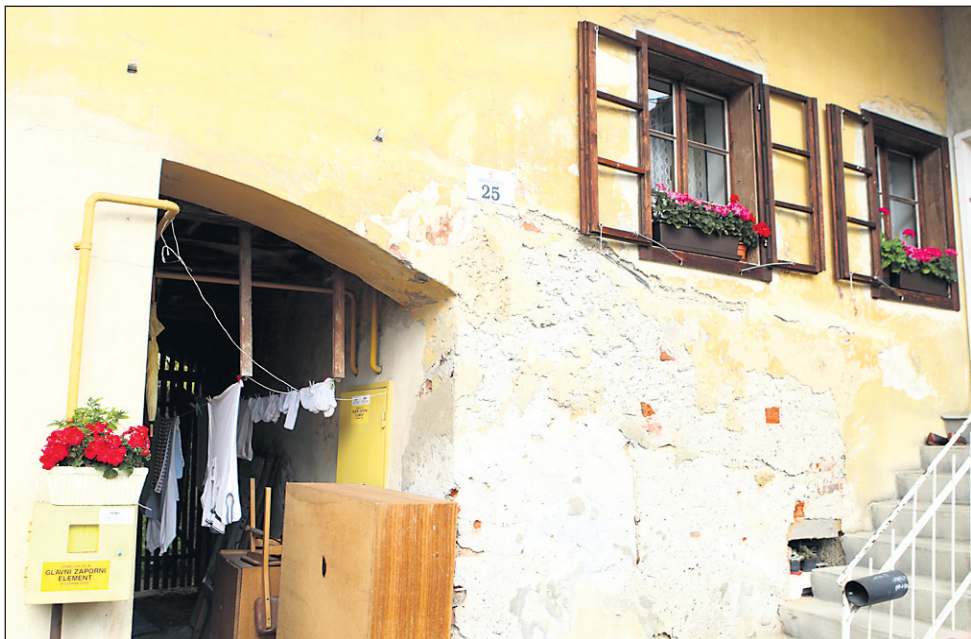
Na Dravsko 23, ki je umetnostni in arhitekturni spomenik, se navezuje Dravska 25, ki pa ni zaščitena, je pa v podobnem stanju. Obe hiši močno kazita ta del Ptujja.