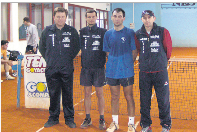
Lanskoletni naslov prvaka brani ekipa TK Skorba (na sliki).