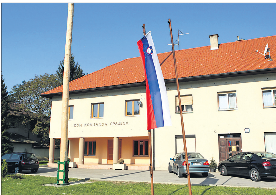
Člani sveta ČS Grajena so v celoti podprli projekte, ki so predvideni v proračunu MO Ptuj za leto 2009 za njihovo četrt, pri čemer je največja postavka, 300 tisoč evrov, predvidena za ureditev kulturne dvorane v Domu krajanov Grajena.

Člani sveta ČS Grajena so se seznanili tudi z novim načinom obravnave in sprejemanja proračuna MO Ptuj za leto 2009. Ta je bil dan v javno razpravo 22. oktobra, torej z dnem objave, ki bo trajala do 12. novembra. V tem času lahko vsi občani MO Ptuj, s tem pa tudi Grajenčani, podajo svoje pripombe, predloge in stališča. Posebej so se ustavili pri t. i. »grajenskih postavkah« proračuna. Podpirajo jih v celoti, 300 tisoč evrov za ureditev kulturne dvorane