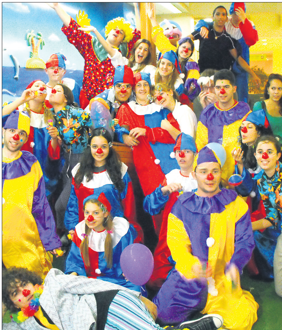
Utrinek iz Izraela