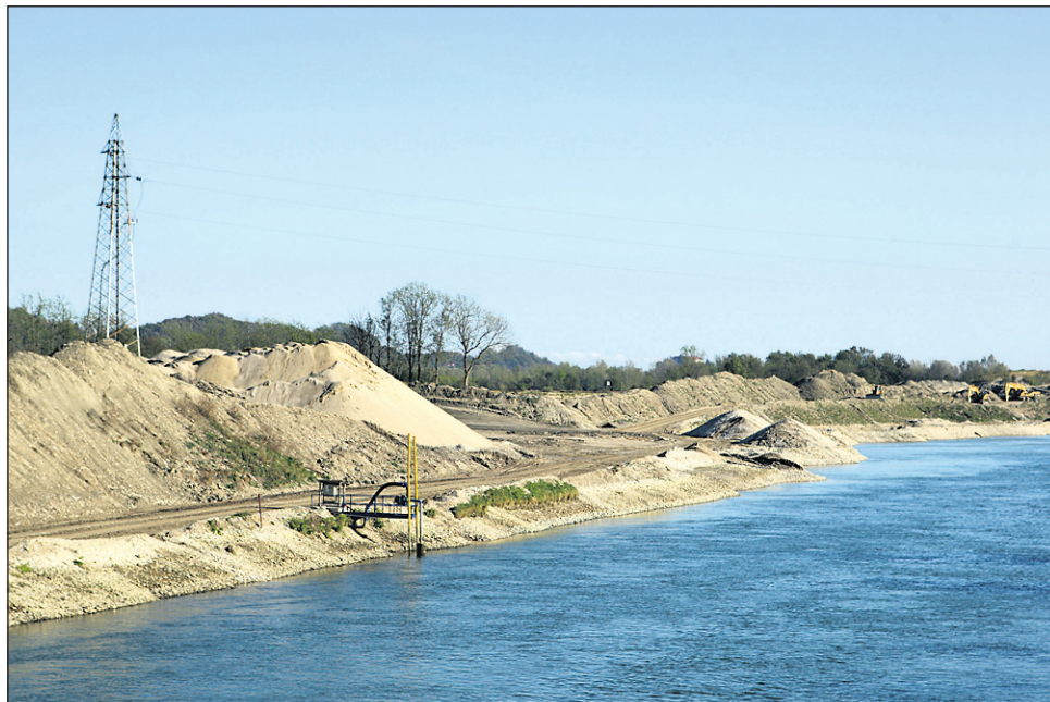
V Grajeni za zdaj ne bodo sklicali zboru krajanov v zvezi z gradnjo kartodroma. Pozvali pa so MO Ptuj, da zaščiti interese prebivalcev pri tej gradnji.