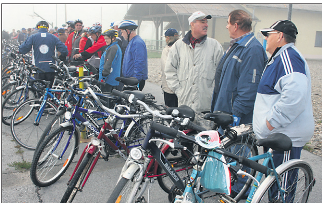
V meglenem in hladnem oktobrskem jutru se je v Slovenji vasi zbralo skoraj 80 kolesarjev.