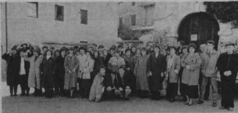
Uspešen nastop bežigraske kulturnike na Tržaškem.

Na italijanski strani sta nas že čakala predstavnika Dekliškega zbora Devin in zbora Fantje izpod Grmade, ki so bili organizatorji prireditve in gostitelji bežigraske kulturnike. Po ogledu Devina z razlago nastanka mesta in zgodovine in borbe Slovencev za narodno samobitnost, je bil na vrsti ogled razvalin starega devinskega gradu. Grad, s katerim je povezana tudi pesnitev o lepi Vidi, je stal na prepadnih skalah ob morju, s čudovitim pogledom na tr-