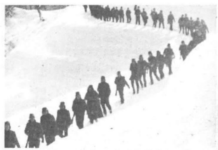
Po visokem snegu so mladi uporno korakali naprej

in Jank v Zavodnjah, kjer so udeležence pohoda nadvse gostoljubno sprejeli. S.V.