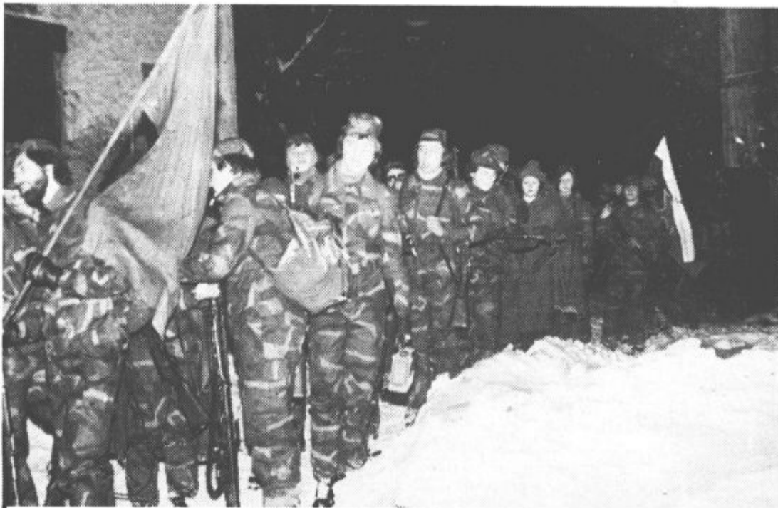
Mladi teritorialci prostovoljci med zadnjim pohodom pred slovesnim sprejemom v enote teritorialne obrambe občine Velenje.

Družbene skupine, ki posredujejo otroku prva kulturna spoznanja, do neke mere pogojujejo tudi njegov odnos do filma. Vlogo družine je potrebno dopolniti z vrsto vzgojnih ustanov, kadar želimo oblikovati kultivirane filmske gledalce. To je še toliko bolj potrebno, ker je znano, da je obiskovanje kina ena najbolj priljubljenih oblik preživljanja prostega časa mladih. Modernizacija vzgojnega sistema je torej osnovni pogoj pri oblikovanju osveščenih in dovolj kritičnih filmskih gledalcev. Po drugi strani pa je tako malo časa posvečenega prav filmu, filmski vzgoji, pa naj bo to med starši ali v šolah (izjema sta le osnovna šola v Smartnem ob Paki in Rudarski šolski center). Očitno je nesorazmerje med to zvrstjo umetnosti in drugimi, o katerih mladi v šolah nekaj zvedo. O filmu, televiziji in drugih množičnih izraznih sredstvih, s katerimi se mladi najpogosteje srečujejo, se v šolah skoraj nič ne govori. Zato mladi ne razlikujejo umetniškega filma od komercialnega, med starejšimi pa je to stanje še slabše. Vsakršna skrb za film in druge množične medije presega pouk umetnosti, ker ima velik družbeni pomen. Človek mora biti pripravljen na doživljanje filma, da bo mogel iz njega črpati duhovne koristi in ne le kupoval poceni zabave.