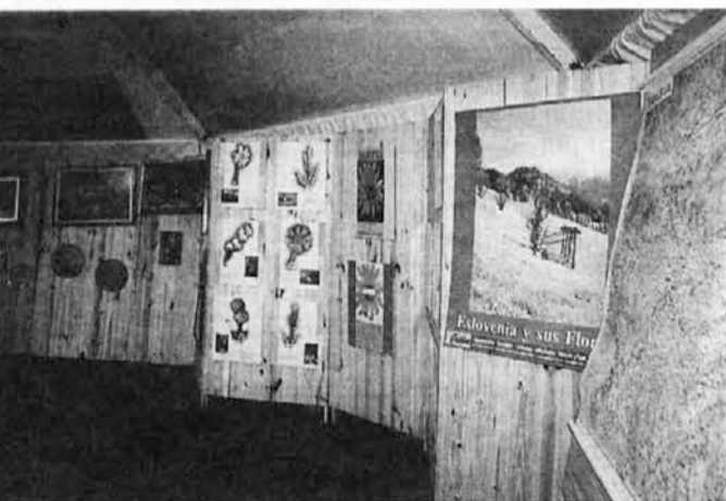
Razstavni panoji v ogromnem šotoru, kjer se Slovenci iz Rosaria vsako leto predstavijo s kulturno tematiko

Ponovno se je mesto Rosario, drugo največje v Argentini, napolnilo z barvami in bleskom, ko se je izvedlo vsakoletno srečanje narodnih skupnosti, na katerem več kot pol stotine društev predstavi svoje delo in svoje narodne korenine. Plesi, petje, rokodelstva in jedi pričajo o navadah in običajih, ki jih posamezne skupnosti ohranjajo v času in prostoru. Kot že prejšnja leta je tudi to pot