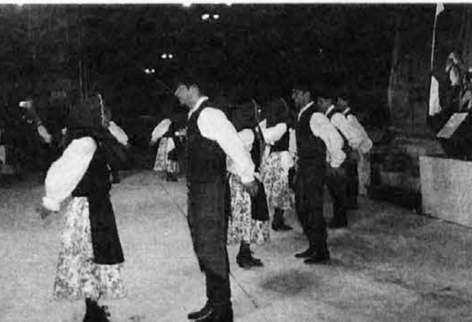
Folklorna skupina „Vesel slovenski duh“ nastopa na osrednjem odru

Na kuhinjskem področju smo predstavili in obiskovalcem ponudili različne slovenske jedi: kislo zelje, čevapčiče, kranjske klóbase, itd; imeli smo pa tudi na razpolago raznovrstne posladke, ki so zgovorno pričali o