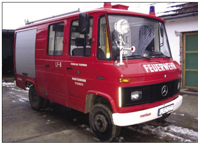
Gasilski avto, steroga so küpili v Avstriji

»Nej, tau smo vse na drugo leto tjüpili, kak smo pejnaze leko vküpspravili. Najprvin, gda smo na tekmovanje šli, te nam je Hodoš dau opremo na pausado.«