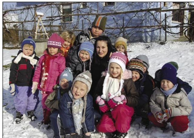
Vsakši den je v drugom vrtci, kejp smo napravili v Sakalauvcaj, gde je največ mlajšov v vrtci

»Delala sem v Murski Soboti, gde mi je naša ravnateljica, moja prejdnja povōdala, ka za tau leto iškejo nauvo vzgojiteljico prejk grajnec. Odlaučila sem se za delo, štero mi je veuki izziv (kihívás).«