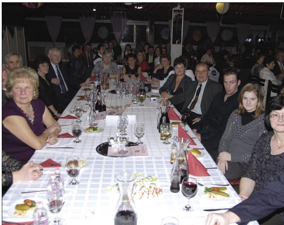
Na sombotelskom slovenskom plesu je bilau kauli 150 lidi, Slovenci, Madžari, Hrvati

Tau staro šego so na desetom, jubilejnom plesu v Somboteli gorpredidili, depa maškare samé so nej zavolé mauči mele, vej je pa zima letos dostakrat krepka bila. Zatok so oprvin vsi navzauči – šteri je kauli stauptdeset bilau -, vzeli füčline, ka