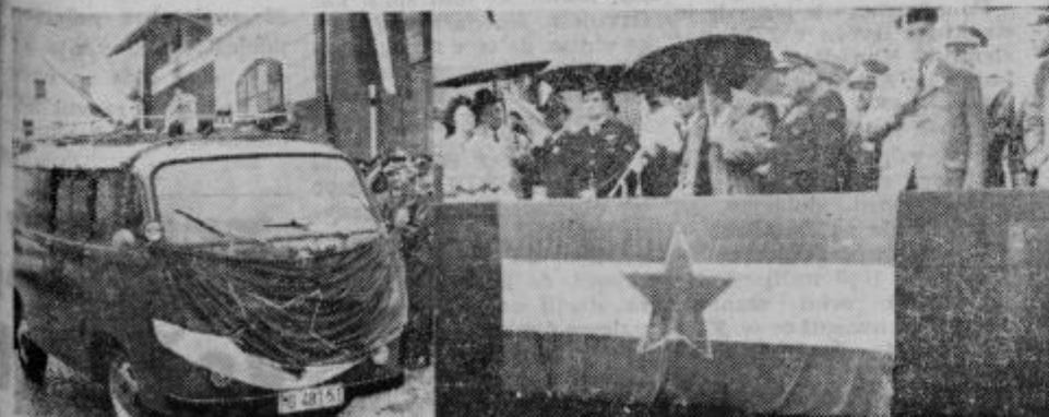
Predsednik SO Ormož izroč a ormoškim gasilec nov a vto kombi IMV.

Član zveze komunistov je postal leta 1965, kmalu pa so ga izvolili za sekretarja osnovne organizacije v tovarni. Od leta 1967 je tudi član komiteja in občinske konference ZKS. Je tudi član analogne komisije pri občinski konferenci ZKS Ptuj in član komisije za mednarodna in ekonomska in politična vprašanja pri CK ZKS.