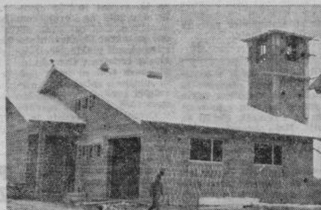
... še bolj pa gasilski dom

Tudi gasilci se upravičeno vesele, čeprav njihov dom še ne bo tako kmalu končan. Še bo potrebno zbirati sredstva, čeprav so v lesu in delu že doslej prispevali veliko. V gasilskem domu bo tudi dvorana, ki bo služila krajevnim potrebam. Upati je, da bo po nekaj letih spet zaživelo kulturno delo.