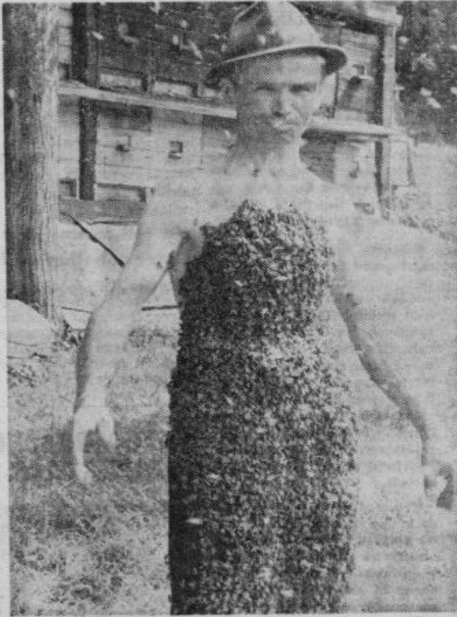
Trgovsko podjetje »Povrtnina« Maribor, Tržaška 111, objavlja prosti delovni mesti