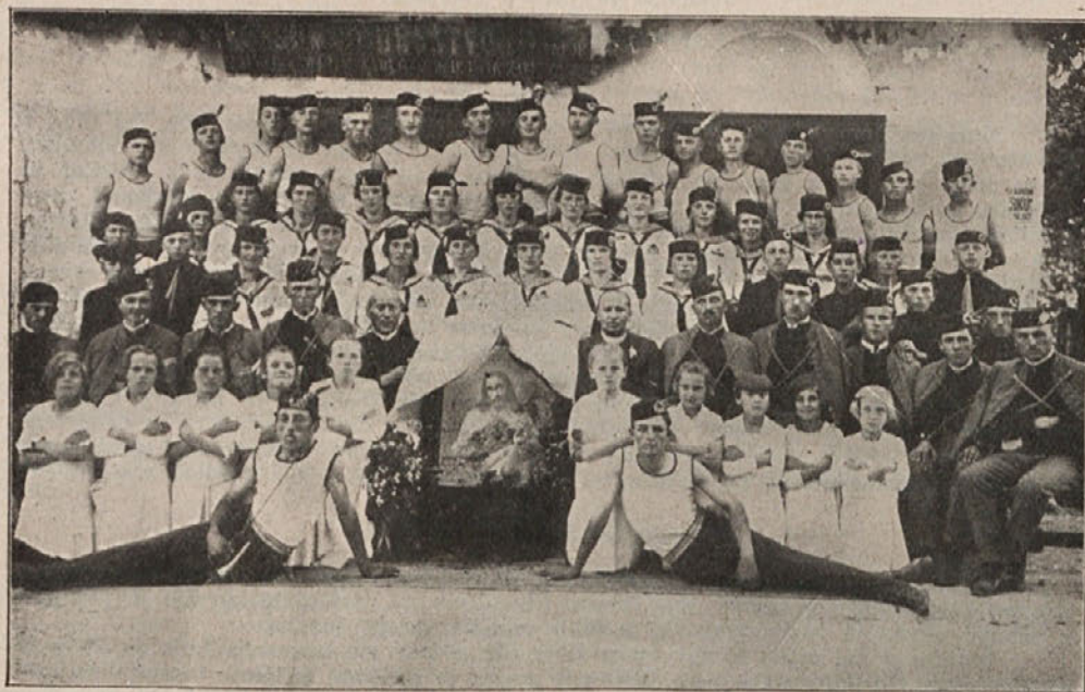
Orlovska družina St. Jernej na Dolenjskem. (Posvetitev presv. Srcu Jezusovemu.)