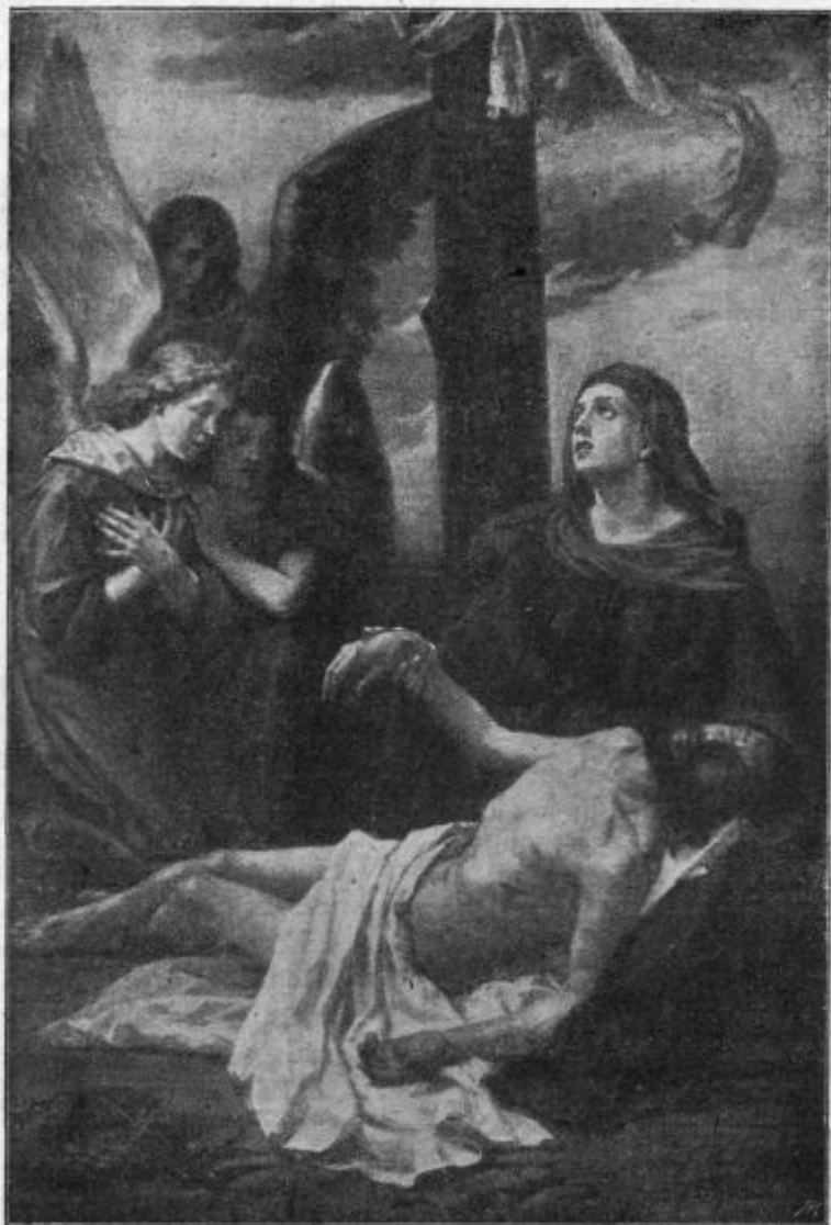
Matí žalostna — žalostnih vzor in tolažba.

Moder in skušen mož je to, si mislim, mogoče ti pomore z dobrim svetom iz zagate. Začel sem se pripravljati na kratko potovanje. Ženi sem rekel, da moram iti v mesto po razne potrebščine; pri tem pa