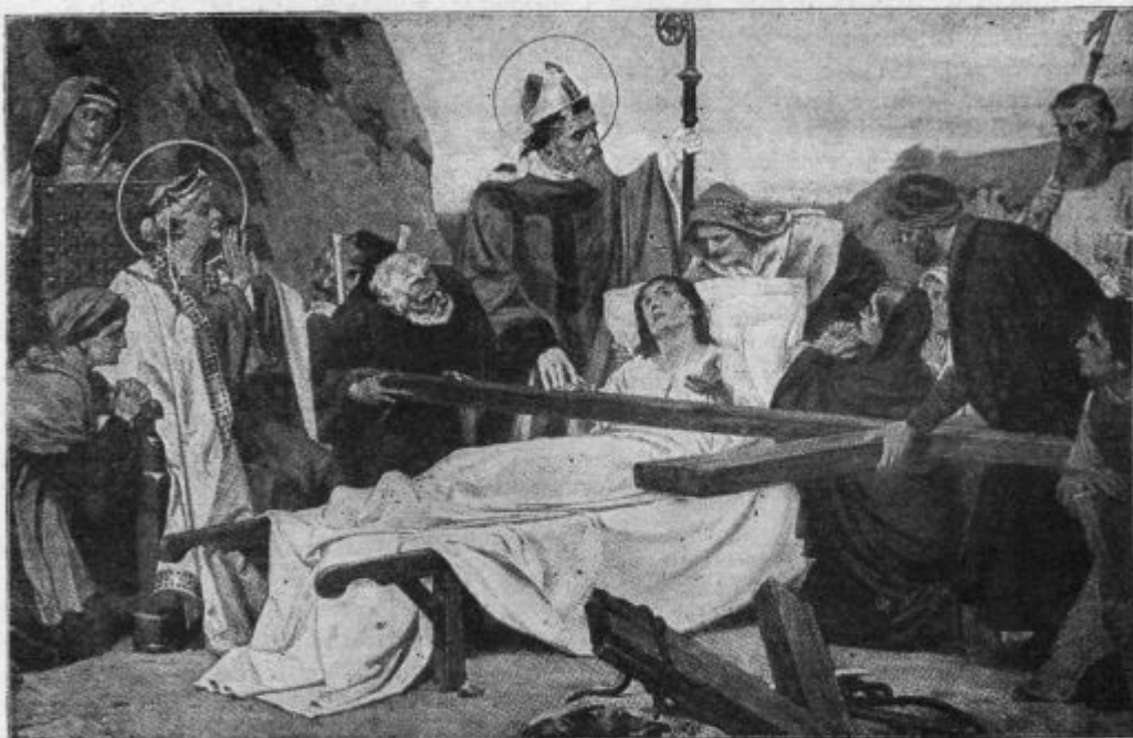
Povišanje sv. križa (14. septembra).