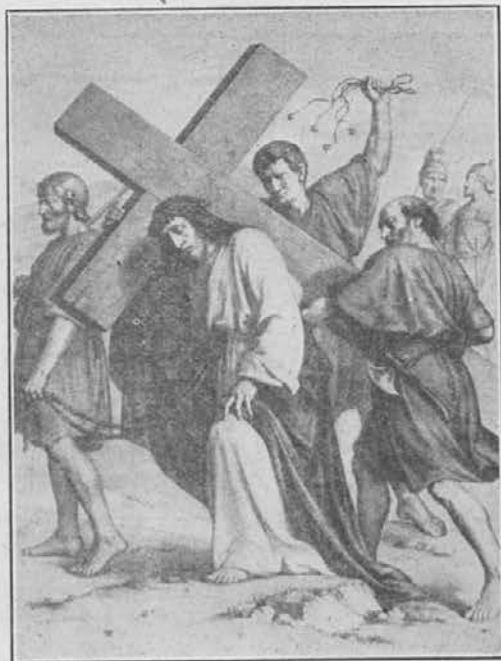
V. postaja križevega pota.

Toda, kmalu se bolniku še bolj poslabša.