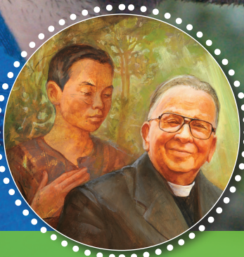
JE SVETOST NALEZLJIVA?