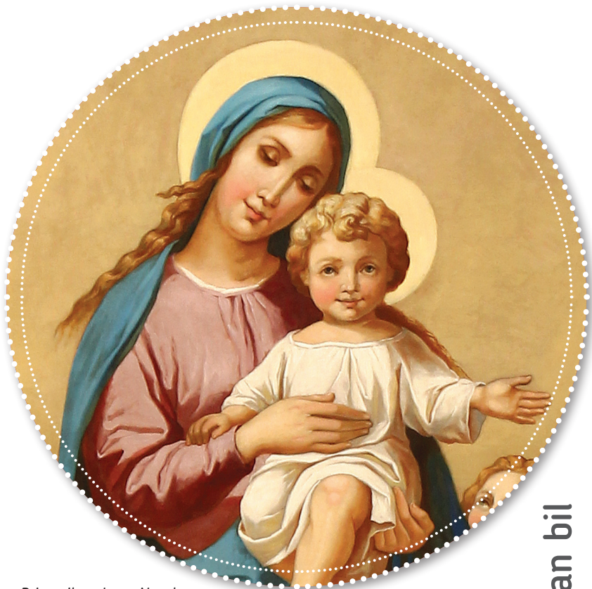
Pripravila s. Irena Novak

Kralj, ki služi ljudstvu; od njega ne zahteva ničesar: nasprotno, za njegovo odrešenje daje vse! Ni podoben kraljem, ki svoje podložni-