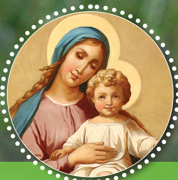
MOLIMO Z MARIJO