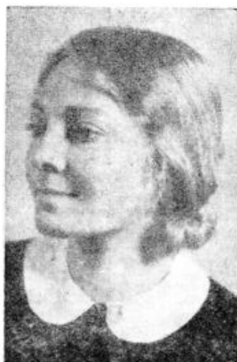
S. Rainer, „nemški glas“ Grete Garbo