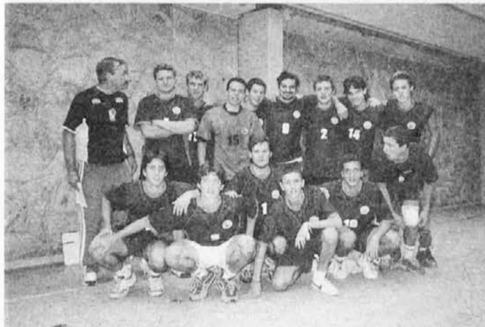
SFZ iz San Justa

In na ta dan je bila sanhuška dvorana tudi lepo okrašena. Način okrasov bi lahko primerjali z vsakim