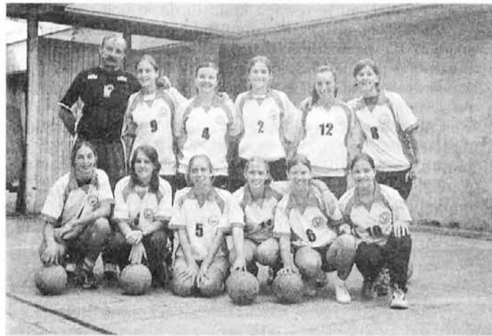
SDO iz San Justa

Bronasto medaljo so si osvojila dekleta s Pristave, ko so premagala sanmartinske nasprotnice 2-0 (25-20;25-11). Eestitke obema ekipama in jima želimo, da bi se vztrajno trudile in dosegle zaželene cilje.