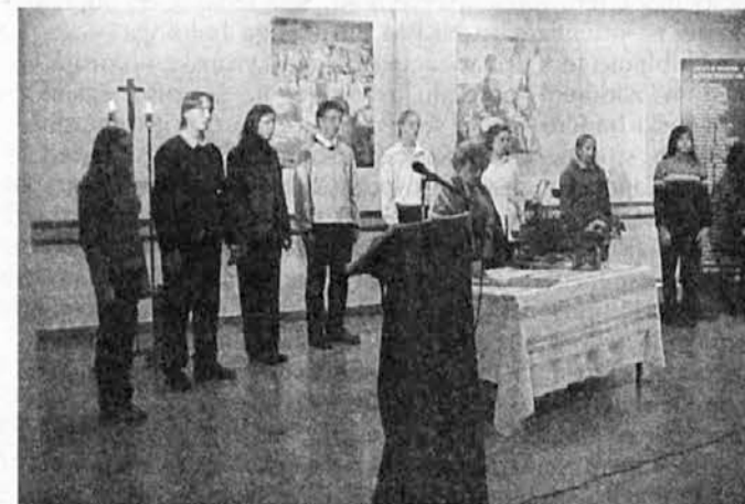
Spodaj: Bivši domobranci.