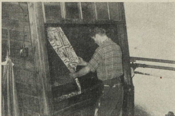
Razvijanje tiskanih tkanin. Ni moderno, gre pa

potrebno pa je, da se zainteresira čim večje število proizvodnih podjetij, znanstveno raziskovalne ustanove, kakor tudi potrošnike, kateri morajo ves material obdelati, je neobhodno potrebno določiti primerne roke za diskusijo in rok, ko naj standard postane veljaven.