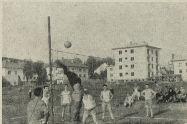
2 : 0 za naše v odbojki. To je bil zadnji posnetek fotoreporterja, ker je moral nato domov. Zato k sreči v albumu ne bo posnetih porazov, ki so nato sledili

18. Konkretno predloge, ki so bili podani med posvetovanjem, naj Zavod za standardizacijo pri sestavi standardov upošteva.