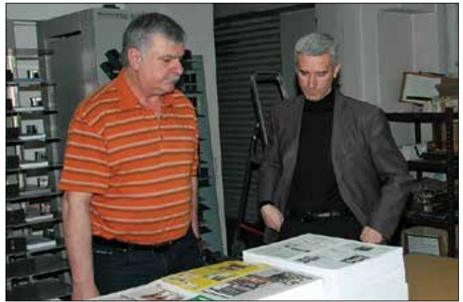
V Grafiki Gracer med drugim tiskajo tudi Savinjske novice.

V desetletjih so si prigrisposodari 1.200 m 2 proizvodnih prostorov, nabavili so nove, zmogljive in tehnološko napredne stroje za tiskarsko dejavnost, ustvarili soliden trg za prodajo grafičnih in tiskarskih storitev. Načrtujejo tudi oblikova-