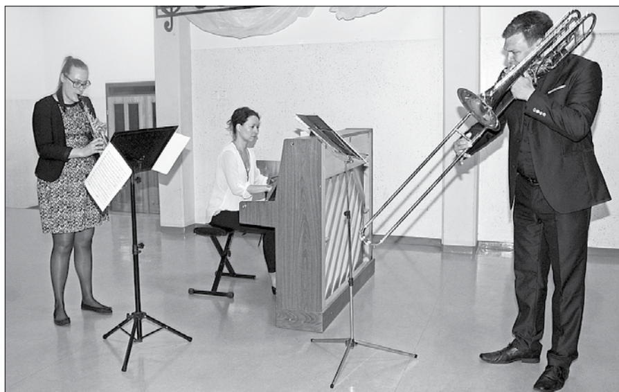
Na Rečici ob Savinji so glasbeniki skupine XXL pripravili pester kulturni program.