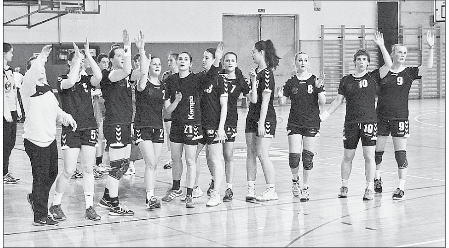
Končno tretje mesto v 1. B DRL je lep uspeh nazarskih rokometnic.