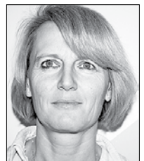
Prisravnica in fotografirala Marija Šukalo

Mislim, da bi morali bolje izkoristiti biomaso, če jo že imamo. Zavod za gozdove kar dobro opravlja svoje delo. Kar se tiče poškodovanega lesa iz gozdov pa menim, da ni še povsod pospravljen. Tudi pri nas smo imeli kar veliko podrtega drevja, vendar smo ga sami spravili.