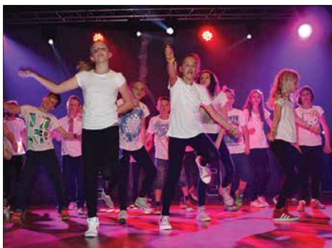
Otroci so izvedli zanimive koreografije, ki so navdušile številno občinstvo.

zali v poldrugi uri plesa. Tako je bilo mogoče videti najmlajše, ki se s plesom šele spoznavajo, in vse do petnajstletnikov, ki obvladajo raz-