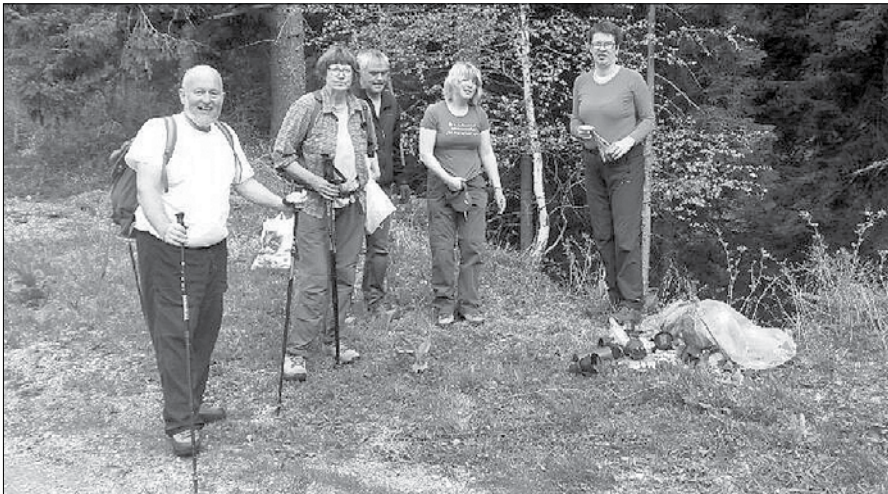
Člani Planinskega društva Ljubno ob Savinji so pregledali in čistili planinsko pot iz Rastk, čez Pinturijevo do kočice na Smrekovcu.

Člani planinskih društev iz Črne na Koroškem, Šoštanja, Velenja in Ljubnega ob Savinji so v soboto, 9. maja, po treh letih izvedli očiščevalno akcijo Naravovarstvene zveze Smrekovec. Očistili so poti, ki vodijo na Smrekovec in bližnjo okolico doma na Smrekovcu.