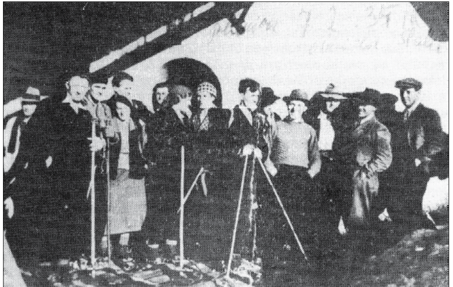
Delavci v Nazarjah so ustanovili turistično društvo TK Skala. Fotografirano 7. februarja 1934 pred stavbo na Planici.

Delavci, organizirani v JSZ, so 7. februarja 1934 na Planici ustanovili TK Skala. To je bilo turistično društvo naprednih ljubiteljev gora in predvsem visokogorja. Da so se odločili za la-