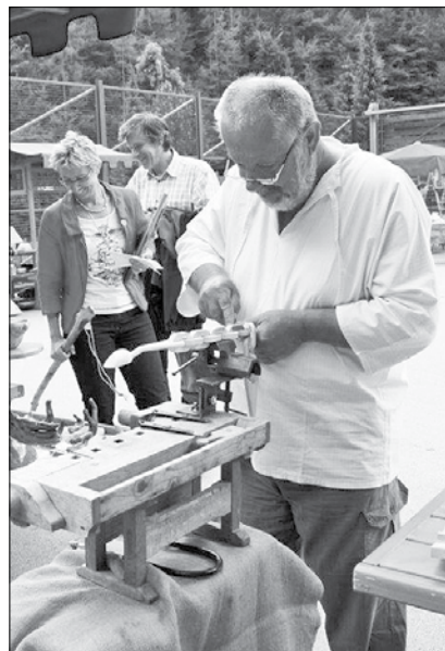
Utrinek z lanskoletnega festivala

Nedeljo so organizatorji rezervirali za predstavitve sejmarjev, ki bodo predstavili delo pri oblikovanju lesa in lesne izdelke. Dogajanje med štanti bodo popestrili z izdelavo lesenih mask, zabavnim tekmovanjem z lesenimi igrami in kiparjenjem z motorno žago.