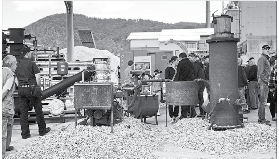
Na lanskem dnevu podjetja Biomasa so si obiskovalci lahko ogledali nove kotle in predhodnico moderne kogeneracije na lesni plin.

Kot je lahko prebrati v sporočilu za javnost iz plenarnega zasedanja Evropskega parlamenta, poslanci podpirajo namero Evropske komisije, da skupaj z državami članicami in zainteresiranimi stranmi pripravi ambiciozne, objektivne in dokazljive merila in kazalnike za traj-