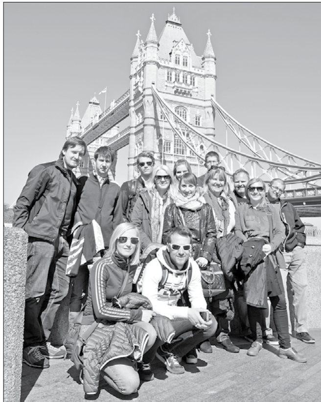
Konec aprila so se člani Gledališča Mozirskega odpravili v London, kjer so si ogledali tamkajšnjo izvedbo Mišolovke.