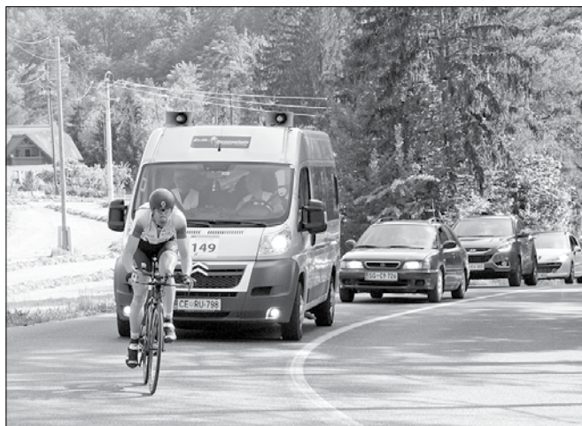
Erik Rosenstein in spremljevalna ekipa na gorenjskem klancu