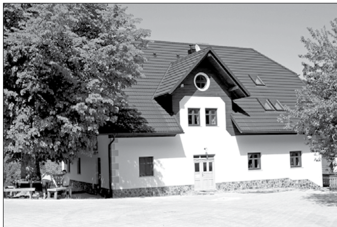
Hiša Pečovnik v Strmcu predstavlja izpopolnjeno turistično destinacijo v občini Luče.

Novo zgradbo so zgradili v dobrem letu, pretežno z lastnimi sredstvi in kreditom, dobra tretjino pa so si zagotovili iz evropskih sredstev. Klasična kmečka družina je preoblikovana v specializirano turistično-gostinsko ponudbo tudi za ohranjanje zdravja ter pridobivanje duševne in telesne kondicije zaposlenih v tem dinamičnem času.