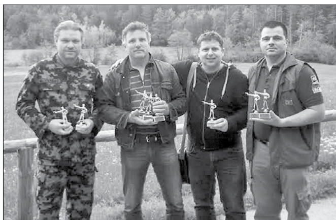
Najboljši strelci tekmovanja

Naročniki Savinjskih novic imajo 15% POPUST pri objavah zahval in čestitk.