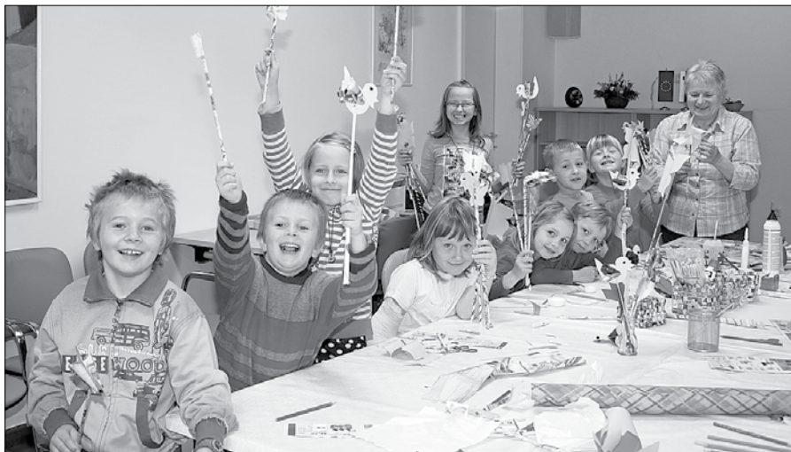
Ustvarjalnic se je v povprečju udeleževalo po 18 otrok od četrtega do desetega leta starosti.