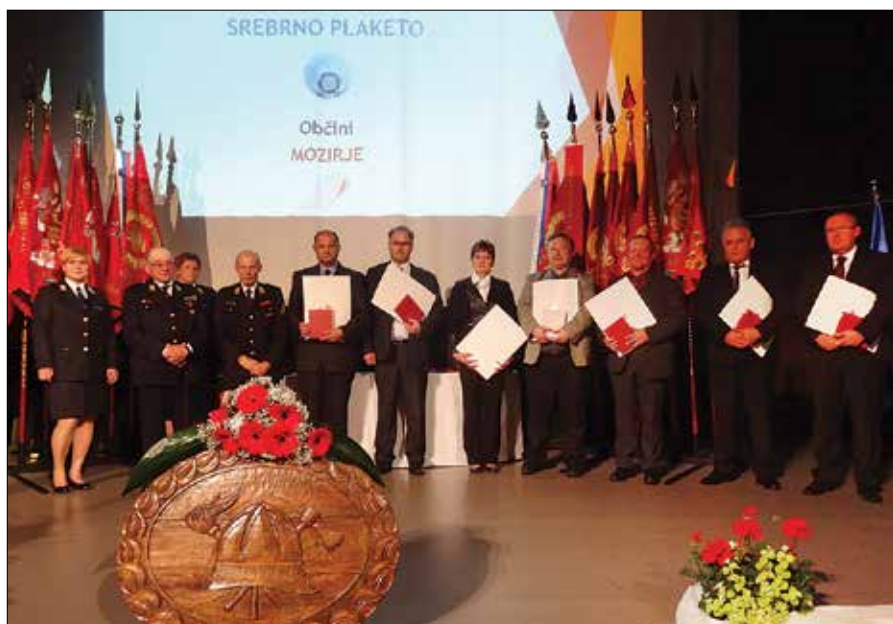
Srebrne plakete GZ ZSD so za občine Zgornje Savinjske doline prejeli županja in župani.