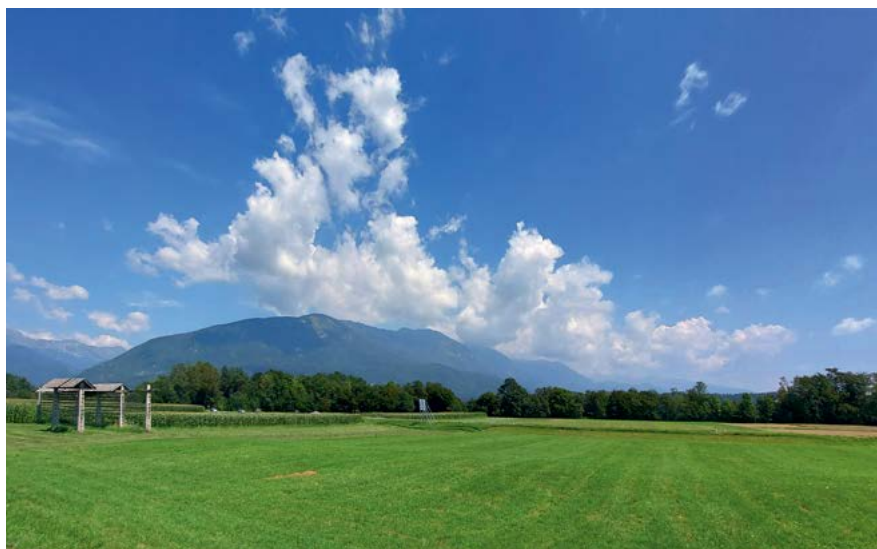
Kriška gora

volja sta na svojevrstni preizkušnji, kar se nadaljuje tudi po dolgem grebenu do Tolstega vrha. Tudi spust do Gozda in naprej do Golnika ni preprost, ga pa popestrijo razgledi in možnost opazovanja rastlin ob poti, kar nasploh izlet iz Tržiča čez Kriško goro in Tolsti vrh do Golnika še posebej odlikuje.