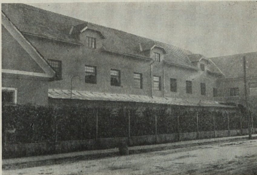
Iz kronike našega podjetja: stari obrati, obnovljeni po požaru 1934. leta.