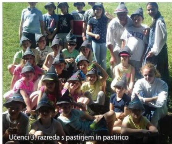
Učenci 3. razreda s pastirjem in pastirico