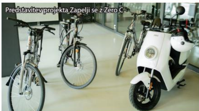
Predstavitve projekta Zapelji se z Zero C