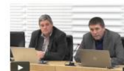
1. izredna seja občinskega sveta | Maj 2019