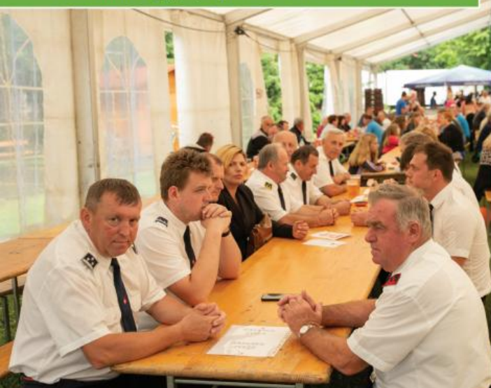
Foto utrinki dogajanja v prireditvenem šotoru