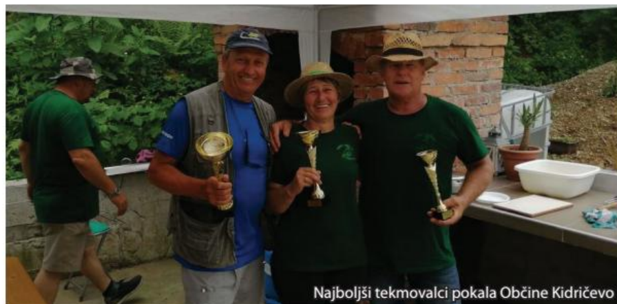
Najboljši tekmovalci pokala Občine Kidričevo