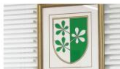
5. redna seja obč. sveta | Junij 2019

Dogajanje v naši občini lahko sledite tudi na povezavi https://vimeo.com/kidricevo