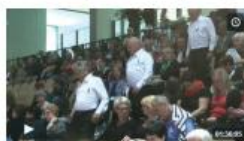
15. revija od Drave do Save | Maj 2019