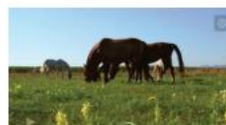
Predstavitve občine ...