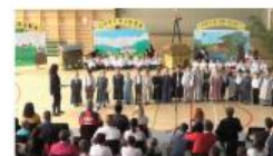
Zaključna prireditev vrtca Cirkovce | Maj 2019