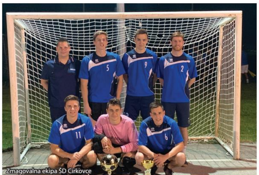
Zmagovalna ekipa ŠD Cirkovce