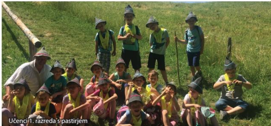
Učenci 1. razreda s pastirjem

Letošnji izlet je bil za učence 1. in 3. razreda OŠ Cirkovce na Pohorju. Odpravili so se v Jurišno vas nad Slovensko Bistrico, kjer so preživeli čudovit dan v naravi, v družbi pastirjev in njihovih običajev.