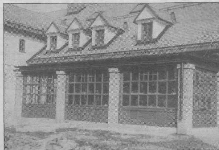
Slovenska gostilna – ali HIŠA STRAHOV?