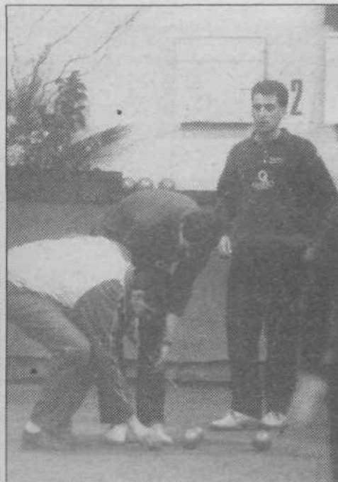
Nastop balinarjev v četrtfinalu evropskega pokala