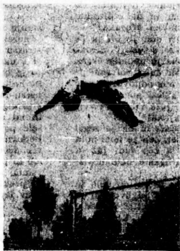
Salto (premet) z droga br. Janeža.