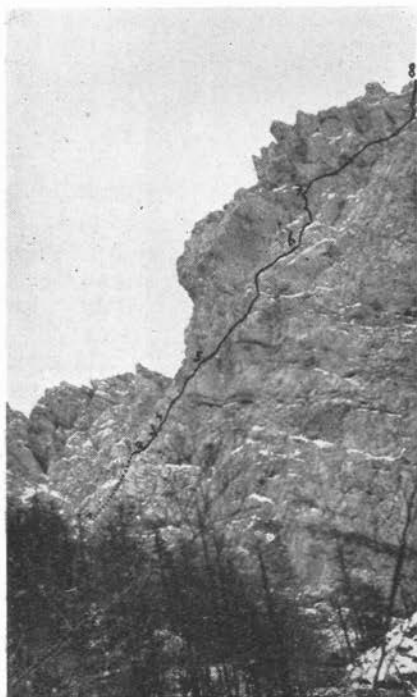
Na Rzenik