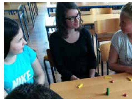
Študenti predstavljajo svoje podjetniške ideje.

Vsak učenec dobi deset paličic. Uporabi jih za predstavitev sebe (npr. videza; svojih interesov in konjičkov; izkušenj, načrtov, idej; prijateljev, družine, doma). Učenci nato v paru ali v skupini opišejo sebe.