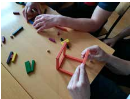
Učenci gradijo modele s Cuisenairovimi paličicami.

Cilj: podajanje, usvajanje in utrjevanje besedišča, slovnične strukture It's Paličice uporabimo kot gradnike za vadenje besedišča. Ko zgradimo model, učence povprašamo, kaj smo zgradili ( What's this? ). Učenci odgovarjajo, npr. It's a house. / It's a car with two passengers. / It's a man fishing by the river. Možna različica te aktivnosti je, da neki model sestavijo učenci in nato sošolce povprašajo, kaj postavitev predstavlja. Ali pa da s sestavljanjem prične učitelj, nadaljujejo pa učenci, pri čemer mora biti iz začetne postavitve razvidno, kaj smo želeli sestaviti, sicer se aktivnost lahko kaj hitro izjalovi in ne da pričakovane rezultata. Poudarim naj še, da to aktivnost lahko uporabimo le za konkretno, razmeroma osnovno besedišče, težje pa s paličicami upodobimo abstraktne besede, pojme ali kompleksne besedne zveze.