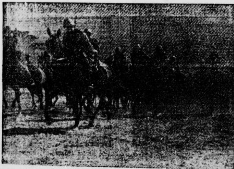
Oddelki konjenice italijanske armade v Rusiji na pohodu skozi stepe na vzhodnem bojišču.

Plačajte naročnino za »Domoljub« še ta mesec! Kdor ne bo plačal, mu bomo list ustavili!