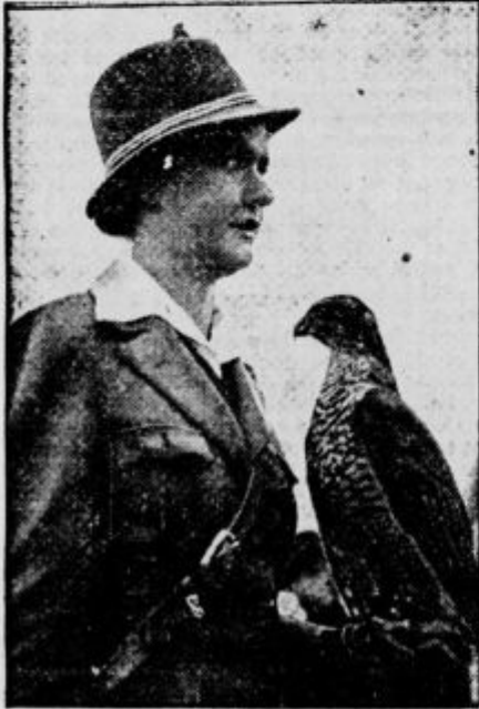
Sokoli ločijo gibajoče se predmete, na daljavo 1700 m

Želo sta razvita pri nekaterih živalih tudi sluh in vid. Med pomorsko bitko pri Skageraku so se zaradi grmenja topov razburili fazani, čeprav so bili od bojišča 400 km daleč. Sokoli ločijo gibajoče se predmete na daljavo 1700 m, torej bolje kakor najizvrednejši daljnogledi. Najbrž zmorejo to po kakem šestem čutu, ki ga mi ne poznamo. Podobno opazujemo tudi pri golobih-pismonoših, ki najdejo svojo zračno pot do 1600 km. Ugotovili so, da drve nosorogi v ravni črti k drugemu kilometru oddaljeni vodi, ako se je običajno napajališče posušilo.