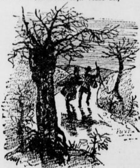
razposajeno je bilo najino skakanje

Vtaknil sem njegovo roko pod mojo, vzel njegovo borbo in stopal z njim dalje naprej, ne da bi se branil. Tako sem se na pošten in časten način rešil vic v tistem vozu. Zdaj nisem bil daleč od posestva svojega starega strica in nisem imel nobenega strahu več pred Dudgeonom. Imel sem potemtakem dovolj vzrokov, da sem bil razposajeno dobre volje. Dozdevalo se mi je, kakor da sva midva dve majčeni, samotni lutki pod neizmernim mrazim evodom noči. Ves prostor je bil okrašen, mesec poliran, tudi najmanjša zvezdica prižgana, tla pometena in povosčena in tako ni manjkalo drugega kot godba, da bi zaplesala. Od velikega veselja sem sam zaigral neki napev. Ob teh zvokih sem ovil roko Dudgeonu okoli pasu in odplesala sva po griču dol! Izpocetka se je sicer nekoliko hladno držal, toda vselemu napevu, noči in mojemu zgledu se ni bilo mogoče ustavljati. Iz ilovice narejen človek bi moral plesati in tudi Dudgeon je pokazal, da je človeško bitje. Vedno bolj