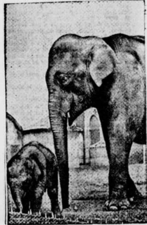
Slon gre na pokopališni kraj, ko se mu bliža smrt

Le redno plačevanje naročnine omogoča izhajanje lista!