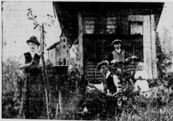
Čebela vedno najde svoji pani, čeprav se je bila oddaljila več kilometrov

Zato še ta mesec poravnajte naročnino za »Domoljub« pri župnem uradu ali pri našem zastopniku v svojem kraju ali pa po priloženi položnici!