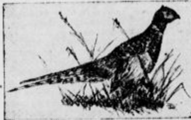
Fazani slišijo na 400 km daleč