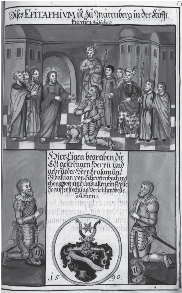
Slika 5: Slikani epitaf bratov Schrottenbach v nekdanji župnijski cerkvi v Radljah ob Dravi (StLA, Handschrift 28/5, str. 797)