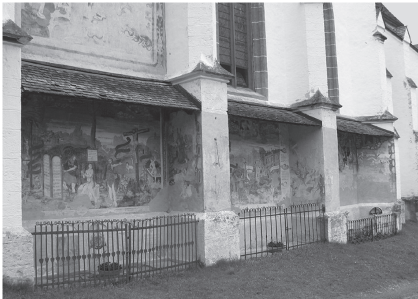
Slika 3: Ciklus poslikav na nekdanjem protestantskem pokopališču v Rantenu na Avstrijskem Štajerskem

zaspani gorski vasici so se ob koncu 16. stoletja zbirali zelo razgledani pripadniki nove vere, med drugim se je tam rodil tudi znameniti avtor in geograf Martin Zeiller (1589–1661). Druge sorodne freske so še dobro ohranjene na zunanjščinah cerkva v vaseh Sagritz in Lind an der Drau na Avstrijskem Koroškem, kjer so nekoč prav tako stala protestantska pokopališča. 36