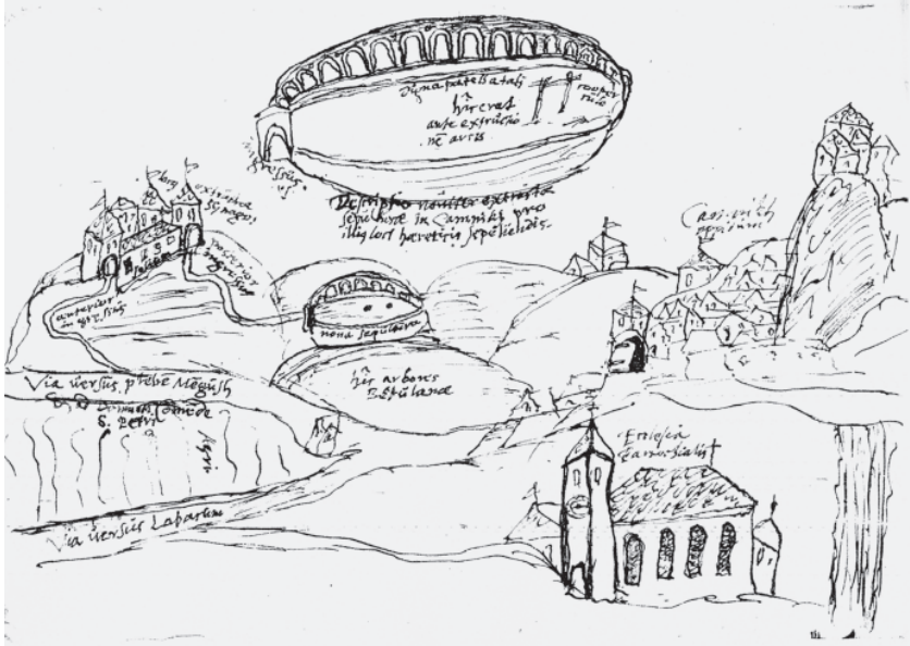
Slika 4: Skica protestantskega pokopališča v Kamniku iz leta 1595

Ali so za pokopališče pri gradu Betnava v Mariboru zares hoteli izdelati celoten ikonografski cikel, ali pa so bile niše namenjene le posamičnim slikanim epitafom, iz ohranjenih dokumentov ni razvidno. Pred krajšo razpravo o epitafih pa je treba v sklopu o protestantskih pokopališčih na Slovenskem, ki so se zgledovala po nemških vzorih, omeniti še nekdanje protestantsko pokopališče pri Kamniku pri gradu Križ. Če zanj niso ohranjeni tako natančni podatki, kot za zgoraj obravnavani strukturi v Govčah in pri Betnavi, pa se je v Videmskemem arhivu ohranila precej zgovorna skica, izdelana leta 1595 (slika 4). 37 Za razliko od dveh štajerskih in znanih nemških pokopališč je bilo tisto pri gradu Križ v Kamniku ovalne