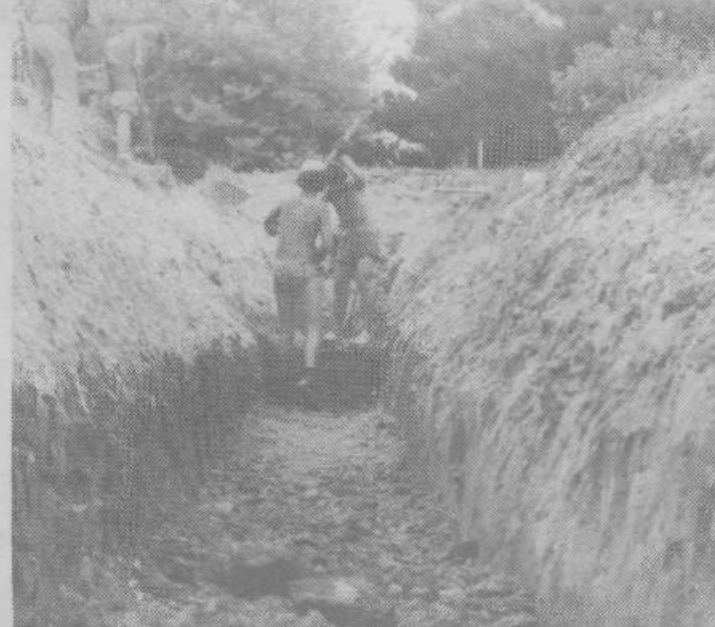
Vodovodni kanal je dal brigadirjem mnogo opravka, a so se zelo izkazali tudi pri aktivnostih v prostem času. Trije brigadirji so bili proglašeni za udarnike, deset pa je bilo pohvaljenih, sadovi te akcije pa se bodo prav gotovo pokazali tudi v družbenopolitičnem in državnem delu na VI. gimnaziji

Krajevne organizacije in občinski odbor RKS