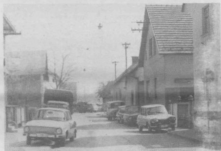
Po posnetku sodeč bi „pajak“ tudi na našem koncu imel obilo dela. Le zakaj so prometni znaki?

Kljub nekaterim rezultatom nam ostane torej še veliko dela. E. JAZBINŠEK