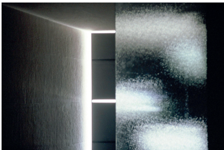
Kapela v Frančiškanskem samostanu v Ljubljani