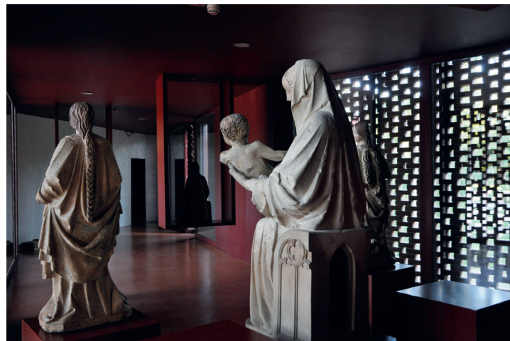
Grajska pristava v Ormožu

a po drugi strani potrebujemo tudi definiranost. Prostor brez strehe ali zidov ne obstaja, potrebuje neko mejo. Kako to mejo ustvariti, pa je stvar lokacije, programa, ustvarjalca in uporabnika. Prepričana sem, da je pri tem ključno merilo svoboda. Tudi če moraš prostor zamejiti, lahko to narediš tako, da svoboda ostane.