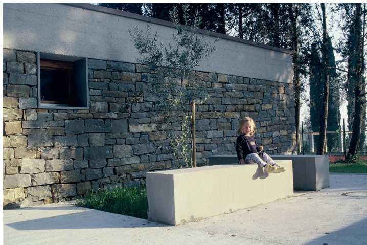
Vila Ventrelli pri Portorožu

»Arhitektki iz biroja Grafton sta izjemno veliko naredili za emancipacijo in za to, da dokažemo, kako velike borke smo. Včasih smo celo večje borke za pravo stvar kot moški.«