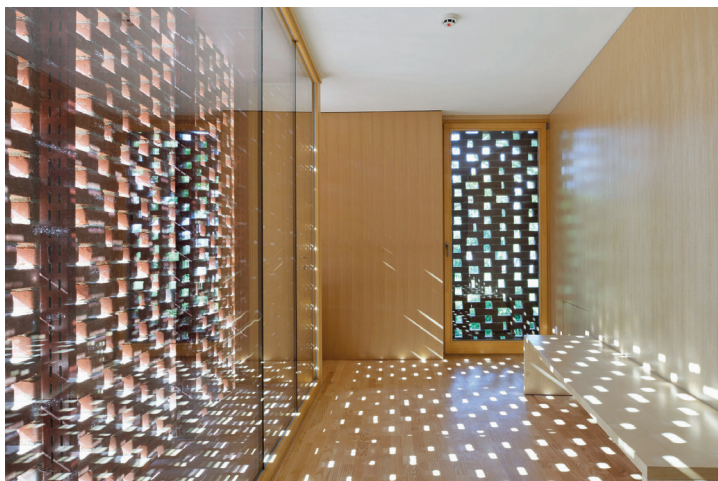
Grajska pristava v Ormožu