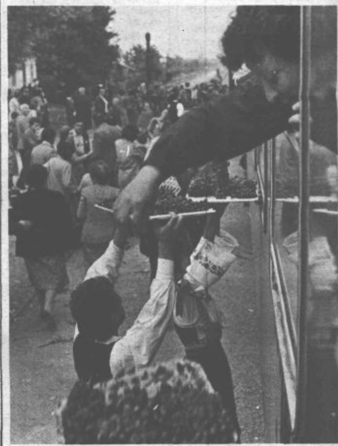
Ob vsakem postanku vlaka je bilo takole

Vlak bratstva in enotnosti je resnično izjemen dogodek, ki ga je težko prelitati v besede, treba ga je pač, tako kot praviijo vsi udeleženci, doživeti.