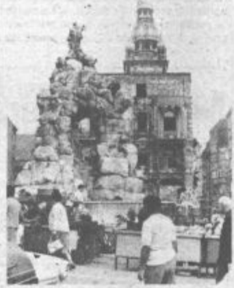
Ogled Brna je bil posebno doživljaj

Po kosilu, ki nam je kajpak teknilo, smo se z avtobusom odpeljali v smeri Blansko na Moravsky kras. Tam smo si z zanimanjem ogledali, s pomočjo vodiča in prevajalca, podzemno jamo, ki je sicer manjša od postojnske, vendar veličastni kapniki, ki s svojim mogočnim sijajem kar tekmujejo med seboj, kateri je lepši in večji, v ničemer ne zastajajo za tistimi v Postojnski jami. Prvo polovico poti v jami je treba prepešati po lepo urejeni pešpoti in številnih stopnicah, potem pa se pot strmo spušta vse do kanjona ponikalnice.