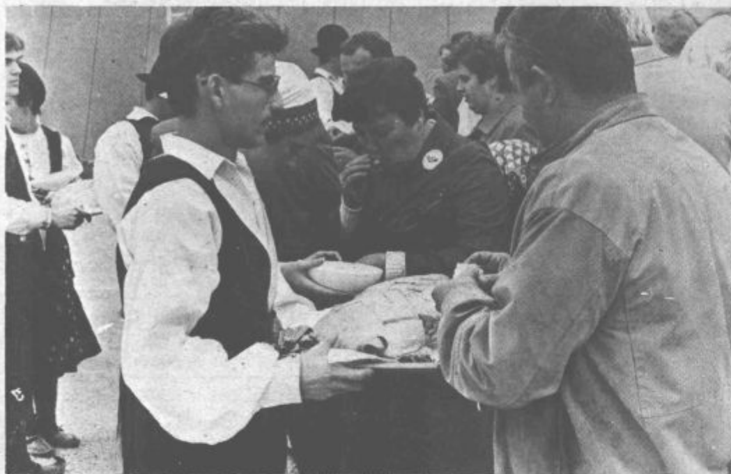
V Beogradu so udeležence Vlaka bratstva in enotnosti po stari slovanski navadi sprejeli s kruhom in soljo