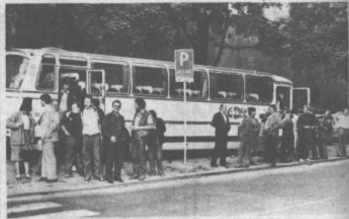
Po dolgi in naporni vožnji prispeli v Brno

Še eno prijetno presenečenje nas je čakalo ta dan po večerji, in sicer v Holicach. Tam nas je namreč v enem izmed gostinskih lokalov pričakala godba na pihala, ki je bila pred nekaj tedni na obisku v Titovem Velenju in s katero ima Avto-moto društvo Šaleška dolina že nekaj let tesne stike. Ni sicer bila povem kompletna, njihovo igranje pa je vse nas kaj hitro pritegnilo na plesišče. Ples je trajal dolgo v noč in bi