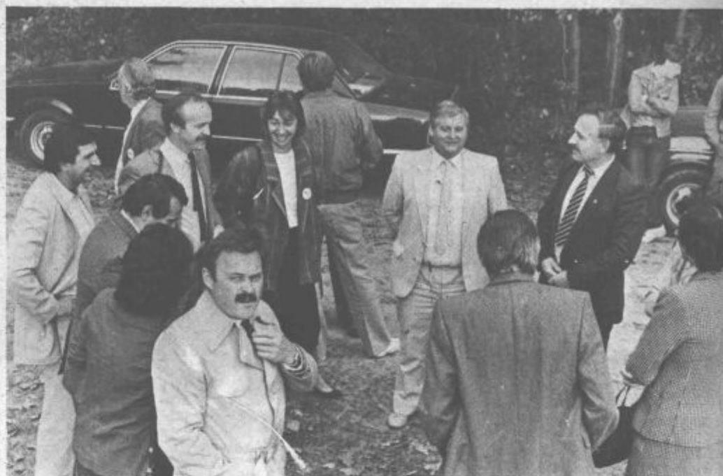
Tudi naša delegacija se je udeležila slovesnosti, ki so bile organizirane ob dnevu osvoboditve in v spomin na Popinsko bitko