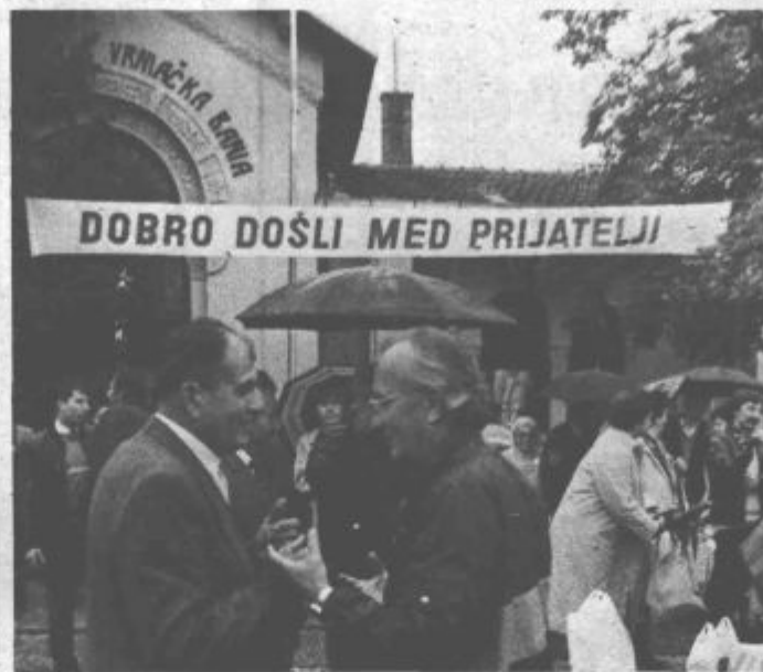
V pobrateni Vrnjački Banji

pokazala zobe, po dežju, ki je padal ob našem prihodu, je bilo tudi naslednje jutro še mirno. Pihal je mrzel veter, na nebu pa so posedali deževni oblaki. To pa nas ni odvrnilo, da ne bi odšli na Popino (lep spominski park), kjer je bila slovesnost ob 13. oktobru, dnevu popinske bitke, s katero se je začel nemški napad na Užiško republiko in ob 15. oktobru, dnevu osvoboditve Vrnjačke Banje.