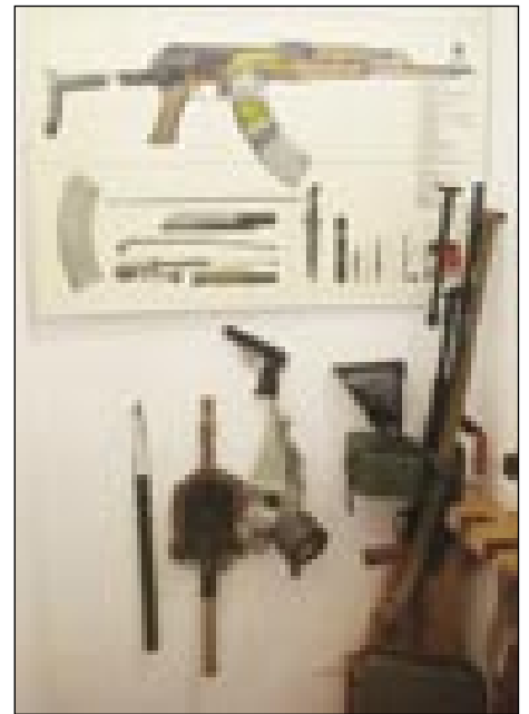
Takše pükše (brzostrelke) pa rabulfe so meli

»Od tauga so se prejdjni odlaučili. Dapa tak vejmi, prejdjnimi se je ta pokrajina sploj povidla, pa tau, ka je skrak