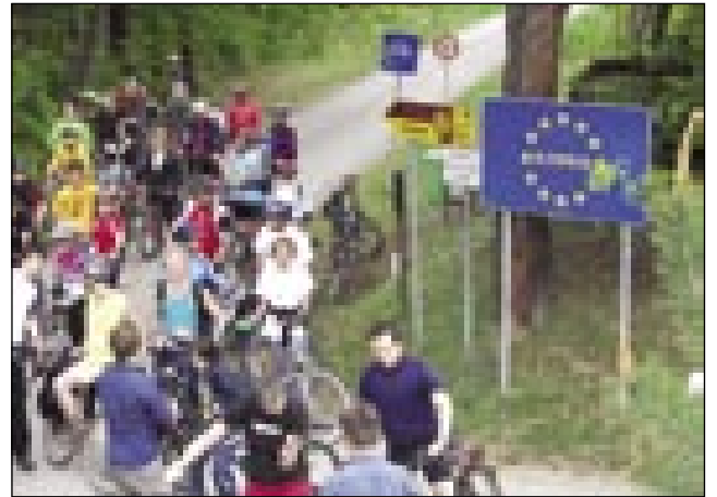
Kolesarji na cesti proti Tromejniku