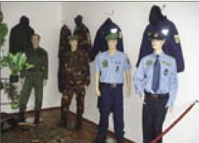
Starejše pa nauve uniforme mejne straže

»Leta 1992 so go zaprli pa je stala prazna cejlak do leta 2007, gda so go začnili obnavlati.«