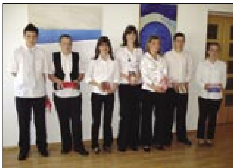
Udeleženci po tekmovanju

dani temi, zaigrajo situacijo v obliki dvogovora in odgovarjajo na razna vprašanja. Ustni del letošnjega tekmo-