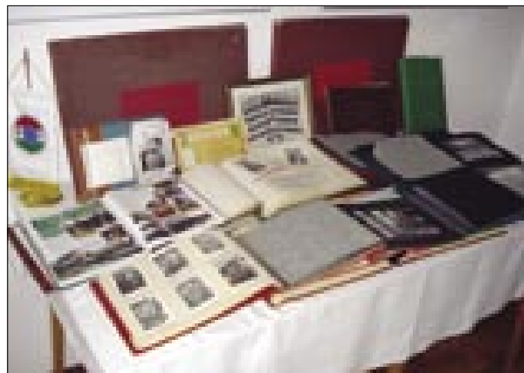
V tej knjigaj se najdejo tisti, steri so glasili tinjnce ali lidi iz vesi, če so steli na črno prejk granice titi

»V rosagi je mejna straža 11 uprav mejla, tej edenajset