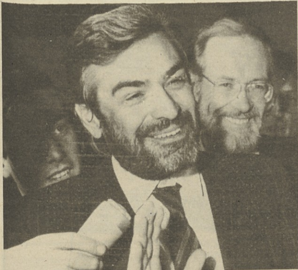
Mandatar Goria pred ciljem?

RIM — Nova vlada, ki jo bo vodil demokristijan Giovanni Goria, bo dejansko petstrankarska koalicija. Zeleni in radikalci so namreč včeraj po novem srečanju s poverjenim predsednikom dokončno sporočili, da ne bodo sodelovali v vladnem zavezništvu. A medtem ko so prvi že napovedali, da bodo ubrali pot odločne opozicije, Pannella in somišljeniki, kljub temu da jim je Goria zaprl vrata, še upajo v naklonjen razplet dogajanj. Po kolikor toliko uspelem programskem soočanju so pogajanja sedaj zaobjela porazdelitev ministrskih mest, pri čemer smo pričla običajnim polemikam med strankami in znotraj strank. Mandatar vsekakor upa, da bo jutri lahko sklical vrh vladne večine, že v soboto ali najkasneje v ponedeljek pa sestavi kabinet ter nato v roku enega tedna opravi vse ustavne dolžnosti.