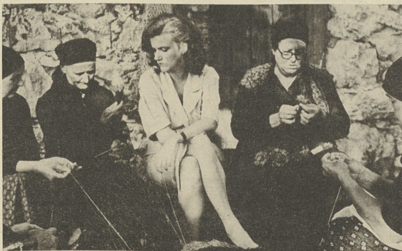
Prizor iz filma »Zaljubljeni«