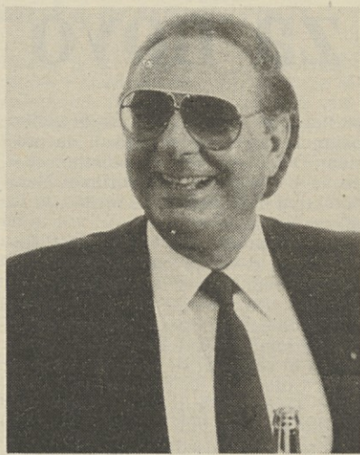
Predsednik De Riù - kaznovan s triletno prepovedjo opravljanja funkcij

Tržaška javnost je dokaj mlačno spremljala milansko razpravo in je