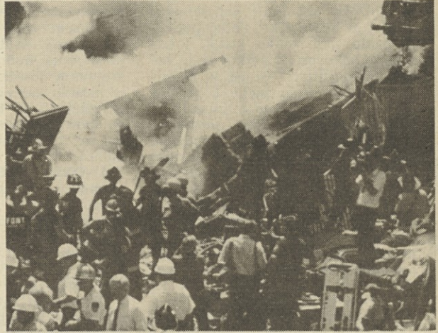
V eksploziji, ki sta jo povzročili dve jeklenki propana, so v New Yorku umrle štiri osebe, 21 pa jih je bilo hudo ranjenih