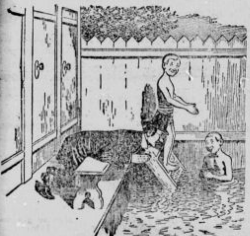
2. »Noge in roke potegni skupaj in jih krepko — — —«

Pri vsakem delu, doma, na vrtu in na polju se pripetijo ranitve, katere moramo varovati pred zastrupljenjem. Najboljše sredstvo za take slučaje je znano praško domače mazilo iz lekarne B. Fragnerja v Pragi. Glej inserat!