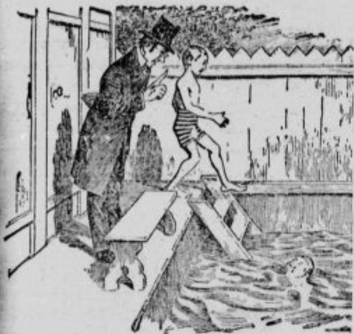
1. Užitej: »Franc, na ta način se nikoli ne priučiš plavanja; glej mene!«