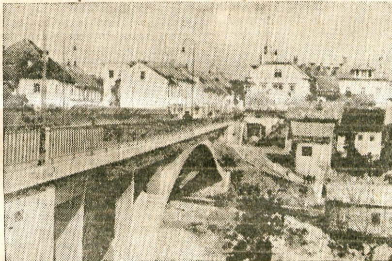
Črnomeljski frontovci so z velikim veseljem poprijeli za delo, ko so sklenili, da bodo zgradili most. Danes je ta most ponos Črnomeljcev in okolice ter važen gospodarski objekt.

par tisočakov za popravilo te ali one poti, ki pa so po navadi ostali v žepih gramoznih špekulantov, kateri so jemali v zakup gramoz za razna popravila poti. Razni politični mešetarji so vedno pitali Belokranjce le z obljubami. Zlasti ob volitvah so hodili merit vodovode, ceste, obljubljali elektriko, tovarne itd., nikoli pa niso ničesar napravili.