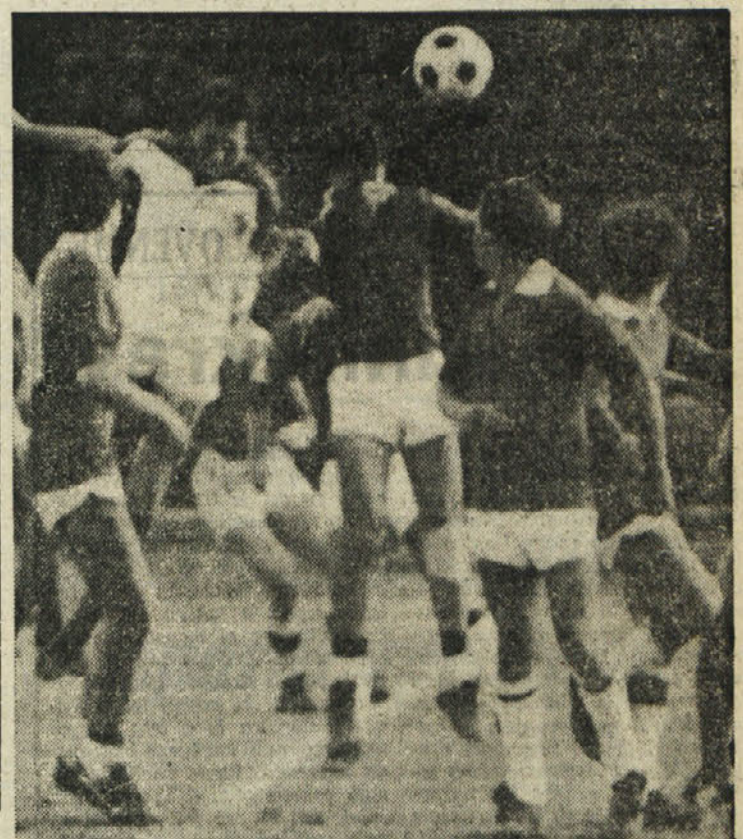
Kras (na sliki med tekmo proti Domiu) se bo jutri pomeril z novincem lige Olimpia

MONTECARLO - Organizatorji so sporočili, da bo prihodnji avtomobilski rally Montecarlo od 16. do 23. januarja prihodnjega leta. Računajo, da se ga bo udeležilo okrog 240 posadk.