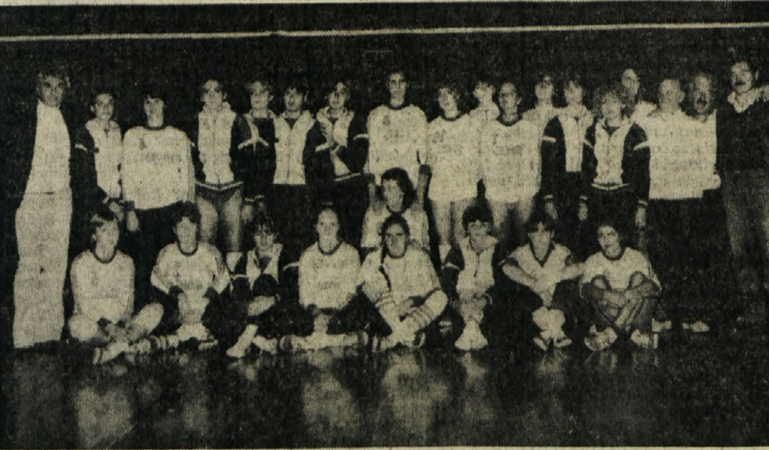
Odbojkarški ekipi nabrežinske Sokola in jugoslovanskega državnega prvaka. Radničkega iz Beograda, ki sta v sredo v Nabrežini odigrali prijateljsko srečanje