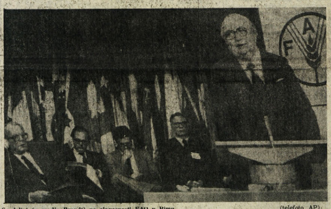
Spadolini (v ozadju Brandt) na slovesnosti FAO v Rimu

RIM — Ustanova OZN za kmetijstvo in prehrano je priredila včeraj po vsem svetu prvi »dan prehrane«. Slovesnosti v Rimu se je udeležil tudi predsednik vlade Spadolini, ki je predlagal ustanovitev svetovnih zalog hrane, poudaril, da je Italija že doletela 4.700 milijard lir za pomoč lačnim in 3 milijarde dodeliti nadaljnjih 3 tisoč milijard ter odobril posredovanje pri EGS. Obvezal se je tudi ustanoviti v Rimu Svetovni center za prehrano, kjer naj bi imele sedež vse pristojne ustanove. Za njim je spregovoril predsednik komisije za vprašanja razvoja, bivši nemški kancler Willy Brandt, ki je opozoril, da živi na svetu 800 milijonov ljudi v popolni bedi, 500 milijonov pa jih dobesedno gladuje. Take krivice vzbujajo brezup in sovraštvo in jim je treba napraviti konec, s tem da se preide od besed k dejanjem, je poudaril Brandt, ki je s tem v zvezi naslovil poziv na udeležence svetovnega vrha o odnosih Sever - Jug, ki se bo začel prihodnje dni v Cancunu v Mehiki.