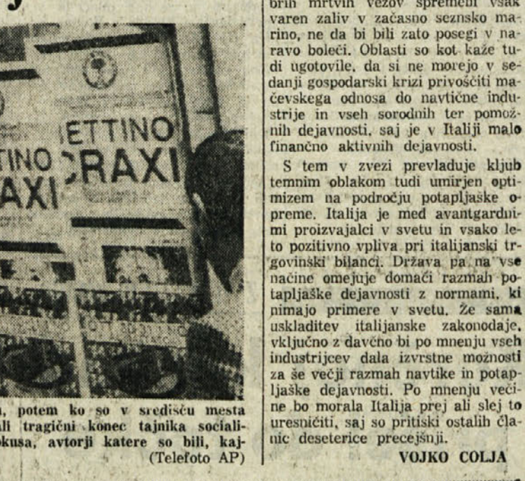
»Craxi je mrtev«. Vest se je nevedno naglo razširila po vsem Rimu, potem ko so v središču mesta navsezgodaj razohabili s črno barvo ukvirjene lepake, ki so navajali tragični konec tajnika socialistične stranke. Kmalu so ugotovili, da gre za lažno vest dvomljivega okusa, avtorji katere so bili, kajpak, uredniki satirinega tednika »Il Male«.