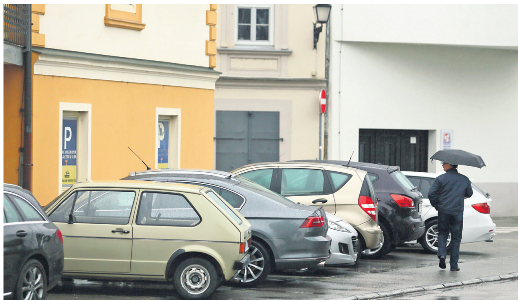
Dravska ulica: pločnik je vsakodnevno poln vozil, ki so povsem nepravilno parkirana.

Na tem območju, ki je v lasti Mestne občine Ptuj, je zarisanih