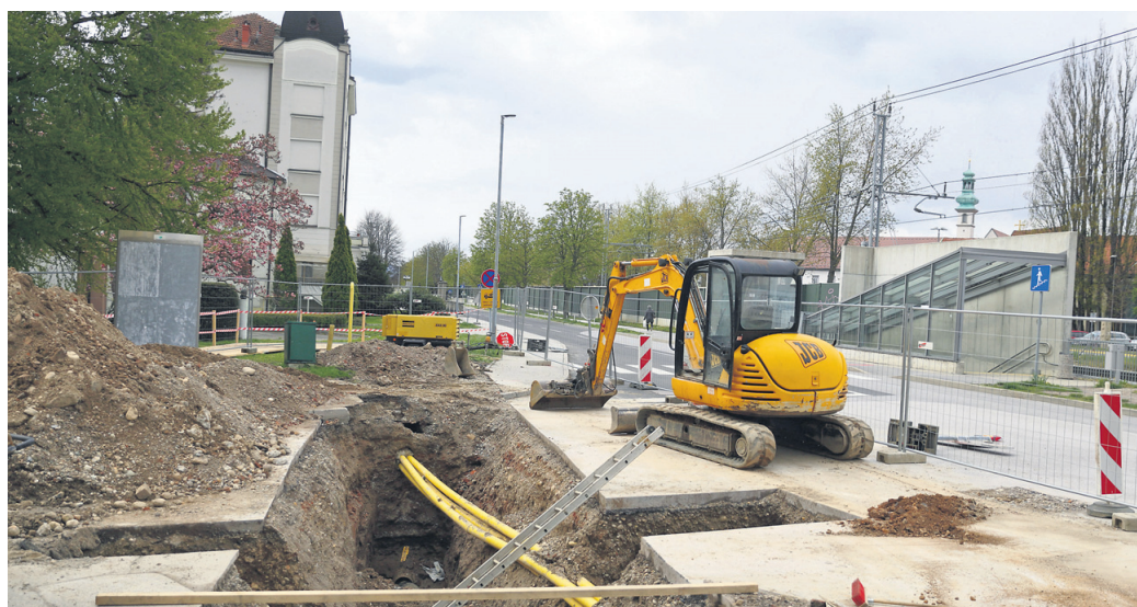
Razlog za cestno zaporo je odprava napak na plinovodnem omrežju.

Ptujjska občina sicer prav na tem območju načrtuje izgradnjo kolesarske steze in dela pločnika. Investicija je ocenjena na okrog