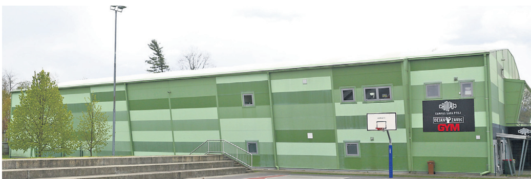
Občina prodaja parcelo, na kateri stoji Campus, in parcele tik ob dvorani, ki so v precej klavrnem stanju.

Ormož • Rezultati usklajevalnega sestanka pred likvidacijo tovarne Safilo