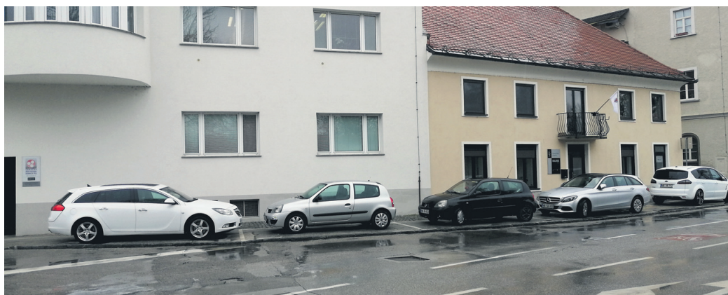
Mnogi se sprašujejo, kako to, da jo kršitelji velikokrat odnesejo brez globe. Redarji zagotavljajo, da bodo še pogoste prisotni na tem območju.

Ptuj • Dela na plinovodu bodo najbrž morali podaljšati