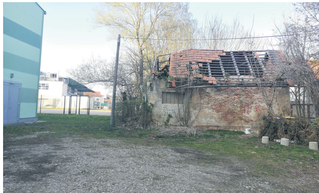
Kot je razvidno iz zemljiškoknjižnega izpiska, je MO Ptuj tudi lastnica območja, na katerem je podirajoči se objekt, neposredno ob dvorani.

Za prodajo omenjenih nepremičnin naj bi se vodstvo občine odločilo prvenstveno iz razloga