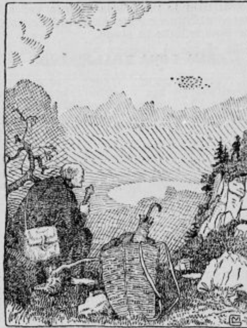
Možek je sedel na debelo korenino in takorekoč vsrkaval čarobno pokrajinsko podobo v svojo dušo.

»V boj za svobodo sinov! Dvigni, kosa se krvava, da zasije dan ti nov in še poznih vnukov slava!»