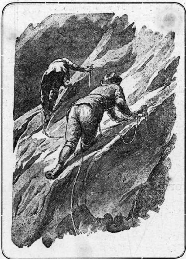
Na strmi steni.

Po visokih gorah pokriva skalovje gladka ledena skorja; po njej je težavno in nevarno korakati, dobro pa služijo krampeži po takem svetu.