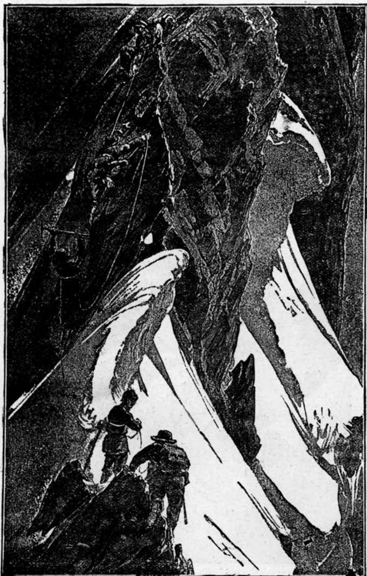
Na sneženem ostrem grebenu.

Gorolazec, ki je večš in izurjen plezalec, pleza zmerom molče in pazi posebno, kadar ima slabo stališče, da ne ruši in lomi rahlega in prhkega kamenja; on premisli in preudari vsaki korak in se ne prestopi, dokler nimajo roke in noge